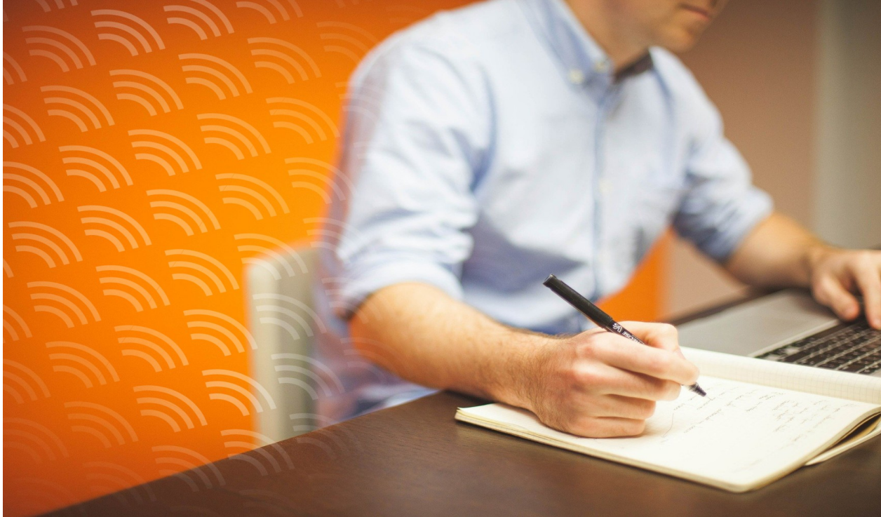
Dyżur konsultacyjny w formie telefonicznej i mailowej

Dyżur konsultacyjny odbył się w dniu 26 listopada, w godzinach 12:00 – 17:30 w formie telefonicznej i mailowej: