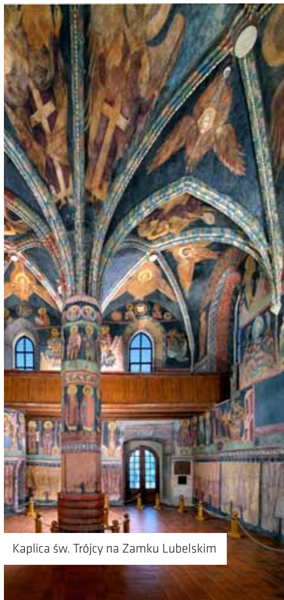
Kaplica św. Trójcy na Zamku Lubelskim