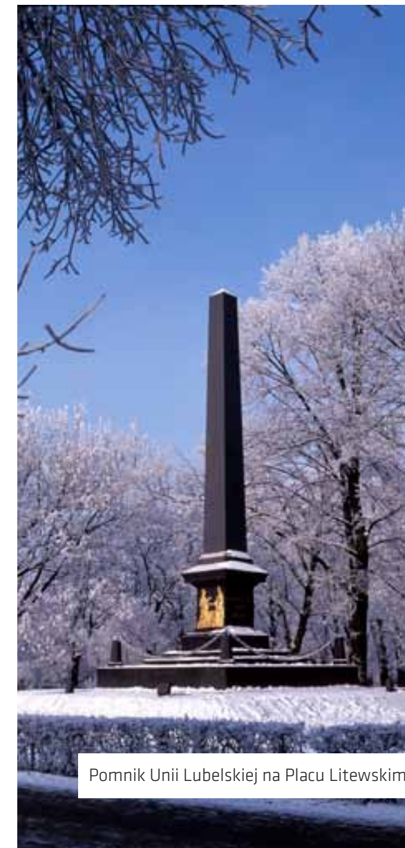
Pomnik Unii Lubelskiej na Placu Litewskim

Istniejący pomnik Unii Lubelskiej został wystawiony w roku 1826, w miejscu pierwotnego, rozebranego w l. 1819–1820. Wzniesiono go w formie żeliwnego obelisku na cokole, którego frontową powierzchnię zdoła złocona płaskorzeźba przedstawiająca dwie alegoryczne postaci w antycznych szatach podające sobie ręce; Polonię i Lituanie obrazujących akt połączenia unią dwóch wielkich europejskich państw: Polski i wielonarodowego Wielkiego Księstwa Litewskiego. Z drugiej strony cokołu umieszczono złocony napis objaśniający treść przedstawienia „Połączenie Litwy z Koroną”. Obecnie pomnik jest znakiem swoistej prefiguracji Unii Europejskiej – Rzeczypospolitej Wielu Narodów.