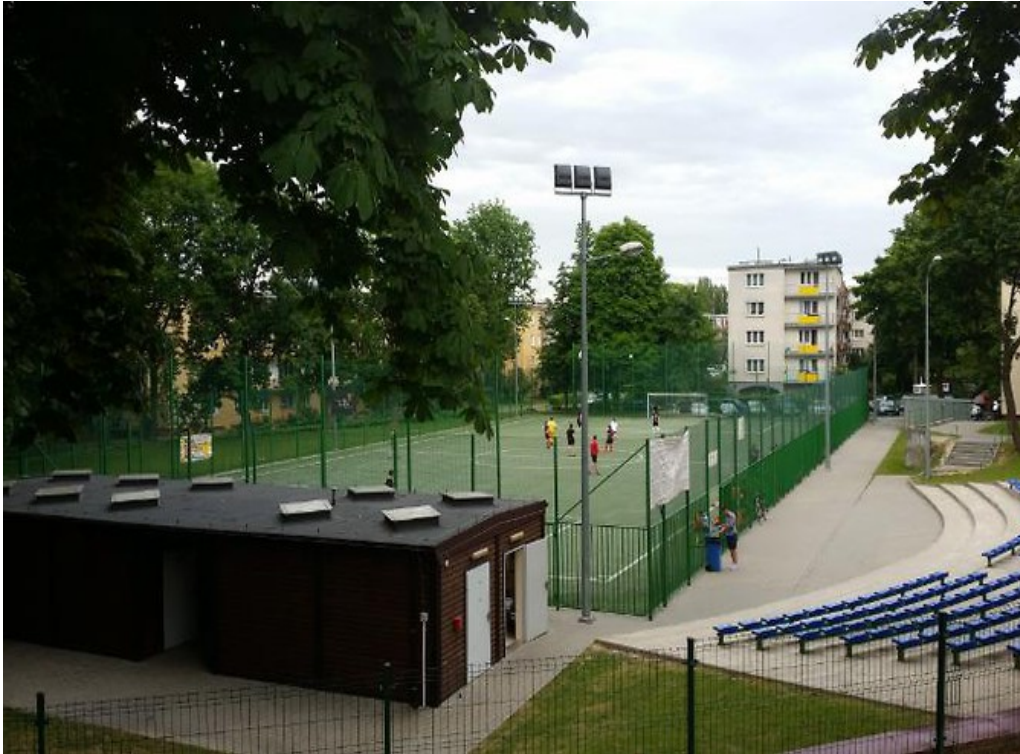
Комплекс полів “Орлик” при Люблінській початковій школі №29