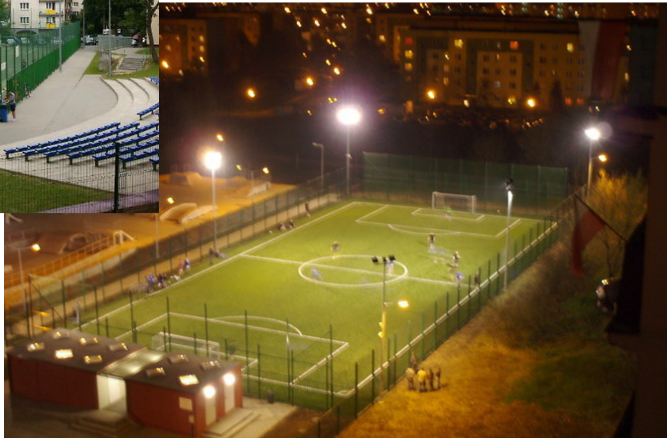
Комплекс полів “Орлик” при Люблінській початковій школі №42