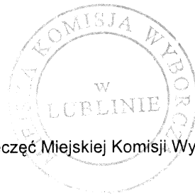
(pieczęć Miejskiej Komisji Wyborczej)