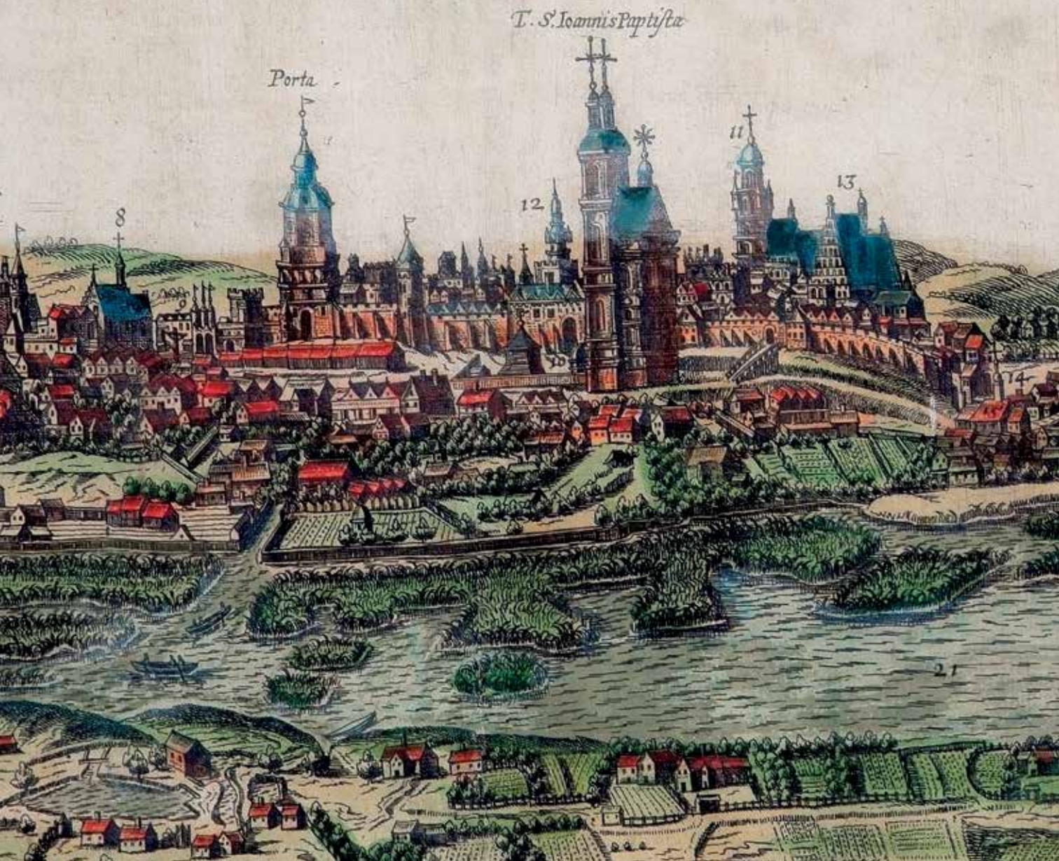
Lublin w roku 1618 - Widok miasta Lublina Hogenberga i Brauna

Zawarta w 1569 roku Unia Lubelska była wydarzeniem wielowymiarowym, które na wiele lat określiło porządek polityczny i społeczny w naszej części Europy. Powołana wówczas do życia Rzeczpospolita Obojga Narodów stanowiła rzadką w dziejach, udaną próbę zbudowania trwałego ładu w relacjach pomiędzy przedstawicielami różnych nacji, kultur i religii. Lublin – miejsce, w którym krzyżowały się szlaki łączące najważniejsze miasta zjednoczonego państwa – zyskał dzięki temu status jednego z ośrodków zachodzących wówczas przemian.