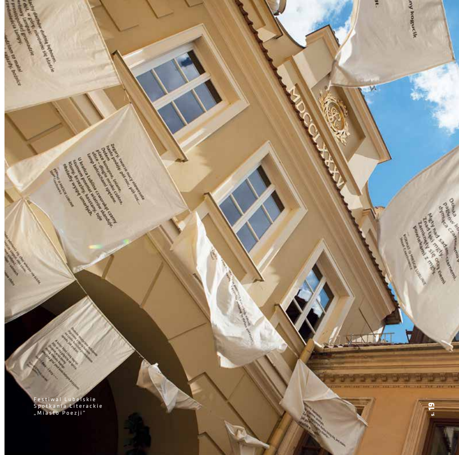
Festiwal Lubelskie Spotkania Literackie „Miasto Poezji”