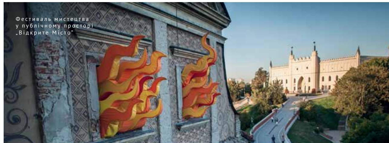
Фестиваль мистецтва у публічному просторі „Відкрите Місто”