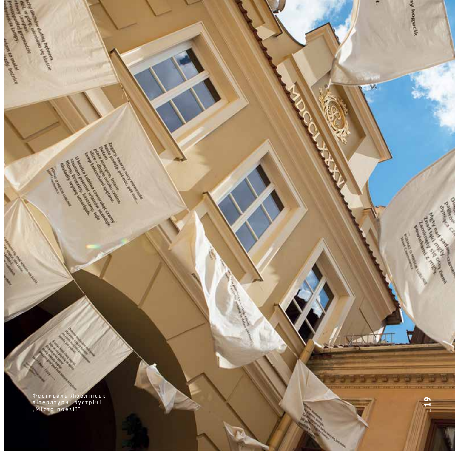
Фестиваль Люблінські літературні зустрічі „Місто поезії”