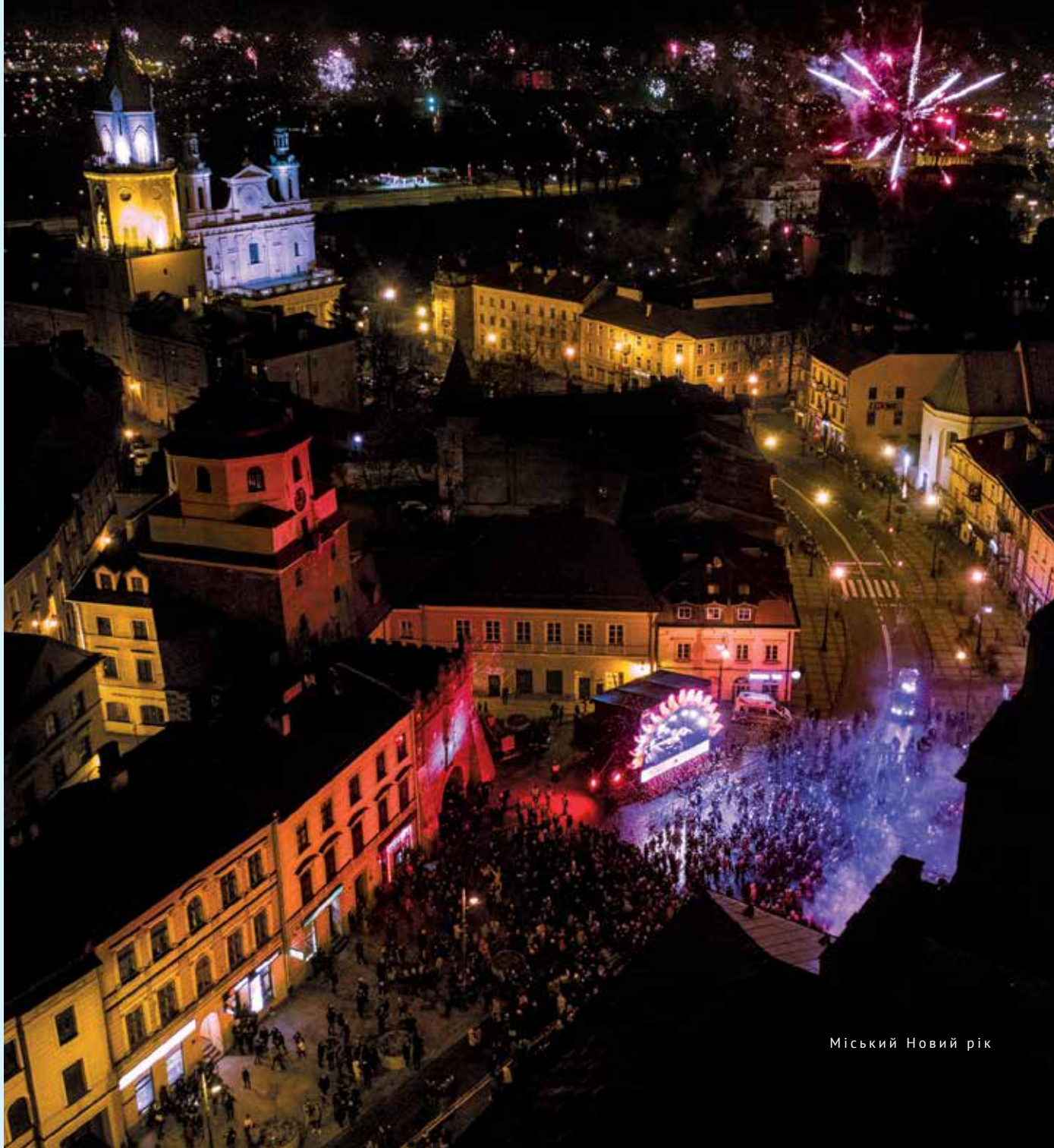
Міський Новий рік