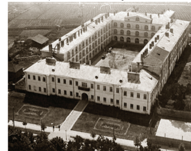
Édifice de la KUL. Photographie datant de la période de l'entre-deux-guerres.

En dépit des représailles, à l'initiative de l'abbé Antoni Szymański on organise des cours d'université clandestins. Ils se poursuivent sous sa direction jusqu'à sa mort en 1942.