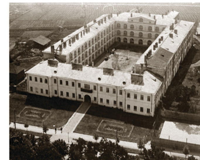
Gmach KUL. Fotografia z okresu międzywojennego.