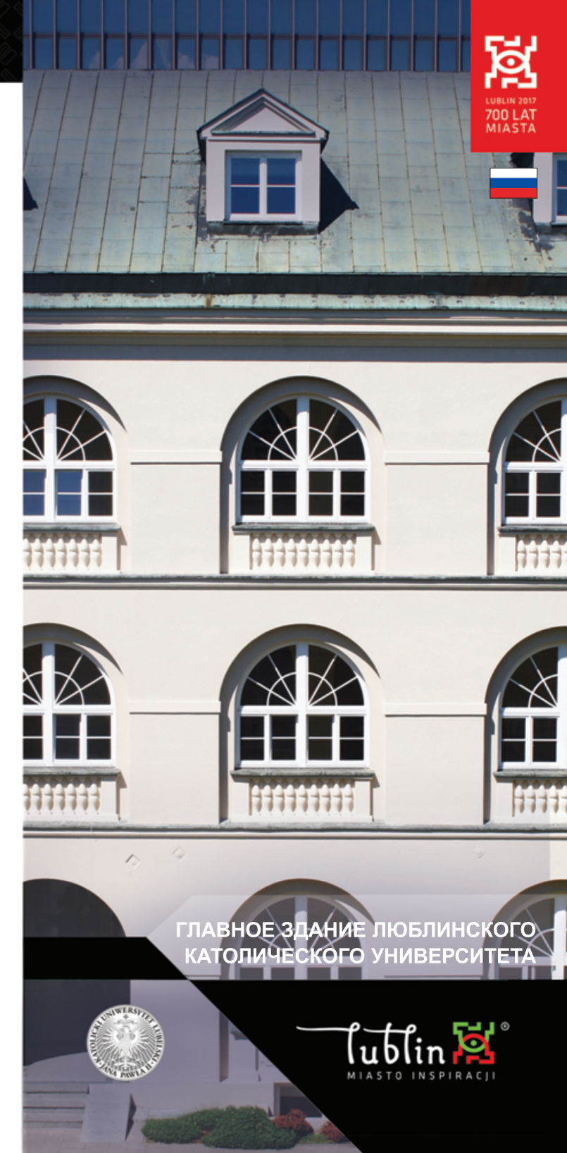
ГЛАВНОЕ ЗДАНИЕ ЛЮБЛИНСКОГО КАТОЛИЧЕСКОГО УНИВЕРСИТЕТА

Балясина – вертикальный элемент балюстрады, поддерживающий перила в виде столбика из камня или дерева.