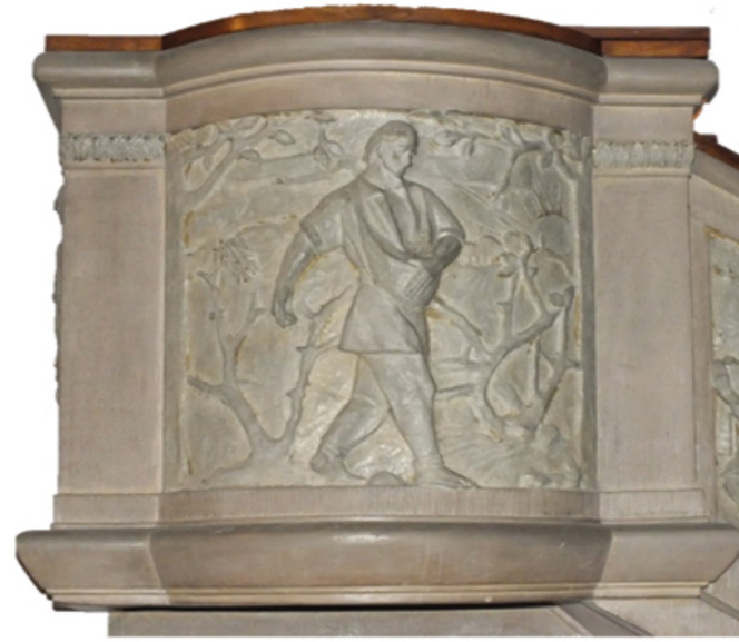
Ausschnitt der Kanzelverzierung im Hauptschiff.

backsteinerner Kirche ersetzt, die von Lubliner Bürgern und den Stadtherren gestiftet worden ist. Die Stifter wollten das Patronatsrecht über die Kirche für sich beanspruchen und wehrten sich dagegen, dass die ausschließliche Fürsorge über die Kirche den Chorherrenvikaren zufallen sollte. Sie argumentierten damit, dass sie das Land auf dem die alte Kirche stand von den Nonnen des Erlöserordens gekauft, und dazu noch einen wesentlichen Beitrag zur Errichtung der neuen Kirche geleistet hätten.