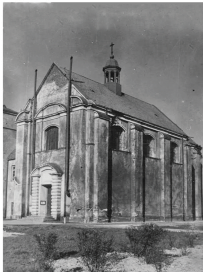
Fotografia z 1952 roku.

Mimo dobrego stanu świątyni drewnianej, w latach 1603-1623 zastąpiono ją kościołem murem, ufundowanym przez mieszczan lubelskich i władze miasta. Fundatorzy chcieli mieć prawo do patronatu nad kościołem i sprzeciwiali się, by wyłączna opieka przypadła wikariuszom kolegiaty. Argumentowali to faktem, iż grunt pod pierwotną świątynią odkupili od sióstr brygidek oraz włożyli znaczny wkład we wzniesienie nowej budowli.