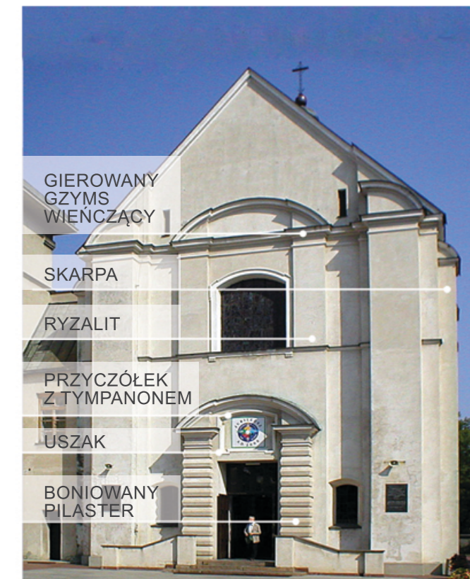
GIEROWANY GZYMS WIEŃCZĄCY

Kościół wg projektu Lalewicza zachował swoją formę do dnia dzisiejszego. Świątynia jest orientowana, założona na planie wydłużonego prostokąta z niższym, zamkniętym półkoliście prezbiterium. Elewacja frontowa o symetrycznej kompozycji, dwukondygnacyjna z silnie zaakcentowaną osią środkową, zwieńczoną trójkątnym szczytem. Na osi środkowej znajduje się dwukondygnacyjny, płytki ryzalit . Wejście główne do kościoła ujęte zostało portalem o dwu boniowanych pilastrach podtrzymujących przerywany przyczółek , zamknięty łukiem odcinkowym , w którego tympanonie ulokowano prostokątną płycinę z uszkami . Górna kondygnacja flankowana jest pilastrami dźwigającymi przyczółek zamknięty łukiem odcinkowym. Pomiędzy pilastrami osadzono duży prostokątny otwór okienny w profilowanej opasce, zwieńczony łukiem odcinkowym z wyobrażeniem Matki Boskiej Częstochowskiej.