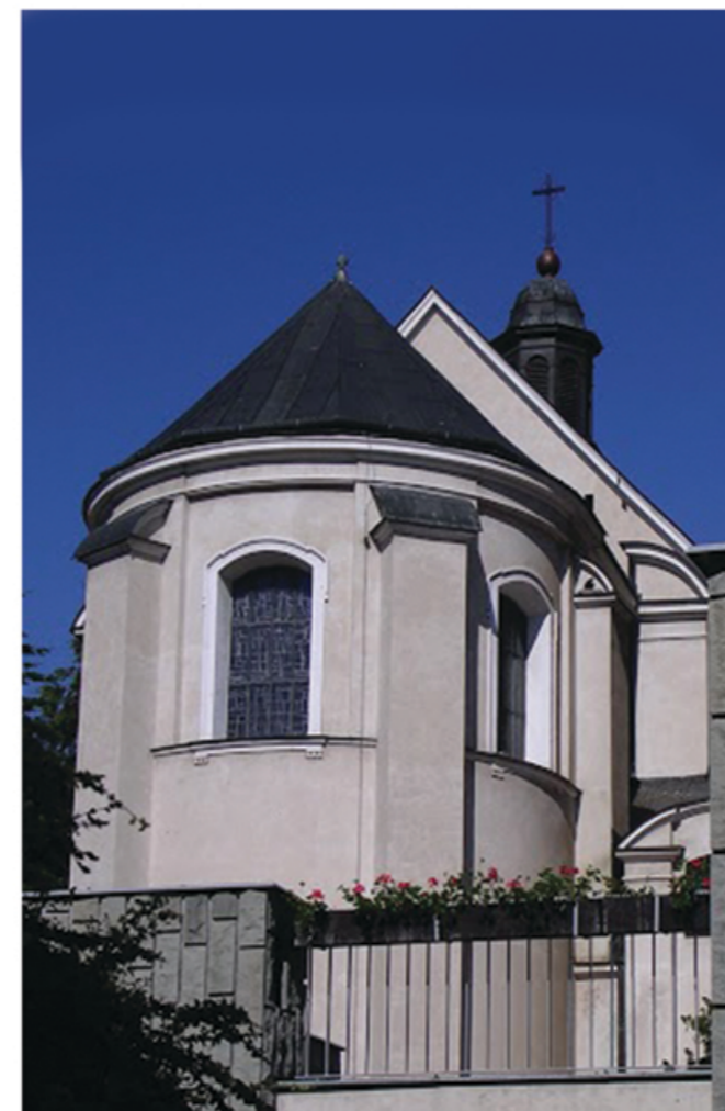
Widok na prezbiterium.

Po I wojnie światowej tzw. Koszary Świętokrzyskie przeszły w posiadanie Uniwersytetu Lubelskiego. Kościołowi św. Krzyża przywrócono funkcję sakralną, a teren wokół i samo jego wnętrze, uporządkowano. W okresie tym zaistniała potrzeba przebudowy kościoła, którą powierzono Marianowi Lalewiczowi. Prace nad realizacją projektu architekta rozpoczęły się jednak dopiero w 1934 r.