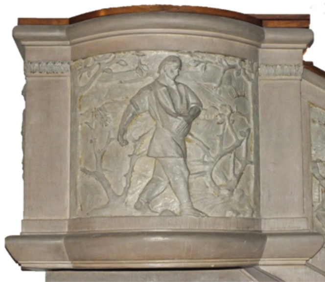
Фрагмент украшения амвона в центральном неффе.

к патронату костела и не соглашались, чтобы попечителями были одни викарии коллегиаты. Свою точку зрения они отстаивали фактом, что купили от сестер бригидок участок для постройки храма в его первоначальном виде и внесли большой вклад в постройку нового здания.