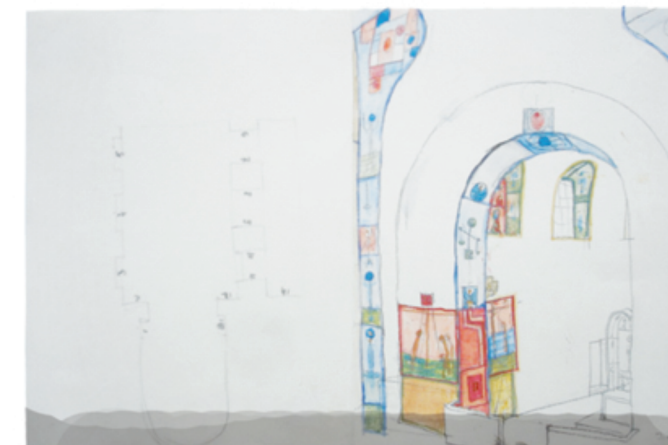
Невыполненная полихромия Ежи Новосельского, 1962, Галерея Стармах.

Внимания заслуживает круглая скульптура, изображающая фигуру распятого Христа, украшающая стену пресвитерия. Она выполнена в технике металлопластики, в железной жести.