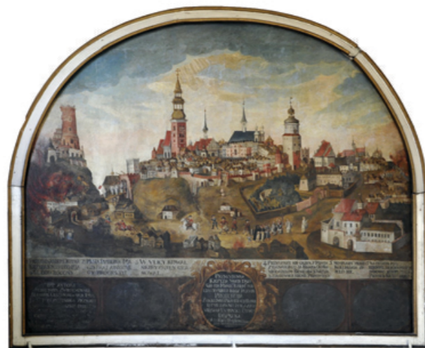
Pożar Lublina w 1719 r., ok. 1740 r.

Piątki: Droga Krzyżowa po mszy św. o 9:00 oraz o 17:15 Niedziele: po mszy św. o 16:00