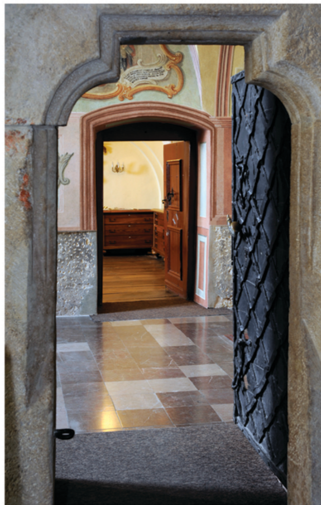
Gotycki portal w pierwszej zakrystii.