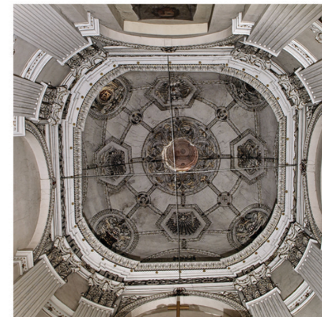
Sklepienie w kaplicy Firlejów.