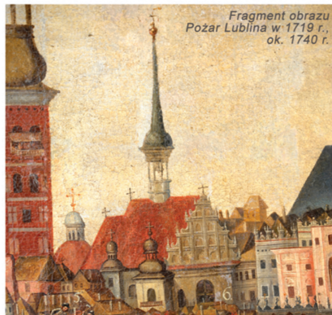
Fragment obrazu Pożar Lublina w 1719 r., ok. 1740 r.