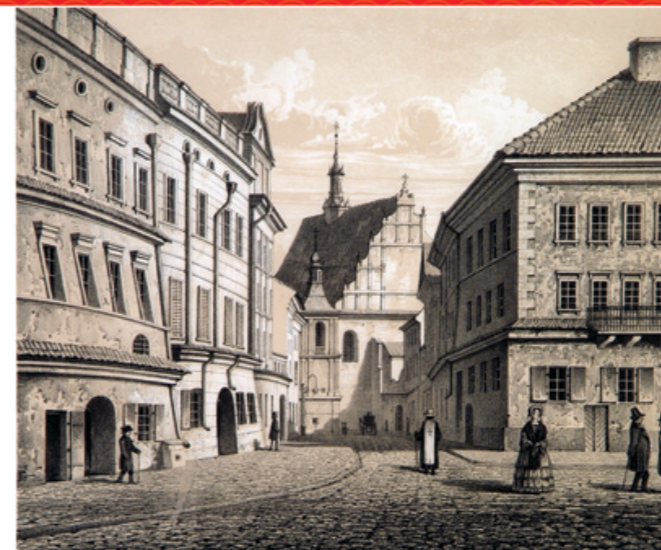
J. Cegliński, wg rys. A. Lerue, 1860 r.

kartusz - dekoracja w formie tarczy stanowiącej ozdobne obramowanie herbu, monogramu lub emblematu; kościół halowy - w architekturze typ chrześcijańskiej świątyni wielonawowej o nawach tej samej wysokości; pilaster - pionowy element wystroju architektonicznego z bazą i kapitelem - odpowiednik kolumny, służący rozcłonkowaniu ścian; refektarz - pomieszczenie służące jako sala jadalna.