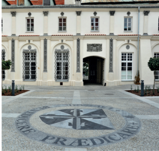
Большой внутренний двор

В 1758 г. был основан музыкальный хор по проекту архитектора Юзефа Гринзенбергера. Часть заказа должна была выполняться по проекту Франческо Пладици, однако большая часть работ не была завершена. К XVIII в. восходят также характерные детали устройства костела: комплекс алтарей эпохи позднего барокко в нефном корпусе и часовнях костела, выполненных в мастерской Себастьяна Цейсля в г. Пулавы и классицистический главный алтарь (1794), отделяющий центральный неф от монашеского хора и два амвона в стиле рококо (отсюда традиция «двух амвонов», продолжающаяся по сей день, по которой организовались диспуты с иноверцами). В 1884 г. монастырь был ликвидирован царской властью, а оставшиеся здания послужили военной казармой, в 1886 г. костел нашелся под управлением епархиального духовенства. В 1900 г. монастырские постройки перешли в руки Люблинского благотворительного общества, организовавшего здесь разные мероприятия, выставки. Некоторое время здесь существовала штаб-квартира Люблинского музея и сиротский дом.