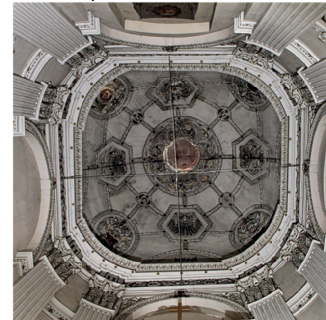
Свод в часовне Фирлеев

По мнению части историков, в 1569 г. в готической трапезной с нервюрным сводом была заключена Люблинская уния и приносили присягу на верность польские и литовские послы. Однако большинство историков полагает, что она была заключена в люблинском замке. В северо-западном углу большой трапезной размещена чугунная отливка Пресвятой Богоматери 1904 г., по случаю 50-ой годовщины догмы о Непорочном зачатии Пресвятой Девы Марии, над переездом в воротах в его восточном крыле стоит каменный картуш с парой путти в шлемах и каменные пилястры с канделябрными украшениями (из мастерской Берреччи), предположительно, перенесенные из люблинского замка или выполненные в начале XX в. вместе с перестройкой неоренессансного южного крыла. Часть исследователей замечает в них персонафикацию унии Польши и Литвы в 1569 г. В северном крыле стоит посетить доминиканский музей, хранящий ценнейшие экспонаты, в том числе ценное распятие, перед которым, по всей вероятности, приносили присягу польские и литовские послы во время церемонии принятия присяги люблинской унии.