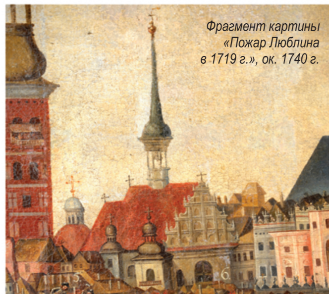
Фрагмент картины «Пожар Люблина в 1719 г.», ок. 1740 г.

В 2015 г. город Люблин получил знак Европейского наследия как место заключения Люблинской унии – исключительный символ мирной и демократической интеграции двух стран, с сосуществовавшими на их территории разными исповеданиями и нациями. Эти идеи сохранились в виде материальных памятников в пространстве города Люблина как свидетелей заключения унии и увековечивающих это событие. К ним относятся: часовня Св. Троицы в Люблинском замке, памятник Люблинской унии, а также костел Св. Станислава Мученика и Епископа и монастырь оо. доминиканцев.