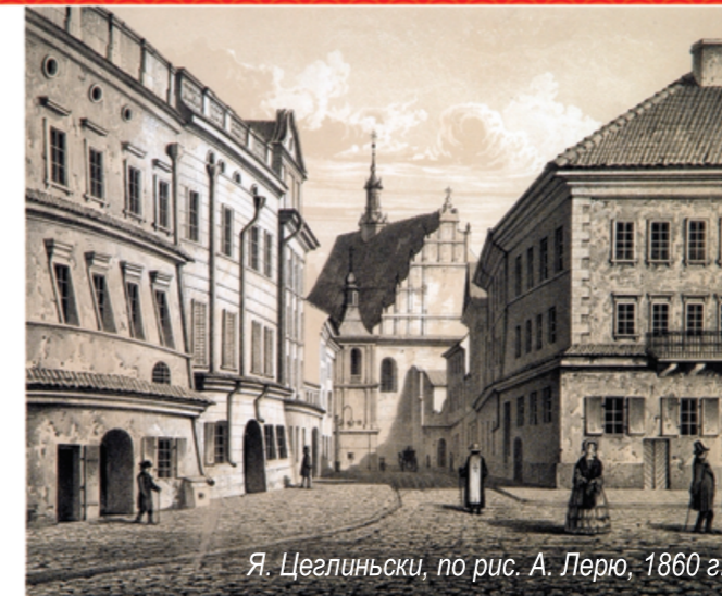
Я. Цеглиньски, по рис. А. Лерю, 1860 г.

Картуш – украшение в виде щита, представляющего собой декоративное обрамление герба, монограммы или эмблемы;