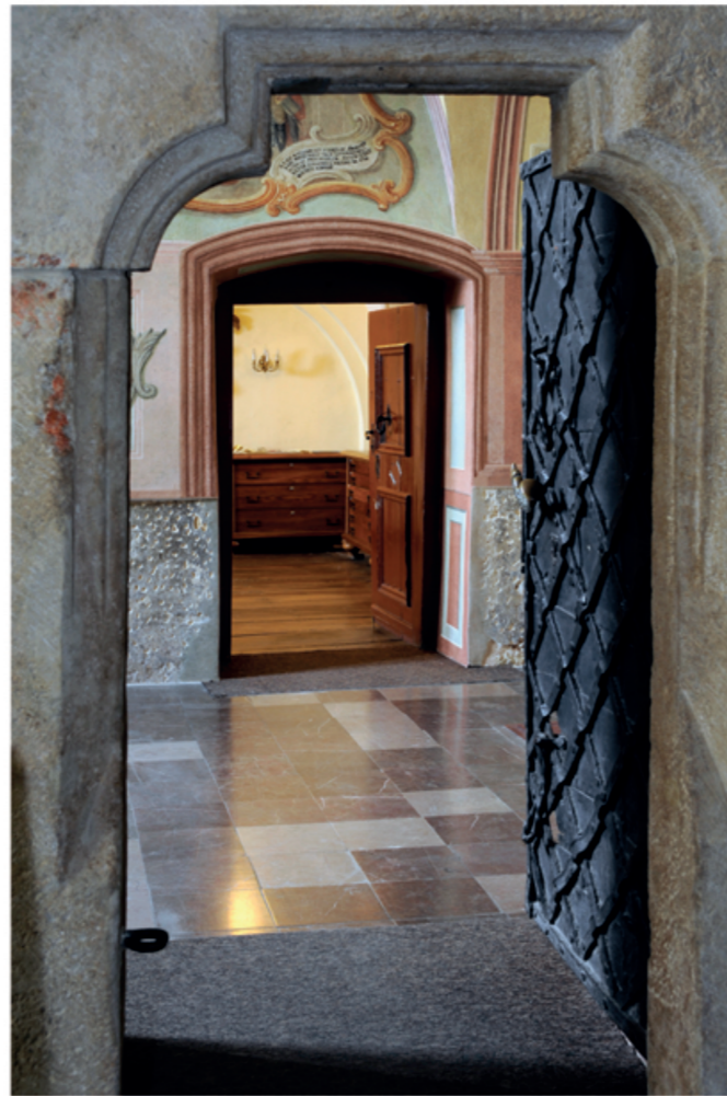
Готический портал в первой ризнице

Существуют два разных сообщения по поводу появления мощей Древа Святого Креста в Люблине. Согласно Яну Длугошу, мощи привез в Люблин и подарил доминиканцам киевский князь Григорий при Казимире Великом. Более поздние доминиканские источники содержат другую информацию, согласно которой мощи появились в Люблине во время царствования Владислава Ягелло, благодаря помощи доминиканского киевского епископа Андрея.