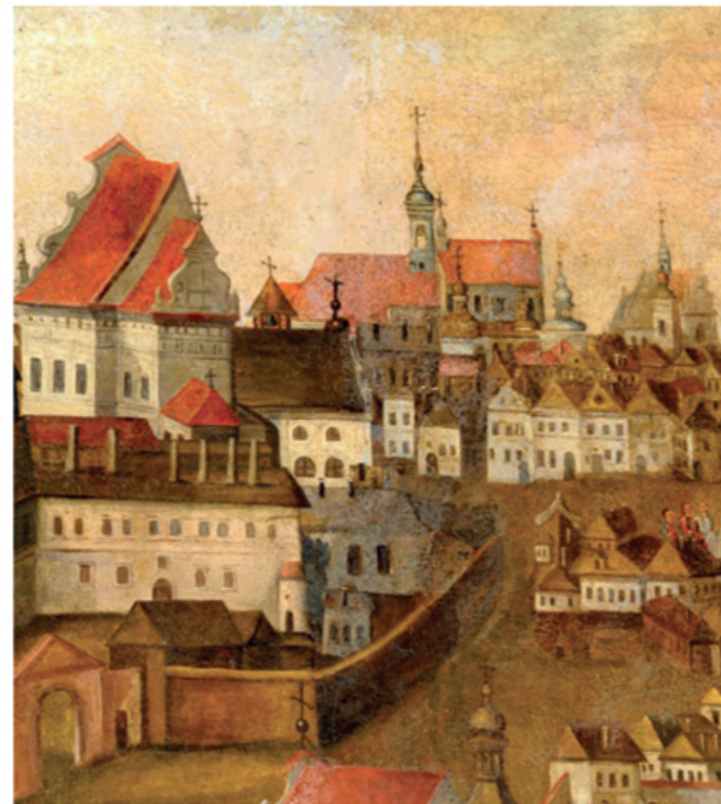
Fragment du tableau „Incendie de Lublin en 1719, alentours de 1740.

Il est à mentionner que dans la première moitié du XVII s. les échevins de la ville font venir à Lublin l'Ordre des Carmes Déchaux. Ils auraient eu pour mission de sauver le complexe de la Sainte-Croix du déclin. Ils se révèlent pourtant de très mauvais gestionnaires et quittent le bénéfice rapidement. Ils restent à Lublin cependant et bâtissent ici leur propre couvent. La prévôté d'hôpital perd beaucoup de ses terrains en faveur de l'Ordre. Les différends de propriété opposent par ailleurs le prévôt, les carmélites et les autorités municipales durant de longues années. L'église s'en sort de moins bien et son état technique est désespérant. « Les eaux de pluie s'infiltrèrent du haut du toit endommagé dans l'intérieur de l'église, elles font tomber des pierres du mur près de l'autel. De même un caniveau que les carmélites ont l'idée d'installer derrière un grand autel cause de grands dégâts. En période de dégel, les eaux usées inondent non seulement le cimetière mais aussi le porche de l'église ». On a le droit de supposer que depuis XV s. déjà l'église avoisine en plus de l'hôpital, le cimetière et la morgue. Les dates de leur destruction ne sont pas connues. On sait néanmoins qu'une visitation datant