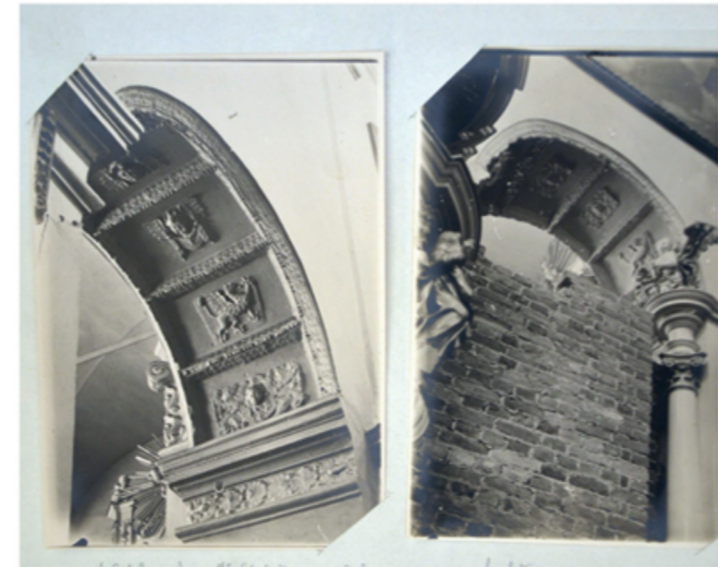
Matériaux d'archives de la Sainte-Croix 1917.

de 1721 constate l'existence des bâtiments d'habitation s'élevant sur le lieu de l'ancienne nécropole. Ce n'est que dans les années 40 du XVII s. que de sérieux travaux de remise en état de l'église sont entrepris.