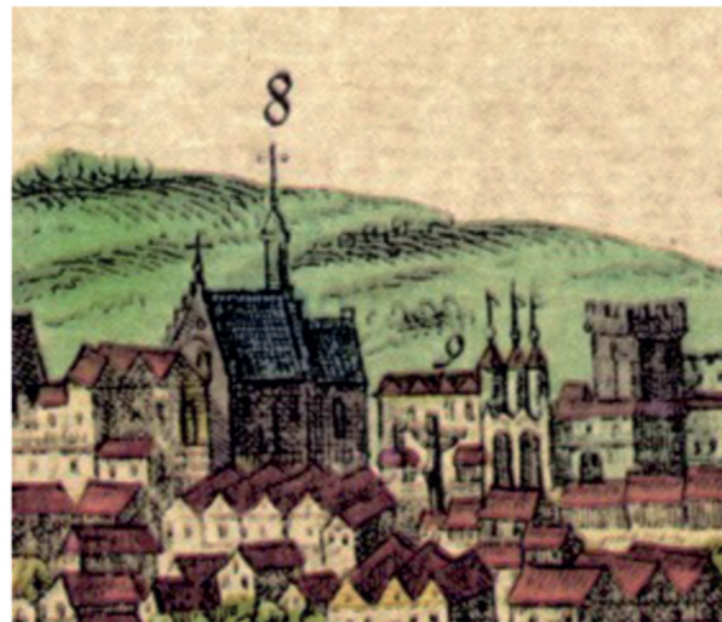
Fragment d'une gravure présentant une vue de Lublin, A. Hogenberg, Civitates orbis terrarum, 1618.

PLEASE DO NOT FORGET THAT YOU ARE IN CHURCH. DO NOT VISIT/TOUR DURING THE SERVICE. ACT WITH RESPECT, WHISPER WHEN NECESSARY.