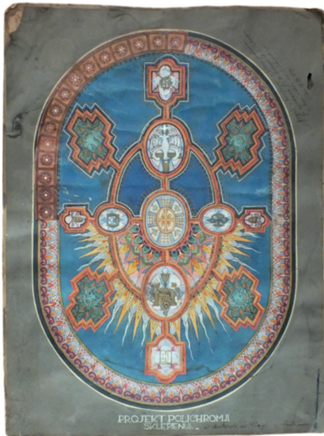
Projet de polychromies sur la voûte du presbytère de 1924.

On doit cependant croire que les travaux de restauration suivent leur cours puisqu'en 1608 on reconstruit l'église, la chapelle Saint-Stanislas et l'un des autels. L'église revêt une nouvelle forme architecturale après 1623 grâce, comme on le croit, à un bâtisseur de Lublin, Jan Cangerle. On lui attribue aussi l'oeuvre de faire recouvrir le presbytère d'une coupole sur un plan oval et de l'orner avec des stucatures.