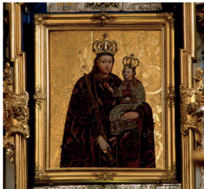
Notre-Dame de la Sainte-Croix (appelé Notre-Dame du Bon Conseil).

À l'intérieur, la nef principale s'ouvre vers les nefs collatérales inférieures. La nef principale est couverte de voûte croisée en ogives. Le presbytère par contre possède une coupole elliptique décorée dans le style dit Renaissance de Lublin.