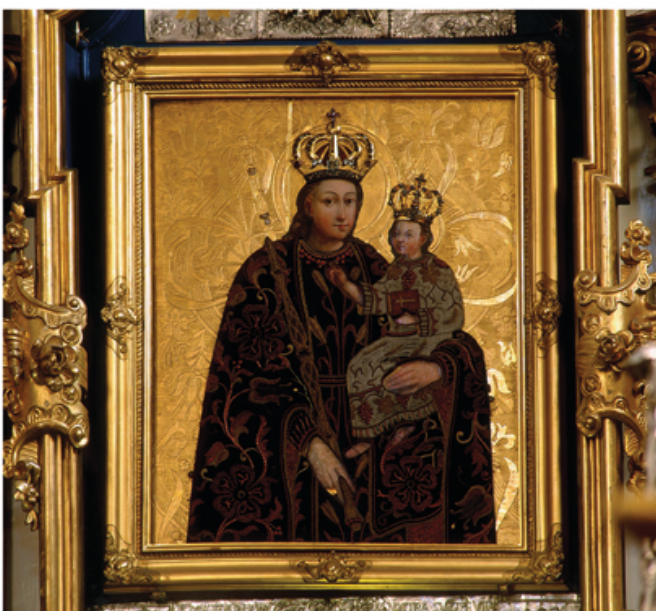
Matka Boska Świętoduska (zwana Matką Boską Dobrej Rady).

We wnętrzu nawa główna otwiera się wysokimi dekorowanymi arkadami filarowymi do niższych naw bocznych. Nawa główna przykryta jest sklepieniem kolebko-krzyżowym na gurtach i oddzielona od prezbiterium łukiem tęczowym . Prezbiterium wieńczy eliptyczna kopuła, która podobnie jak sklepienia i podłucha arkad naw bocznych, zdobi sztukateria w typie lubelskim .