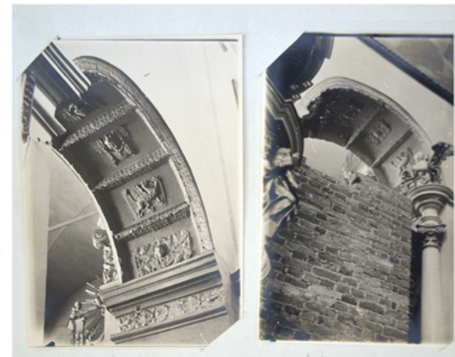
Materiały z archiwum św. Ducha, fot. S. Komornicki 1917 r.

Gruntowną odnowę zniszczonego kościoła przeprowadzono dopiero w latach 40. XVII w. Osiemnastego lipca 1642 r. w kościele miało miejsce cudowne wydarzenie. Uczeń Jakub Leneczowski, modląc się przed egzaminem, ujrzał krwawe łzy na obrazie Matki Boskiej. Obraz został uznany za cudowny vox populi , czyli z rozgłosu, lecz nie z dekretu papieskiego. Do wizerunku Matki Boskiej Świętoduskiej przybywali, prosząc o wstawiennictwo, mieszkańcy lubelscy, okoliczni mieszkańcy, ale również i takie znamienite postaci jak m.in. Piotr Skarga czy królowa Marysieńka Sobieska.