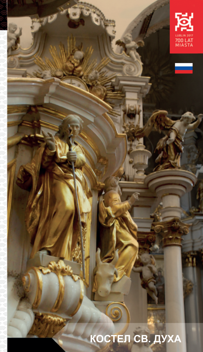
КОСТЕЛ СВ. ДУХА

Подготовка текста: Ольга Пикуль Графическое оформление: Рената Сидор, Магдалена Шабала, Моника Тарайко Редакционная коллегия: К. Черлюнчакевич, Н. Мончик, М. Тшевик Перевод: Мария Моцаж-Клейдиенст Издатель: Правительство города Люблина – Бюро городского реставратора памятников Люблин 2017 Издание 1-ое lublin MIASTO INSPIRACJI