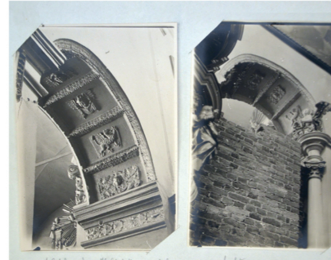
Материалы из архива св. Духа