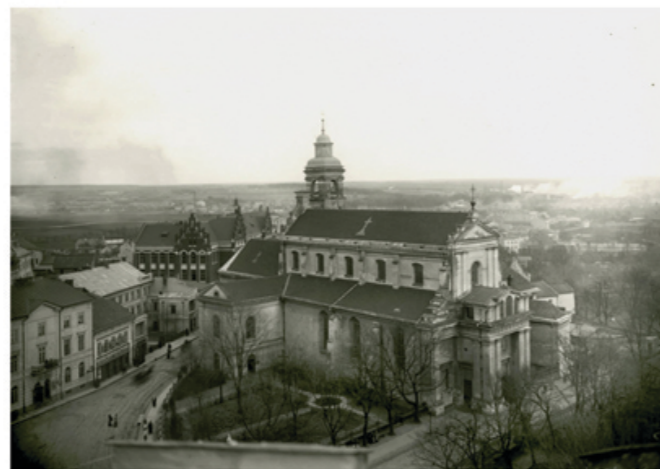
Fotografia z okresu międzywojennego.

W swej gotyckiej fazie kościół bernardynów był zapewne trójnawową halą , z prezbiterium zamkniętym prostą ścianą albo trójbocznie. Kościół był krótszy niż obecnie o jedno przęsło od strony zachodniej.