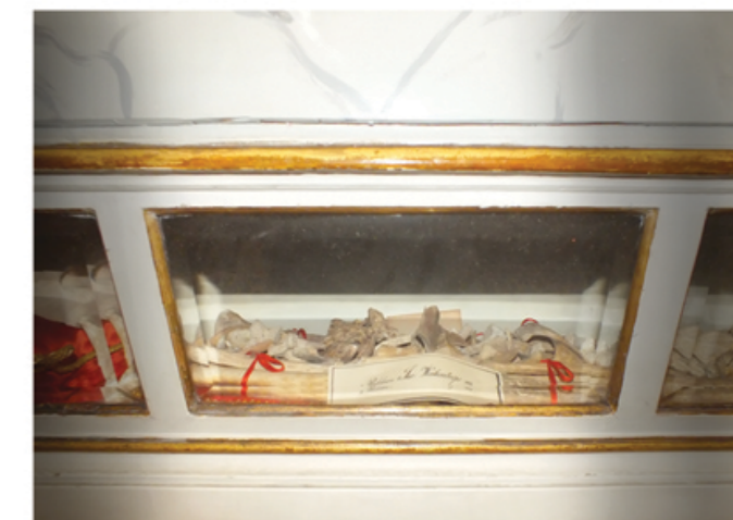
Relikwie św. Walentego.