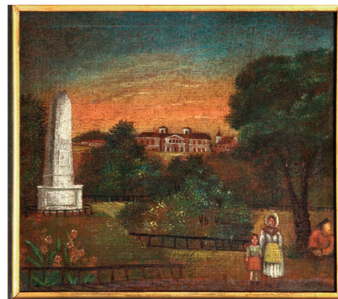
Auteur inconnu, Monument à l'Union de Lublin, second quart du XIX s., Musée de Lublin.

La Commission Européenne par la décision du 10 mars 2015 (JO de la CE, 2015/C83/0) attribue Lublin, en tant que ville de l'Union de Lublin, le Label du Patrimoine Européen en reconnaissance de ce symbole unique d'une intégration pacifique et démocratique des deux pays marqués par les différences ethniques et religieuses.