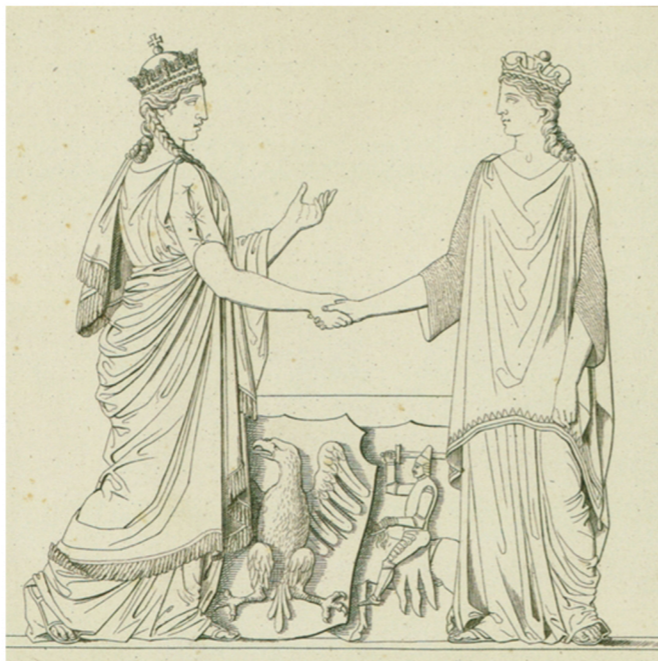
F.K. Christiani, croquis d'un bas-relief réalisé, 1825, Bibliothèque Nationale de Varsovie.

que les portes verrouillables par lesquelles on peut accéder à l'intérieur de l'obélisque. Une inscription RESTAURÉ L'ANNÉE MDCCCXXV du côté ouest du monument.