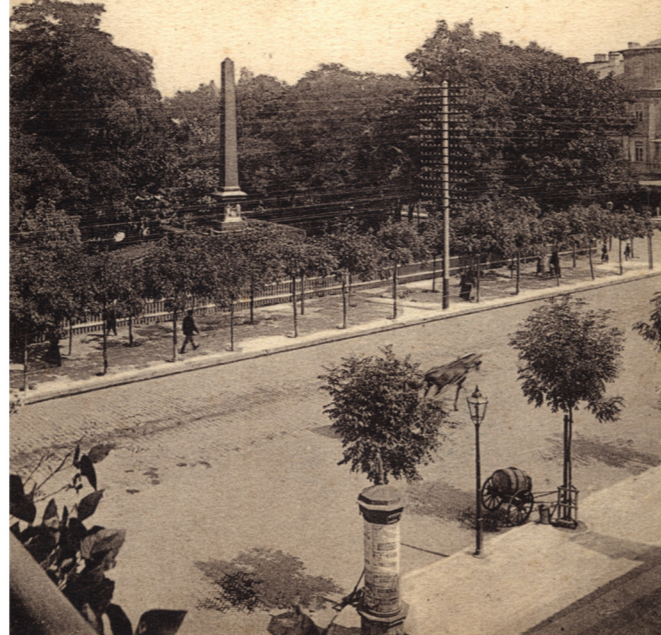
Photographie datant de 1916.

un cimetière avoisinant le couvent et entouré d'un mur. Au tournant des XVIII et XIX s. les édifices des bonifratres tombent en ruines, les moines déménagent donc et s'installent dans un couvent des réformates rue Bernardyńska 15. En 1819, le général Józef Zajączek, gouverneur du Royaume de Pologne décide de faire démolir le monastère et l'église en affirmant que „puisque cela est vide et regratté, il convient de le supprimer”. C'est lors de la démolition des murs en 1820, comme on le suppose, l'obélisque est également détruite. Le monument est renversé et brisé en morceaux y compris les statues en pierres. Józef Domański, président d'une Commission pour la Voïvodie qui est à l'origine de cet acte, en acquiert une réputation infâme en conséquence.