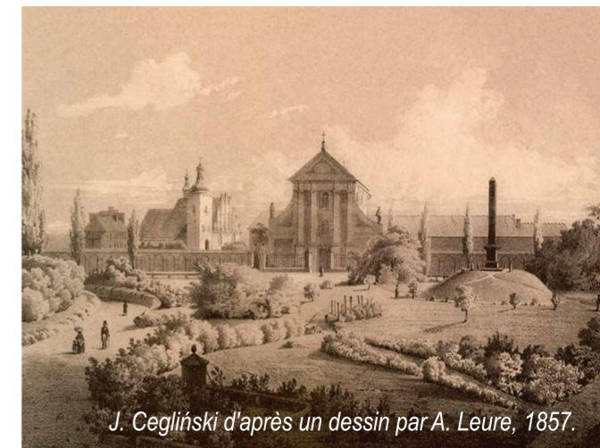
J. Cegliński d'après un dessin par A. Leure, 1857.

Au sens matériel, ces idées se traduisent en quelques monuments marquant le paysage urbain de Lublin. Ils sont là pour témoigner de l'Union et pour la commémorer. Ce sont notamment la Chapelle de la Sainte-Trinité, le Monument à l'Union de Lublin, l'église Saint-Stanislas Évêque Maryr ainsi que le couvent des Dominicains.