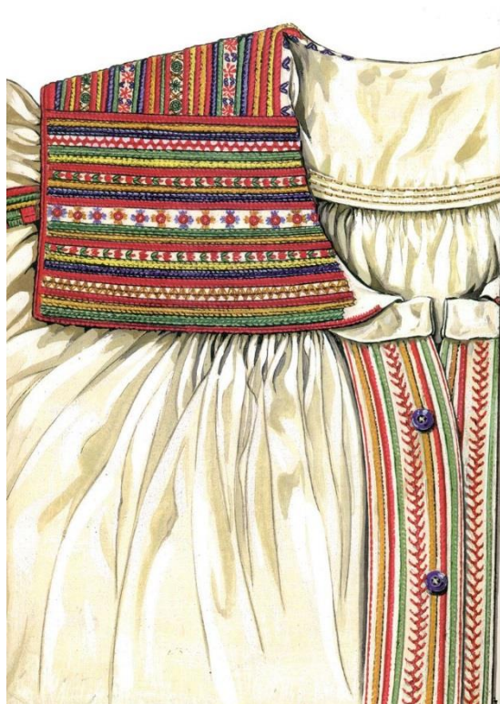
Hafty na koszuli kobiecej (stroje krzczonowskie), rys. Turska J., Polski haft ludowy, Warszawa 1997.