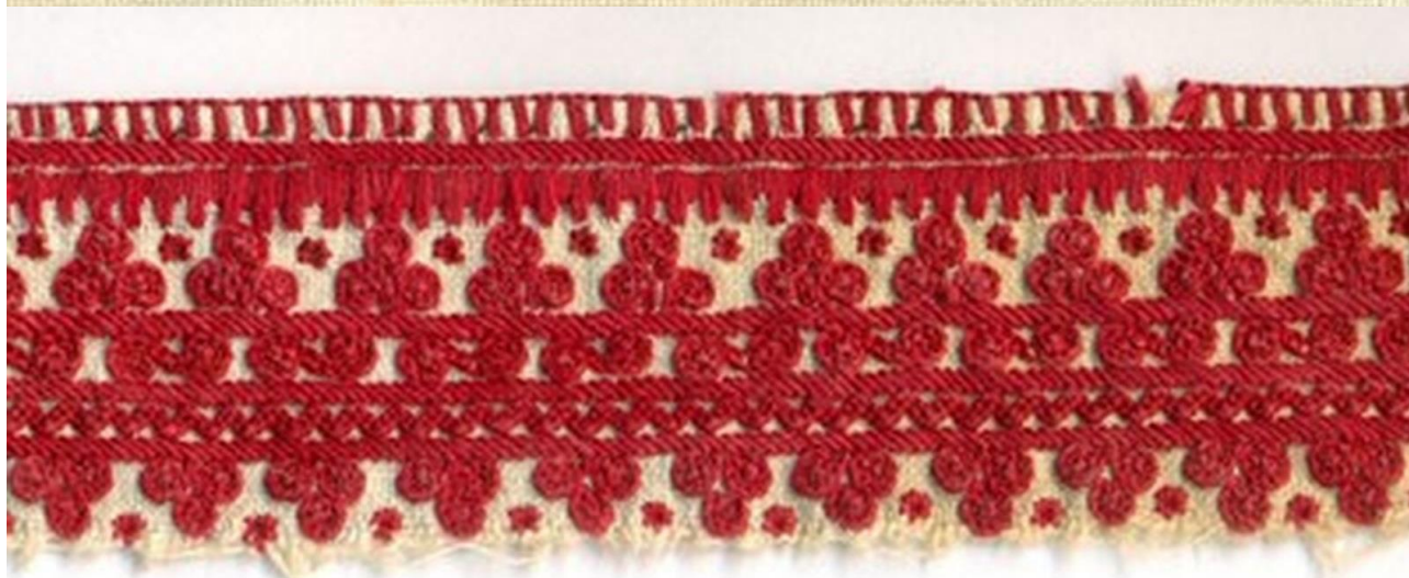
Haft łańcuszkowy (stroje biłgorajskie), pocz. XX w., pow. Biłgoraj

Najpowszechniejsze w stroju biłgorajskim były hafty wykonywane podstawowymi ściegami licznymi (łańcuszek i atłasek prosty uzupełniony stębnówką i ściegiem dzierganym), ułożone pasowo i związane ściśle ze strukturą tkaniny. Czerwone lub czarne początkowo, potem też niebieskie wzory tworzyły misterne szlaki przyozdabiając kobiece elementy płóciennego stroju. Zdarzały się kompozycje dwubarwne (czerwono-czarne) lub trójbarwne (czerwono-czarno-niebieskie). Najczęstszymi motywami były woluty (ślimacznice) w formie spirali lub zawoju. Mogły występować pojedynczo, podwójnie, potrójnie lub po pięć, układając się wówczas w kształt drzewka. Sukmany obszywano granatowymi sznurkami, a kożuchy wyszywano na zielono i czerwono haftem płaskim, w trzy rodzaje motywów: łapki (trzy trójkąty połączone wierzchołkami, ułożone na planie kwadratu), skrzyneczki (rodzaj trójkąta równoramiennego) i gwiazdki