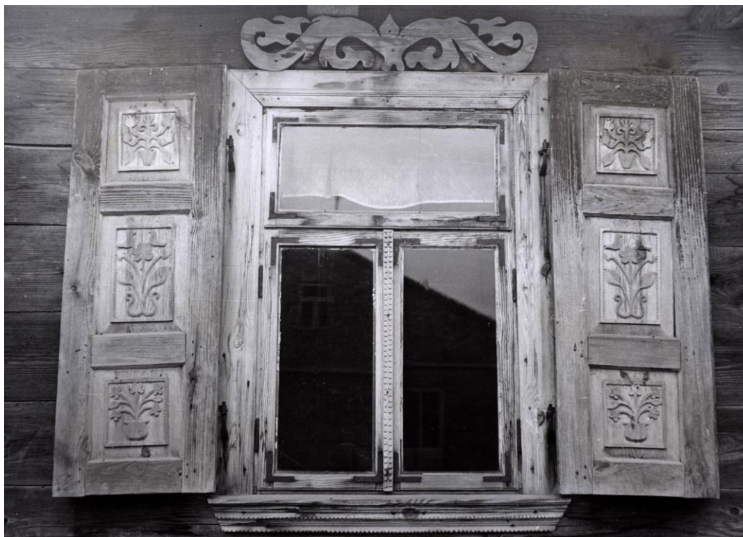
Okno, Makarówka pow. Łosice, fot. J. Urbanowicz, 1962.