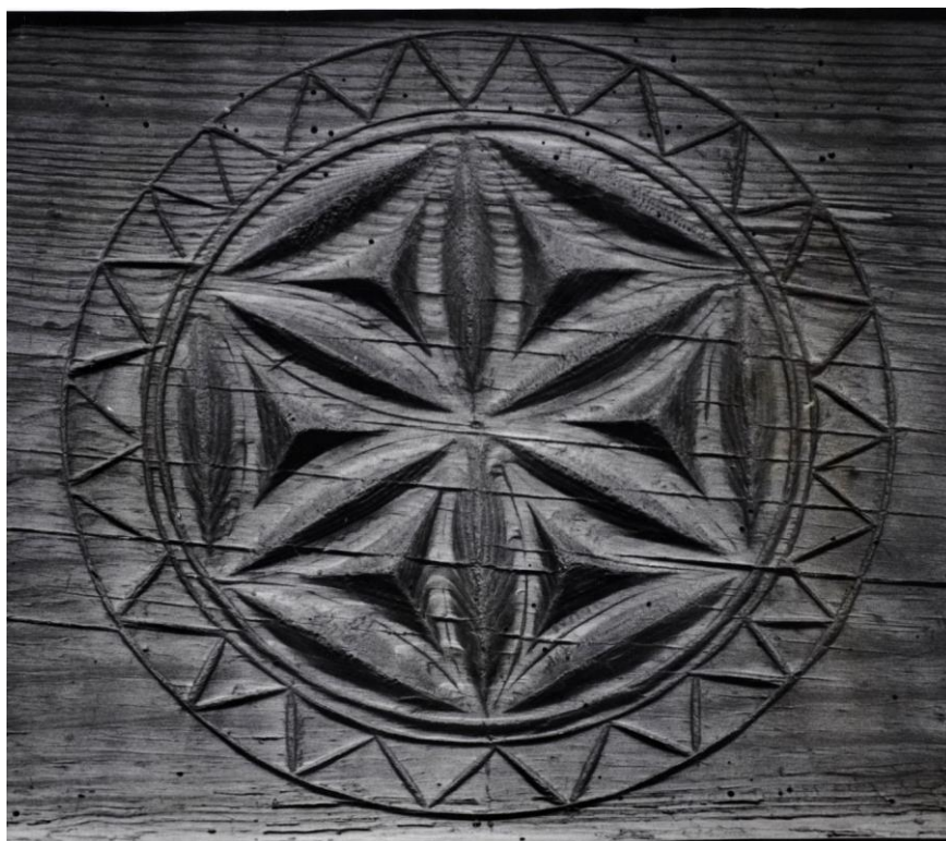
Zdobienie siestrzanu (rozeta), Korytków Duży pow. Biłgoraj, 1968.

tel./fax: +48 815330818 www.warsztatykultury.pl