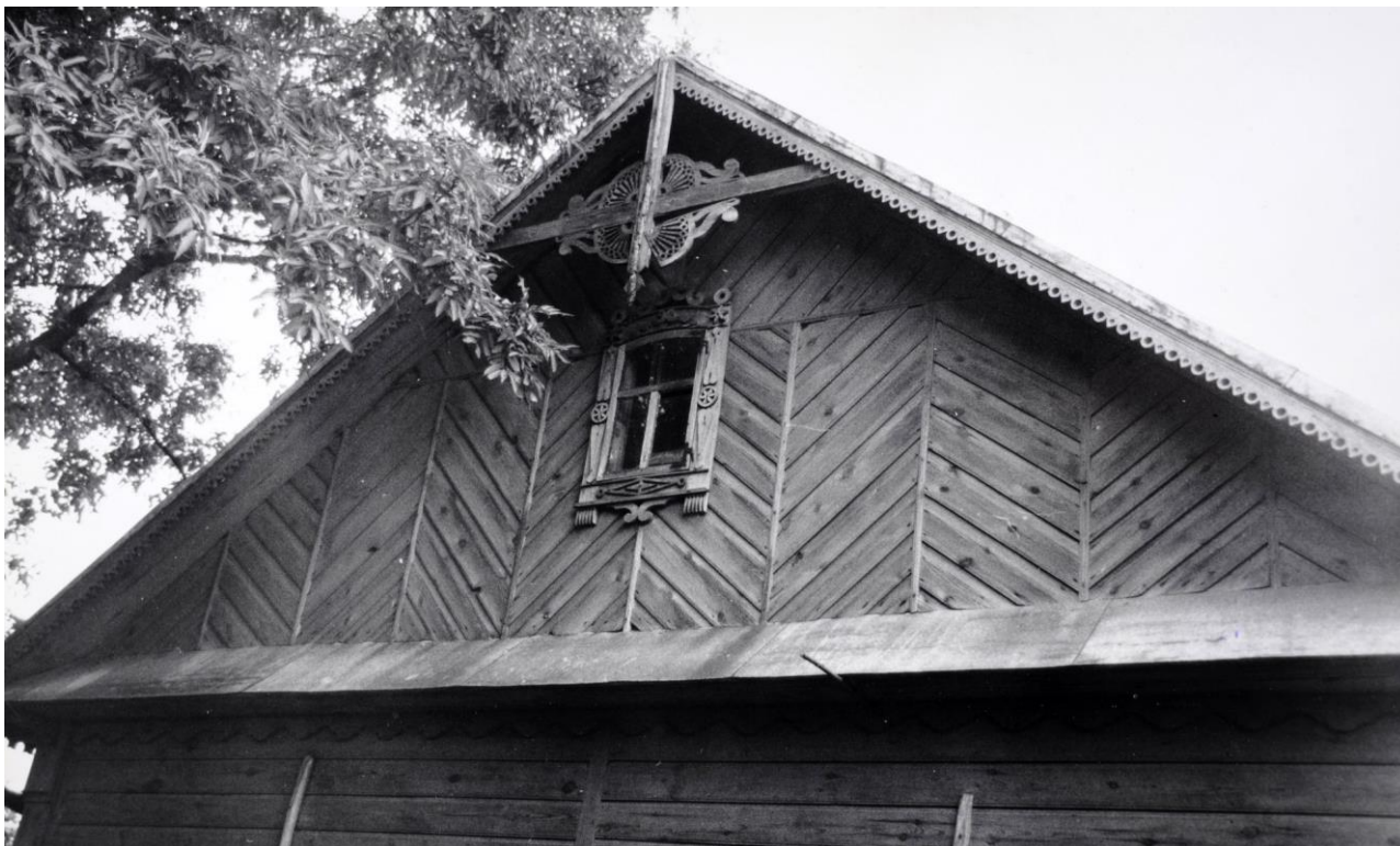
Szczyt dachu, Cyców pow. Łęczna., fot. J. Urbanowicz, 1975.

W niektórych częściach Podlasia, na Powiślu i terenie ziemi łukowskiej na uwagę zasługuje niezwykle bogate ludowe zdobnictwo architektoniczne, którego początki przypadły pod koniec XIX w. Prawdopodobnie zwyczaj ozdabiania domów rytami snycerskimi przynieśli staroobrzędowcy z Rosji, którzy docierali do Polski jako wędrowni rzemieślnicy, a rozpowszechnili go w latach międzywojennych małomiasteczkowi stolarze narodowości żydowskiej. Rzeźbione elementy architektoniczne, którym bardzo często towarzyszyły także kowalskie zdobienia, obejmowały różnorodne formy nad- i podokienników, okiennic i drzwi, szalunki i wykończenia profilowanymi listwami szczytów dachów, szalunki węglów.