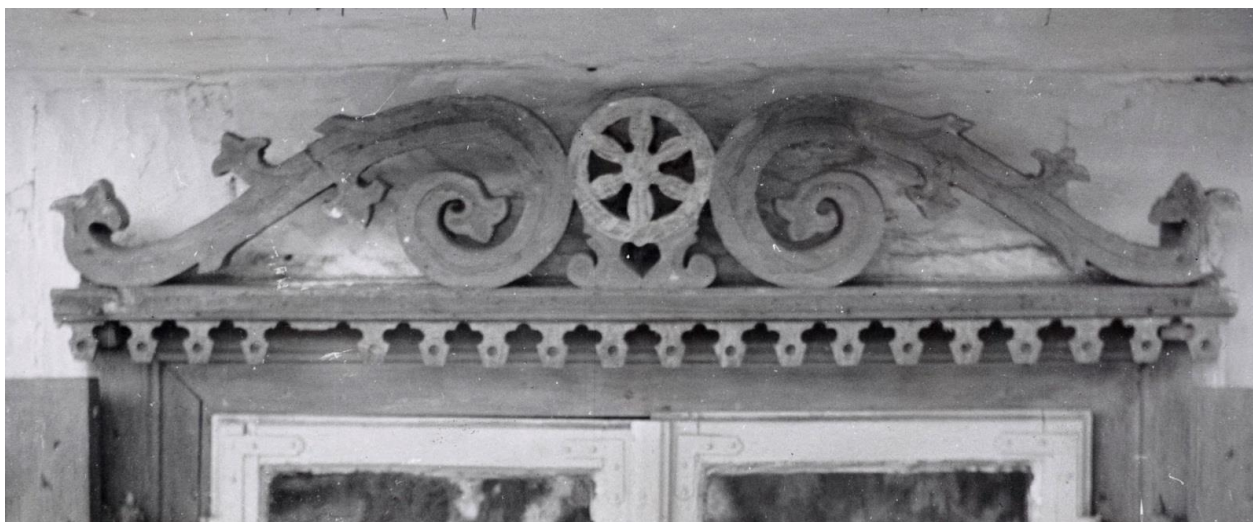
Nadokiennik, Wojcieszków pow. Łuków, 1960.