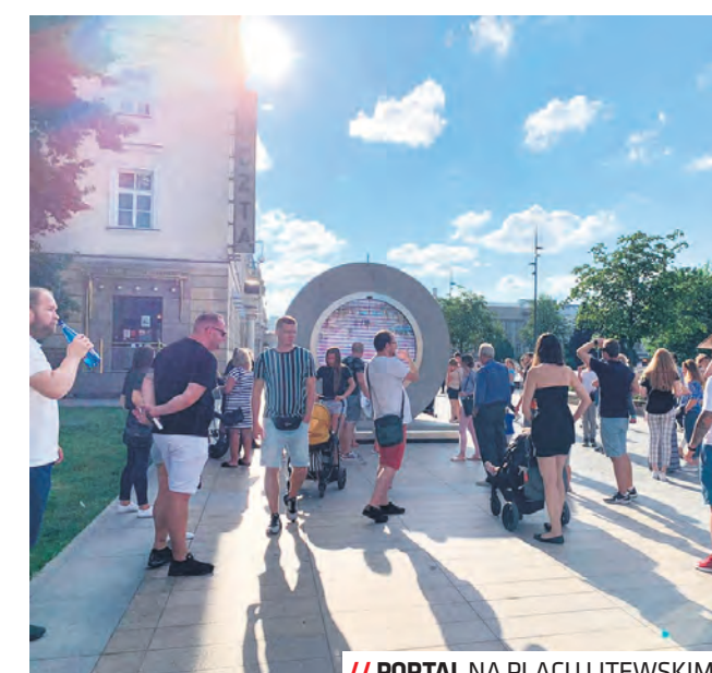
// PORTAL NA PLACU LITIEWSKIM

Wszelkie informacje na temat inicjatywy oraz towarzyszących wydarzeń są zamieszczone na stronach: www.rozdroza.com, www.portalcities.org i www.lublin.eu