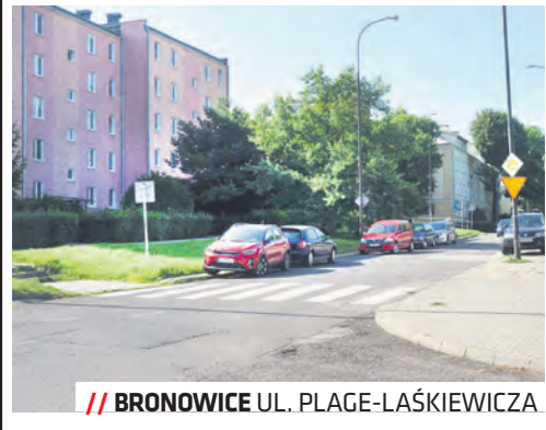
BRONOWICE UL. PLAGE-ŁASKIEWICZA

W tym roku pieniądze zostały przeznaczone na zadania drogowe na Bronowicach – remont ul. Sokolej wraz z wykonaniem miejsc parkingowych, oraz chodnika przy ul. Plagego i Łaskiewicza, na odcinku od skrzyżowania z ul. Pogodną i Lotniczą do wysokości ul. Majdan Tatarski.