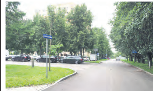
CZECHÓW PÓŁNOCNY UL. POTURZYŃSKIEJ

Na Czechowie Północnym radni zdecydowali przekazać pieniądze na oświetlenie skrzyżowania ul. Żelazowej Woli z ul. Poturzyńską oraz nowe miejsca parkingowe w pasie drogowym ul. Hamasie. Na ul. Szpinałskiego w pobliżu SP nr 43 powstały już cztery miejsca postojowe dla samochodów osobowych. Fundusze przeznaczono także na organizację biegu „Czechowska Piątka” wraz z biegami dziecięcymi, spektakl teatralny, a także dzielnicowy festyn rodzinny.