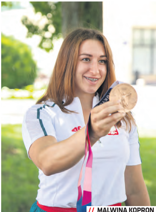
// MALWINA KOPRON