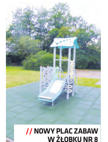
NOWY PLAC ZABAW W ŻŁOBKU NR 8 PRZY UL. NAŁKOWSKICH, DZIELNICA WROTKÓW

Tylko środki z rezerwy celowej i przypisanej dzielnicom pułi w Budżecie Obywatelskim dają każdej dzielnicy co roku gwarantowane pół miliona złotych na zadania w bezpośrednim otoczeniu mieszkańców. Od początku tej kadencji prezydent Krzysztofa Żuka, jedynie w ramach narzędzi partycypacyjnych, do lubelskich dzielnic trafiło niemal 80 mln zł. Warto przypomnieć, że Rady Dzielnic mają także możliwość zgłaszania wniosków do budżetu miasta, a w samym budżecie zapisywane są środki na zadania realizowane lokalnie. To kolejne dziesiątki milionów złotych dla lubelskich dzielnic. Rady Dzielnic, zgodnie ze swoimi statutami, opiniują istotne dla reprezentowanych dzielnic projekty oraz zgłaszają wnioski do budżetu miasta. Wspólnie z mieszkańcami przygotowują również projekty do budżetu obywatelskiego, zielonego budżetu i inicjatywy lokalnej. W bieżącym roku uczestniczą również w pracach nad Strategią Lublin 2030. W czerwcu 2021 roku, w gronie Konwentu Przewodniczących Rad i Zarządów Dzielnic Miasta Lublin, odbyło się spotkanie poświęcone rekomendacjom do przygotowywanej strategii. Wykorzystując głosy pojawiające się w pracach nad strategią, Urząd Miasta przygotowuje się właśnie do rozpoczęcia prac nad planami dla dzielnic, które określą wypracowane wspólnie z mieszkańcami kluczowe potrzeby rozwojowe dzielnic w przyszłości. Kontakt do swojej Rady Dzielnicy i informacje na temat jej działalności znajdziesz na stronie lublin.eu/rady-dzielnic