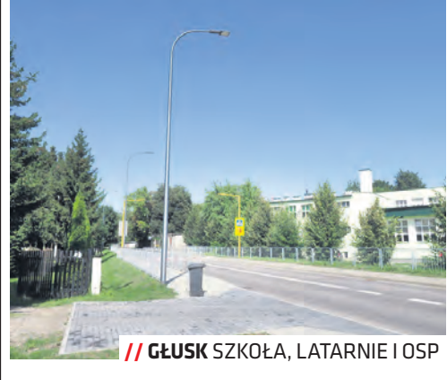
GŁUSK SZKOŁA, LATARNIE I OSP

W Głusku zdecydowano o zainwestowaniu w latarnie uliczne przy ul. Zdrowej oraz poprawienie widoczności wyjazdu z ul. Głuskiej przez montaż lustra. Rada przekazała środki na warsztaty artystyczne, dwa koncerty chóru, zajęcia dla dzieci w MBP, a także OSP Głusk w zakresie umundurowania i remontu strażynicy. W przygotowaniu jest budowa chodnika przy ul. Wygodnej po stronie szkoły. Część środków rezerwy celowej trafiła na wsparcie Przedszkola nr 83 oraz SP nr 47 (lekcje gry w szachy, zakup monitora interaktywnego dla zerówki, wykonanie podłogi, dojścia i chodnika do altany). W parku u zbiegu ulic Głuskiej i Wygodnej na okres letni została ustawiona przenośna toaleta.