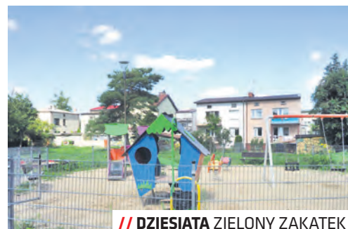
DZIESIĄTA ZIELONY ZAKĄTEK PRZY UL. SIEMIRADZKIEGO

Pieniądze z rezerwy na Dziesiątej trafiły na modernizację ogrodu Przedszkola nr 3, dokończenie remontu ogrodzenia boiska przy ul. Siemiradzkiego oraz zakupienie wyposażenia (rośliny i akcesoria) dla pracowni florystycznej SOSW przy ul. Wyciągowej. Dofinansowanie otrzymały również działania i letnie wydarzenia edukacyjno-kulturalno-integracyjne dedykowane dla mieszkańców tej dzielnicy przez DDK „Bronowice”. Rada przeznaczyła też środki na remonty chodników wzdłuż ulic Kochanowskiego i Leśnej, a także na ustawienie w letnich miesiącach przenośnej toalety w pobliżu „Zielonego Zakątek” przy ul. Siemiradzkiego.