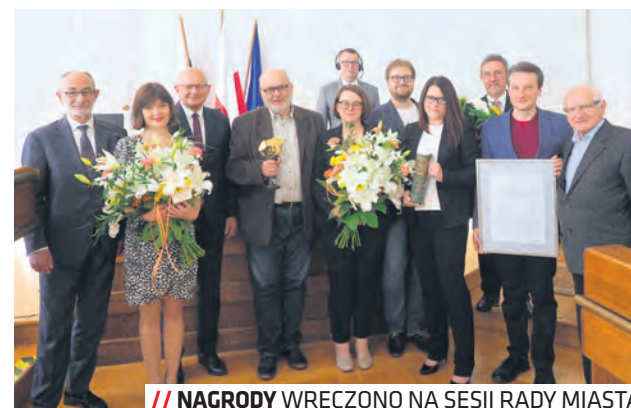
// NAGRODY WRĘCZONO NA SESJI RADY MIASTA

Nagrody Miasta Lublin w dziedzinie kultury za 2020 rok dla Mecenasas Kultury otrzymał PKO Bank Polski Spółka Akcyjna z siedzibą w Warszawie, Regionalny Oddział Detaliczny w Lublinie za znaczący wpływ na jakość oferty kulturalnej Lublina, w szczególności za finansowe wsparcie działalności Teatru Starego w Lublinie oraz wielu innych działań włączających mieszkańców naszego miasta do aktywnego uczestnictwa w kulturze.