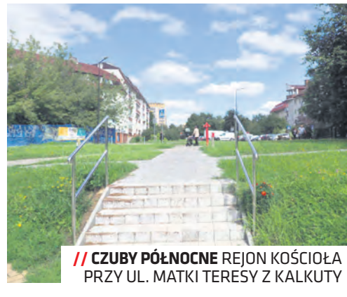
CZUBY PÓŁNOCNE REJON KOŚCIOŁA PRZY UL. MATKI TERESY Z KALKUTY

Czuby Północne rozdysponowały fundusze przede wszystkim na doposażenie dwóch siłowni zewnętrznych oraz na nawierzchnię bezpieczną pod siłownią przy ul. Herbowej, a także wykonanie chodników ze schodami terenowymi w rejonie kościoła pw. Świętej Rodziny i ul. Matki Teresy z Kalkuty.