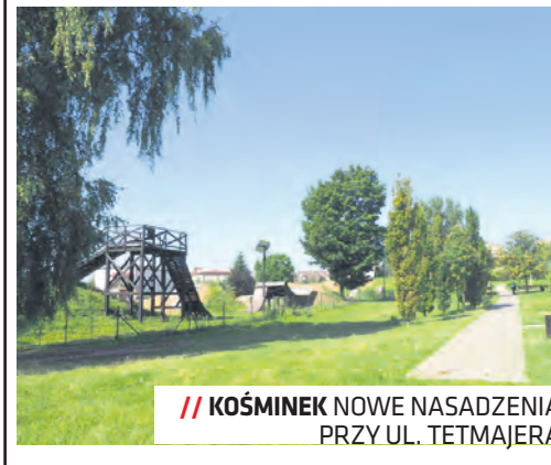
KOŚMINEK NOWE NASADZENIA PRZY UL. TETMAJERA

Na Kośminie zmiany obejmą chodniki (remont ciągu pieszego ul. Kosmonautów od ul. Kossaka do ul. Tetmajera jest w trakcie opracowywania), oświetlenie (powstanie nowa latarnia przy kładce na ul. Garbarskiej), infrastrukturę (piłkochwył na boisku przy ul. Wspólnej) oraz nowe nasadzenia zieleni na placu przy ulicach Sulisławickiej i Tetmajera.