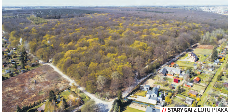
// STARY GAJ Z LOTU PTAKA

Z kolei plan dla rejonu ul. Kazimierza Wielkiego zapewni ochronę terenów zielonych zlokalizowanych w pobliżu dużego osiedla, stanowiących zaplecze