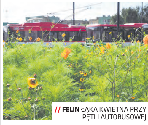
FELIN ŁĄKA KWIETNA PRZY PĘTLI AUTOBUSOWEJ

Ze środków dzielnicy Felin została m.in. wysiana łąka kwietna przy ul. Doświadczalnej przy pięci trolejbusowej oraz powstały chodniki przy ul. Zygmunta Augusta. Rejon tej ulicy (pętla, okolice) oraz ul. Jagiełły (skwer i ulica) zostaną również objęte monitoringiem. Kolejnym działaniem w tej dzielnicy ma być budowa chodników i oświetlenia w planowanym parku Felin, co zostanie wykonane po uzyskaniu pozwolenia na budowę i wyłonieniu wykonawcy. Zostaną także sfinansowane nasadzenia oraz przybędzie koszy na odpady.