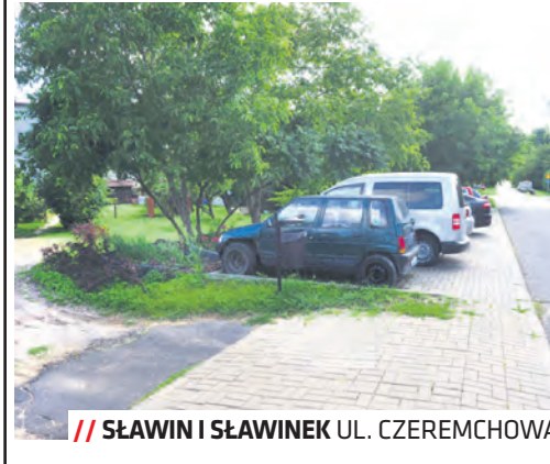
SŁAWIN I SŁAWINEK UL. CZEREMCHOWA

Rady dzielnic Sławin i Sławinek rozdysponowały wszystkie środki wyłącznie na drogi i chodniki. Na Sławinie pieniądze trafiły na remont części ul. Lawendowej (od ul. Zbożowej w kierunku ul. Kwiatów Polnych), na Sławinku z kolei remonty fragmentów chodników przy ulicach Batalionów Chłopskich, Harcerskiej, Dzieci Zamojszczyzny oraz fragment brakującego chodnika przy skwerze przy ul. Czeremchowej.