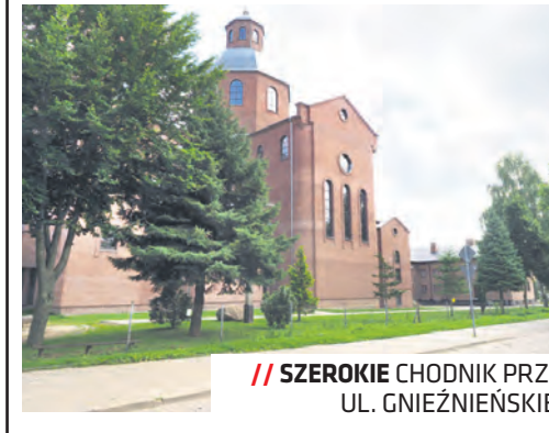
SZEROKIE CHODNIK PRZY UL. GNIEZNIENSKIEJ

W dzielnicy Szerokie ułożono destrukta asfaltowy na czterech odcinkach ulic: Wiślan, Zakątek, Biskupińskiej (od ul. Gnieźnieńskiej do ul. Łużyczan) oraz w części ul. Głównej (odcinek od ul. Nałęczowskiej do ul. Krystalicznej). Planuje się także poszerzenie chodnika o 0,6 m w ulicy Gnieźnieńskiej po stronie kościoła. Dla placu zabaw w rejonie ul. Wądogłej i Szerokie opracowano dokumentację projektową i prace związane z rekultywacją trawnika. Na plac zabaw trafił nowy zestaw workout oraz zakupione jeszcze w ubiegłym roku urządzenia zabawowe.