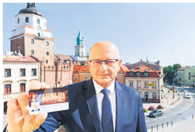
// PREZYDENT KRZYSZTOF ŻUK PREZENTUJE KARTĘ MIEJSKĄ

Od 1 października zostanie uruchomiony nowy system biletu elektronicznego Lubika. Zgodnie z decyzją radnych zmienią się także ceny biletów komunikacji miejskiej oraz granice stref biletowych.