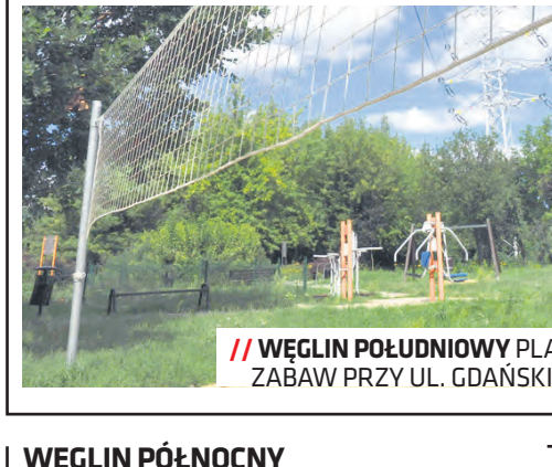
WĘGLIN POŁUDNIOWY PLAC ZABAW PRZY UL. GDAŃSKIEJ

Węglin Południowy przeznaczył środki przede wszystkim na nowe nasadzenia roślinne w tej dzielnicy oraz ochronę starodrzewu na osiedlu Świt. Ulepszono również destrukta asfaltowym nawierzchnię ul. Jaspisowej na odcinku łączącym z ul. Berylową. Trwa projektowanie doposażenia placu zabaw przy ul. Gdańskiej oraz przekazano środki ZS nr 13 na organizację dzielnicowego festynu. Przebrukowano również nawierzchnię ul. Gdańskiej na skrzyżowaniu z ul. Podhalańską oraz przebudowano chodnik na skrzyżowaniu ulic Podhalańskiej z Radomską.