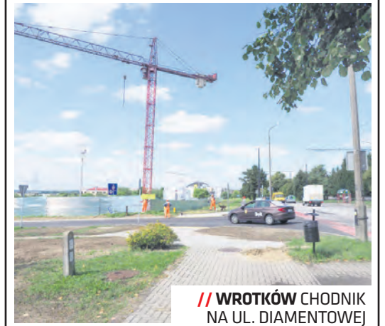
WROTKÓW CHODNIK NA UL. DIAMENTOWEJ

Połowę swojej rezerwy celowej Wrotków przeznaczył na budowę nowego chodnika w miejscu istniejącego wydeptu między ul. Samsonowicza a ul. Diamentową w pobliżu ul. Domeyki – obecnie trwają prace projektowe w tym zakresie. Pozostałą część środków przeznaczono na plac zabaw dla Żłobka nr 8 przy ul. Nałkowskich, który jest już gotowy, oraz na zakup laptopów dla SP nr 30 i pomocy dydaktycznych dla oddziałów przedszkolnych tej szkoły.