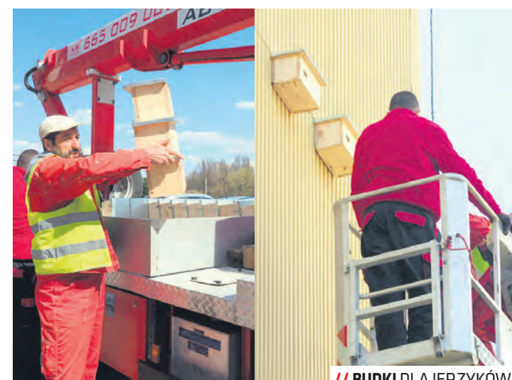
// BUDKI DLA JERYŻKÓW

– Komarami miasto walczy w tym roku m.in. na Błoniach przy Zamku, w Ogrodzie Saskim, okolicach Stadionu Arena Lublin oraz w parkach: Botanik, Bronowice, Czechów, Jana Pawła II, Kalinowszczyzna, Ludowy, Rury, Rusałka, Zawilcowa. Zabieg zrealizowano w ramach projektu z VII Budżetu Obywatelskiego. Coś komara, czyli wygnany krwiopijowca z naszego miasta!.