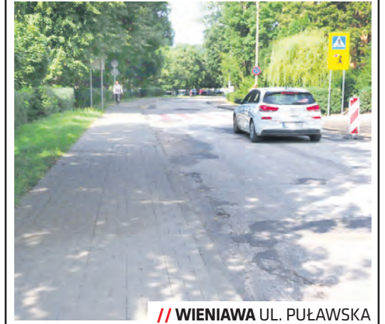
WIENIAWA UL. PUŁAWSKA

Ze środków dzielnicy Wieniawa zostały doposażone trzy przedszkola w dzielnicy – przy ul. Weteranów, Zuchów i Spokojnej, m.in. w sprzęt multimedialny, a także XXIII LO w sprzęt komputerowy. Zgodnie z decyzją Rady Dzielnicy ZNK wykonał remont miejskiej posesji zlokalizowanej przy budynku wspólnoty mieszkaniowej przy Alejach Racławickich. W przygotowaniu jest także doposażenie placu zabaw przy ul. Popiełuszki w tyrolkę, a także wymiana nawierzchni fragmentów chodników w pasie drogowym ul. Legionowej. Wymieniono także nawierzchnię chodnika na kostkę brukową przy ul. Puławskiej. W tej dzielnicy zostanie również zorganizowany festyn integracyjny „Wieniawa łączy pokolenia”.