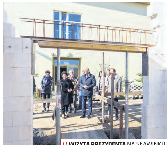
// WIZYTA PREZYDENTA NA SŁAWINKU

W ramach inwestycji powstaje 12-oddziałowy obiekt o trzech kondygnacjach nadziemnych i jednej podziemnej, o kubaturze prawie 9 tys. m sześc., z łazienkami z głównym budynkiem szkoły. Powierzchnia wszystkich pomieszczeń wyniesie prawie 3 tys. mkw. Na poziomie -1 zaprojektowa-