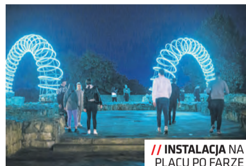
// INSTALACJA NA PLACU PO FARZE