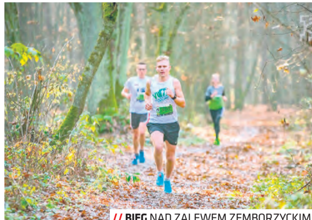
// BIEG NAD ZALEWEM ZEMBORZYCKIM

Trasa, na której rywalizują biegacze w Lublinie, to 5 kilometrów w pięknej, leśnej scenarii. Kolejne biegi CITY TRAIL 2021/2022 odbędą w Lublinie: 11 grudnia, 8 stycznia, 5 lutego, 5 marca. Sezon zakończy się uroczystym podsumowa-