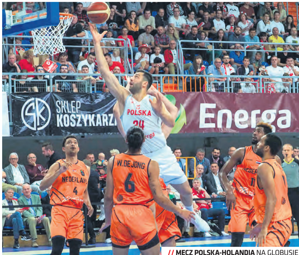
// MECZ POLSKA-HOLANDIA NA GLOBUSIE

– Bardzo cieszymy się, że reprezentacja Polski po ponad dwóch latach przerwy ponownie zawita do Lublina. To świetne miejsce dla koszykówki, z wysokiej klasy obiektami sportowymi oraz zaangażowa-