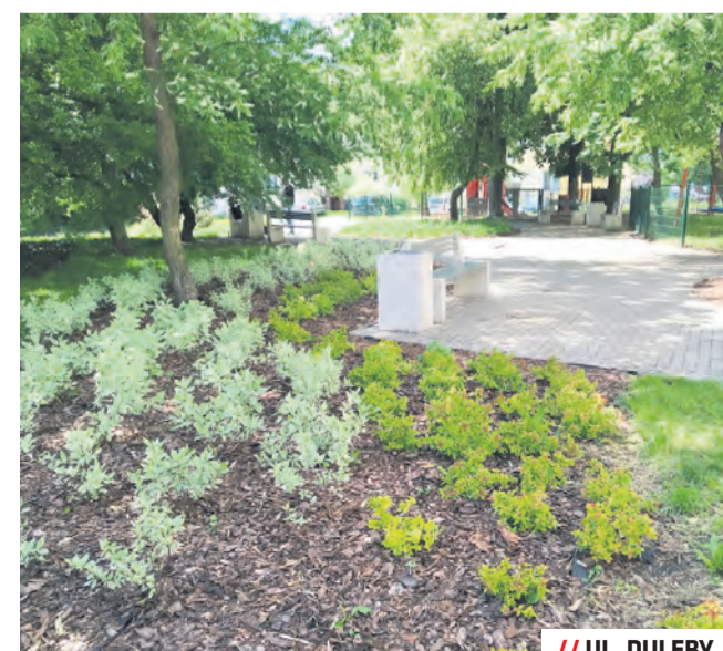
// UL. DULĘBY