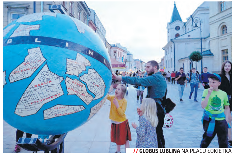
// GLOBUS LUBLINA NA PLACU ŁOKIETKA

Liczba podróży w kolejnych miesiącach systematycznie rosła – z nieco ponad 44 tys. w czerwcu do prawie 74,5 tys. osób we wrześniu, by w drugiej połowie sezonu turystycznego