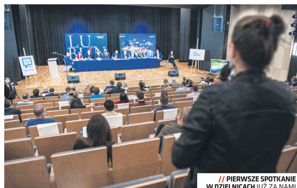
/// PIERWSZE SPOTKANIE W DZIELNICACH JUŻ ZA NAM!

Effektem szeregu spotkań będzie „Plan dla Dzielnic”, czyli opis priorytetów rozwojowych w konkretnej dzielnicy w perspektywie najbliższych lat. Następnym etapem jest odzwierciedlenie w decyzjach dotyczących kształtu budżetu miasta, w wieloletniej prognozie finansowej oraz podczas starań o dofinansowanie projektów ze środków unijnych. Pozwoli to na