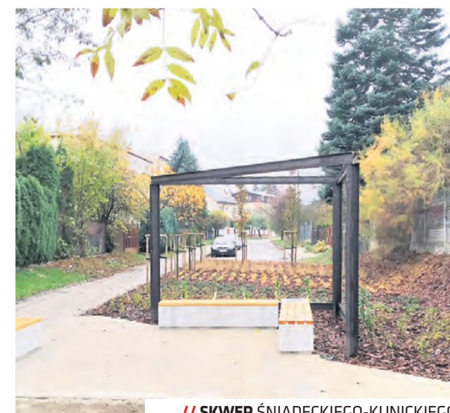
// SKWER ŚNIADECKIEGO-KUNICKIEGO