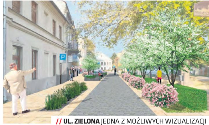
/// UL. ZIELONA JEDNA Z MOŻLIWYCH WIZUALIZACJI

– To nasza odpowiedź na prośby mieszkańców, rad dzielnic oraz przedsiębiorców prowadzących na tym obszarze działalność gospodar-