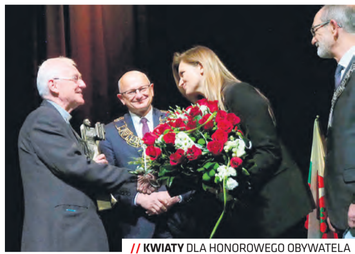
/// KWIATY DLA HONOROWEGO OBYWATELA