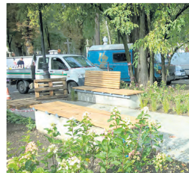
// UL. LIPOWA OKOLICE CMENTARZA