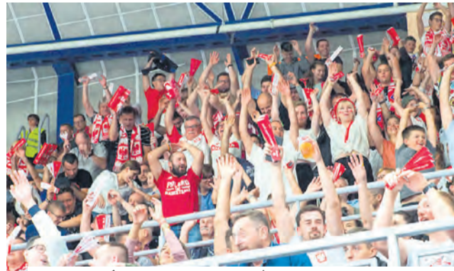
// KOSZYKÓWKA CIESZY SIĘ DUŻYM ZAINTERESOWANIEM