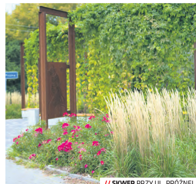
// SKWER PRZY UL. PRÓŻNEJ

Szczegółowych informacji na temat zasad w edycji Zielonego Budżetu udziela Biuro Miejskiego Architekta Zieleni (tel. 81 466 26 86, maz@lublin.eu) oraz Biuro Partycypacji Społecznej (zielony@lublin.eu).