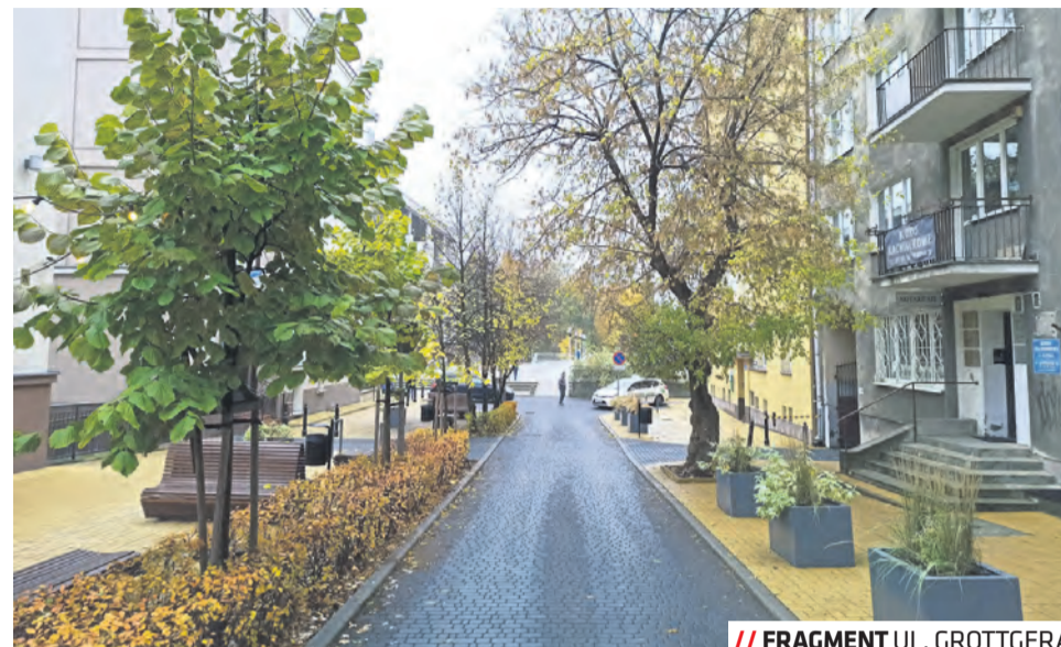
// FRAGMENT UL. GROTTGERA

Edycje tematyczne to nie jedyna zmiana w formule Zielonego Budżetu. W trakcie naboru mieszkańcy nie muszą już składać gotowych projektów, wystarczy, że wskażą działkę miejską, maksymalnie