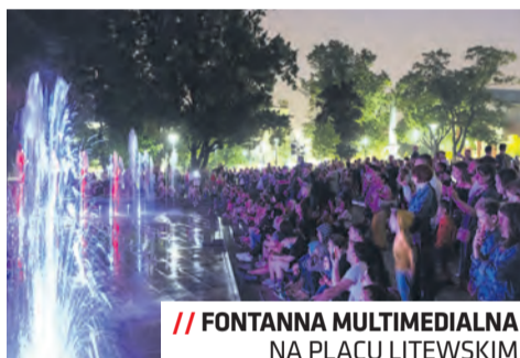
// FONTANNA MULTIMEDIALNA NA PLACU LITEWSKIM

osiągnąć wartość sprzed pandemii. Sezon wakacyjny w 2021 roku upłynął przede wszystkim pod znakiem turystyki krajowej. Najchętniej odwiedzano