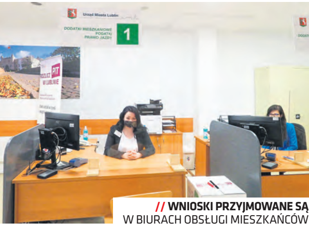
WNIOSKI PRZYJMOWANE SĄ W BIURACH OBSŁUGI MIESZKAŃCÓW

– W przypadku gdy w gospodarstwie wieloosobowym wniosek o dodatek ostonowy złożony więcej niż jedna