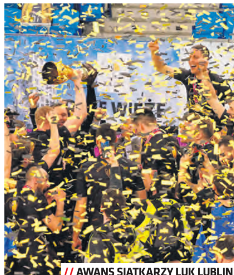
// AWANS SIATKARZY LUK LUBLIN

strzów, zostając najlepszym klubem w Europie. Siatkarska Plus Liga to elita i do niej z przymusem wroczyli siatkarze LUK Lublin, którzy wywalczyli awans i powrót Lublina i Lubelszczyzny do siatkarskiej Ekstraklasy, przyciągając automatycznie duże zainteresowanie lubelskich kibiców. Dość powiedzieć, że klub LUK Lublin przeniósł się z hali im. Z. Niedzieli przy Alejach Zygmuntońskich do hali Globus, gdzie na mecze plusligowej drużyny przychodzi regularnie ok. 3 tysiące kibiców.