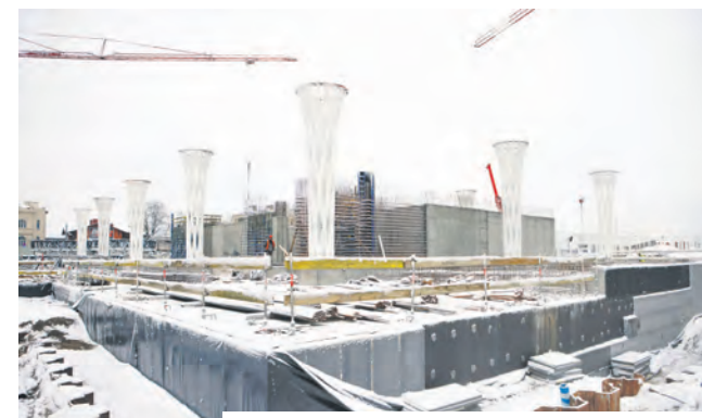
// BUDOWA DWORCA METROPOLITALNEGO