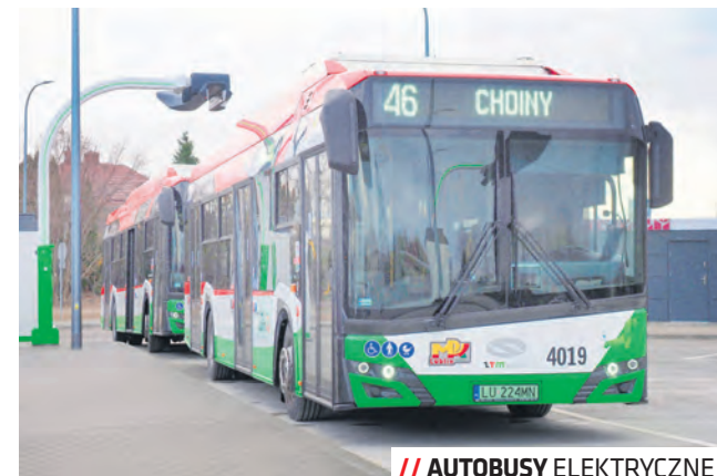
// AUTOBUSY ELEKTRYCZNE

W ramach przyszlórocznego budżetu zaplanowano środki na inwestycje oświatowe: dobudowę segmentu przedszkola przy ZS nr 12 przy ul. Stawinkowskiej oraz dobudowę segmentu żywieniaowego i dydaktycznego w SP nr 52 na Felinie, kontynuację budowy sali gimnastycznej i boiska