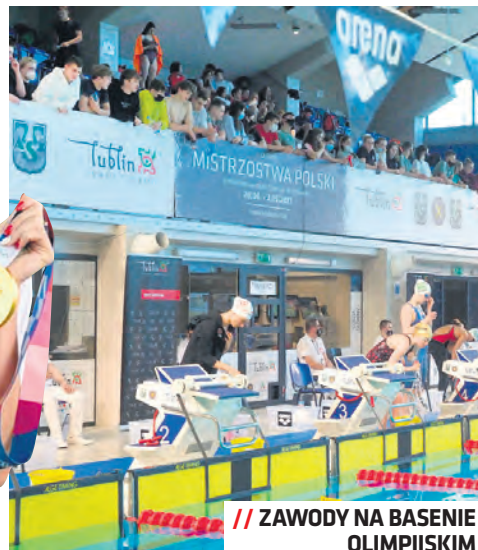
// ZAWODY NA BASENIE OLIMPIJSKIM