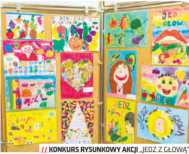
KONKURS RYSUNKOWY AKCJI „JEDZ Z GŁOWĄ”

W ramach programu przeprowadzono wśród najmłodszych badania przesiewowe określające wskaźnik BMI, ciśnienie tętnicze krwi oraz wydolność fizyczną. W badaniach