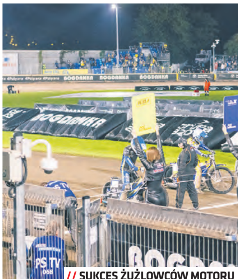
// SUKCES ŻUŻLOWCÓW MOTORU