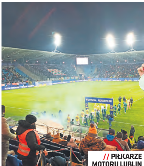
// PIĘKARZE MOTORU LUBLIN

Siatkówka jest jednym z najpopularniejszych sportów w Polsce, a męska reprezentacja kraju należy do światowej czołówki. Polskie kluby świetnie sobie radzą w europejskich pucharach. Na początku maja ZAKSA Kędzierzyn-Koźle wygrała siatkarską Ligę Mi-