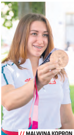
// MALWINA KOPRON