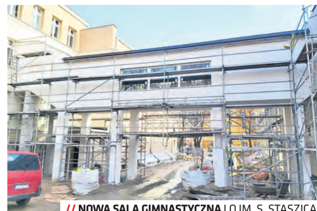
// NOWA SALA GIMNASTYCZNA LO IM. S. STASZICA