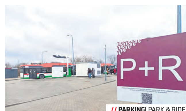
// PARKINGI PARK & RIDE

przy I Liceum Ogólnokształcącym im. S. Staszica, a także przebudowę pomieszczeń w VII LO pod funkcję przedszkolną.