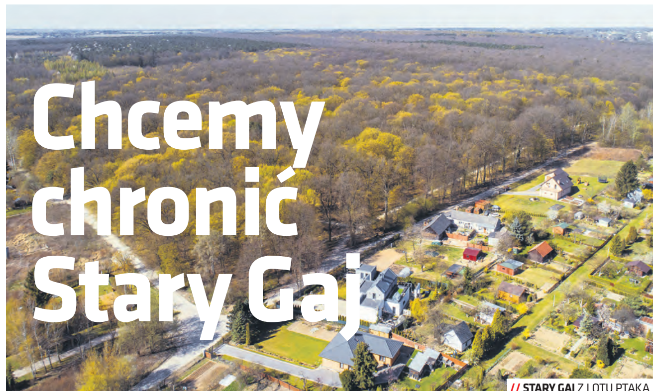
// STARY GAJ Z LOTU PTKA

Miasto chce stworzyć zespół przyrodniczo-krajobrazowy w części lasu Stary Gaj. Obszar ten cechuje znaczna bioróżnorodność siedliskowa i zamieszkuje go chronione gatunki flory i fauny.