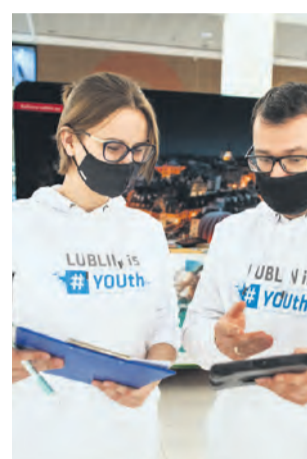
// MŁODZI ANKIETERZY

Młodzi ludzie uważają, że Lublin daje młodzieży sporo możliwości, zwłaszcza edukacyjnych czy kulturalnych. Niemal każda osoba może znaleźć coś dla siebie. Dzięki licznym festiwalom można poszukiwać też nowych zainteresowań,