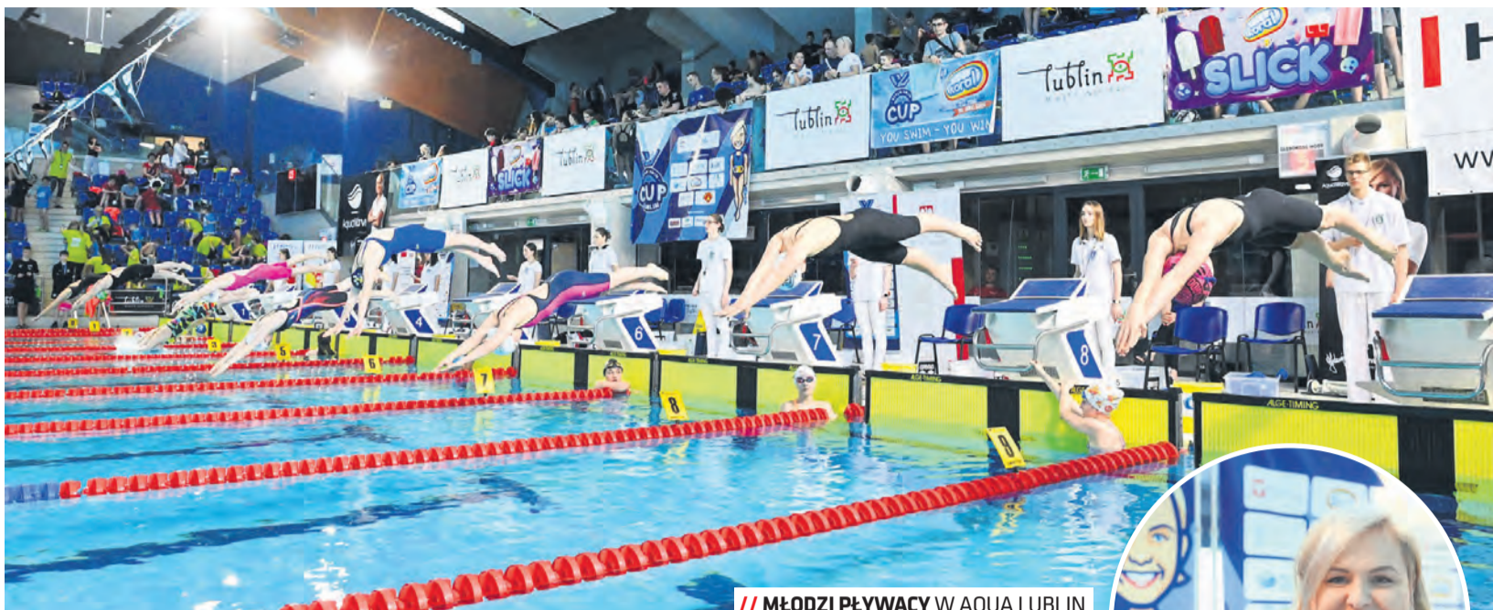
// MŁODZI PŁYWCY W AQUA LUBLIN