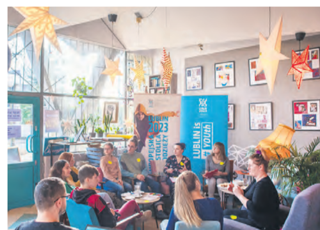
// DYSKUSJA O ESM 2023 R.

Najczęściej źródłem informacji o Lublinie dla młodych ludzi są social media, znajomi, rodzina, wyszukiwarki inter-