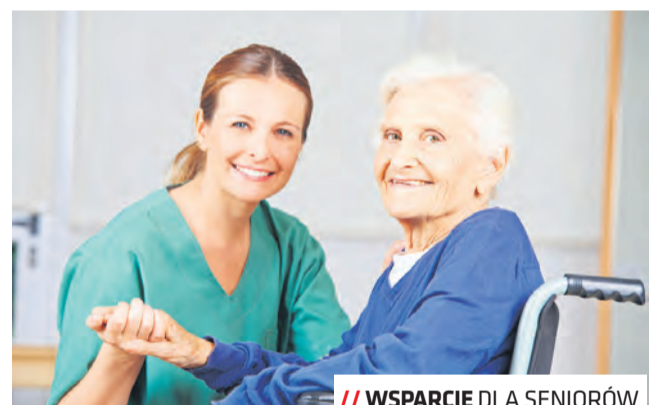
// WSPARCIE DLA SENIORÓW

W 2019 roku spółka Interbud wystąpiła do miasta w trybie tzw. ustawy lex developer o zgodę na zabudowę części działek przy ul. Relaksowej. Radni nie wyrazili na to zgody, wskazując na potrzebę ochrony tego terenu i zachowanie enklawy zieleni. Spółka zaproponowała więc zamianę działek. Ostatecznie otrzymała w zamian działki przy ulicach Józefa Franczaka „Lalka” i gen. Witolda Urbanowicza w Lublinie.