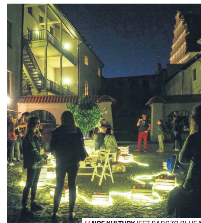
// NOC KULTURY JEST BARDZO DŁUGA

ZAPRASZAMY WSZYSTKICH MIESZKAŃCÓW, TURYSTÓW ORAZ PRZYJACIÓŁ LUBLINA DO WSPÓLNEGO ODKRYWANIA NA NOWO NASZEGO MIASTA