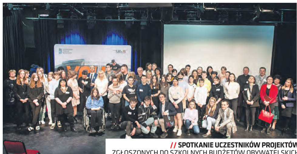
// SPOTKANIE UCZESTNIKÓW PROJEKTÓW ZGŁOSZONYCH DO SZKOLNYCH BUDŻETÓW OBYWATELSKICH

Wybrane placówki otrzymają po 4 tys. zł na realizację projektów, a także wsparcie merytoryczne, organizacyjne i promocyjne. Udział w projekcie przyczyni się do rozwoju samorządności uczniowskiej, aktywizacji i integracji całej społeczności szkolnej. Placówki, przy pomocy Biura Partycypacji Społecznej, zostaną zaproszone jeszcze w tym semestrze na szkolenie i spotkanie integracyjne. Od września do końca grudnia 2022 roku