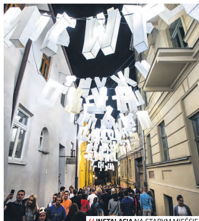
// INSTALACJA NA STARYM MIEŚCIE

radości są naszą szalupą ratunkową w tych trudnych czasach. W czasie trwania festiwalu odbędą się spacer po Lublinie z przewodnikiem w języku ukraińskim. – Zapraszamy wszystkich mieszkańców, turystów oraz przyjaciół Lublina do wspólnego odkrywania na nowo naszego miasta. To właśnie Lublina daje im poczucie realnego wsparcia ze strony Polaków. Codziennosc i małe