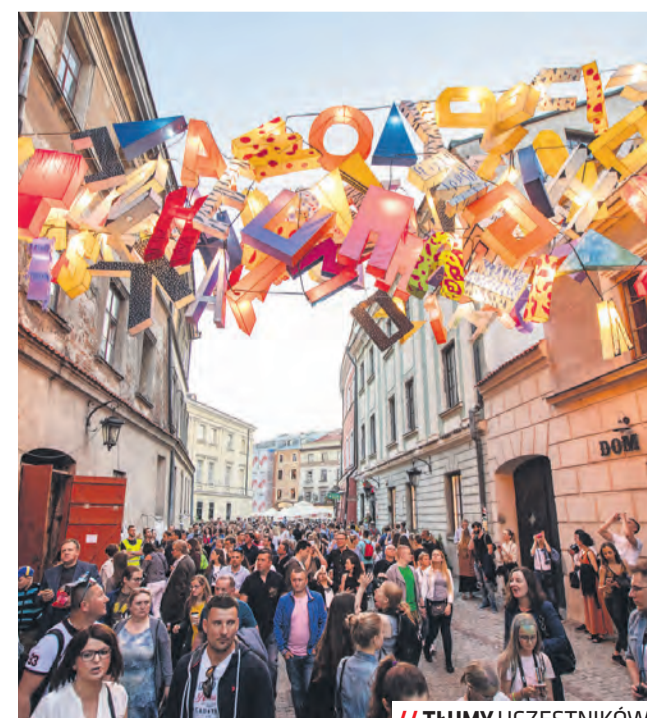
// TĘMY UCZESTNIKÓW