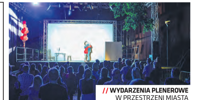
// WYDARZENIA PLENEROWE W PRZESTRZENI MIASTA

Autorzy: Fundacja Sztukmistrzów, Strefa Wysokich Lotów