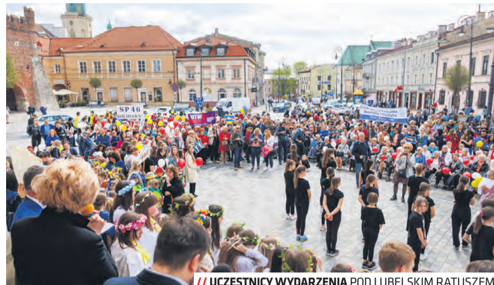
UCZESTNICY WYDARZENIA POD LUBELSKIM RATUSEM

Część artystyczna uświetnił m.in.: Chór Kasjopea ze