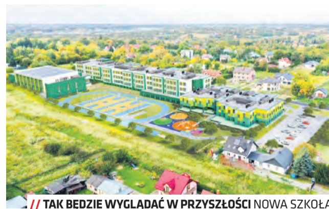
TAK BĘDZIE WYGLĄDAĆ W PRZYSZŁOŚCI NOWA SZKOŁA

Budynek ma mieć nowoczesną formę architektoniczną z przenikającymi się zlokalizowanymi w czterech stonowanych odcieniach zieleni, z wykorzystaniem nowoczesnych i naturalnych materiałów