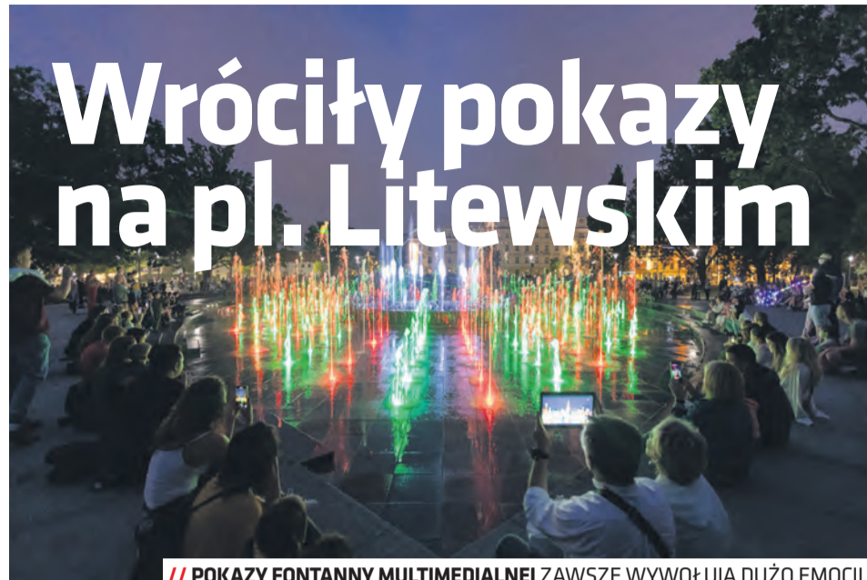
POKAZY FONTANNY MULTIMEDIALNEJ ZAWSZE WYWOŁUJĄ DUŻO EMOCJI

Informator miejski | WYDAWCA: Urząd Miasta Lublin, 20-109 Lublin, pl. Króla Władysława Łokietka 1 REDAKCJA: Kancelaria Prezydenta Miasta Lublin | email: informator@lublin.eu | tel. 81 466 19 16 NAKŁAD: 120 000 egzemplarzy | DRUK: Polska Press Grupa, Oddział Poligrafia, Drukarnia w Sosnowcu