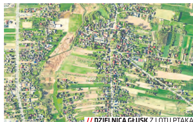
// DZIELNICA GŁUSK Z LOTU PTAKA

Wnioski mieszkańców składane do projektu planu w większości dotyczyły uporządkowania dróg komunikacyjnych i przekształcenia działek rolnych na budowlane. Projekt planu zmienia ich przeznaczenie i dopuszcza nową niską zabudowę w postaci domów jednorodzinnych oraz usług w różnych konfiguracjach. To maksymalnie dwukondygnacyjna zabudowa jednorodzinna z dopuszczalnym układem nowych dróg,