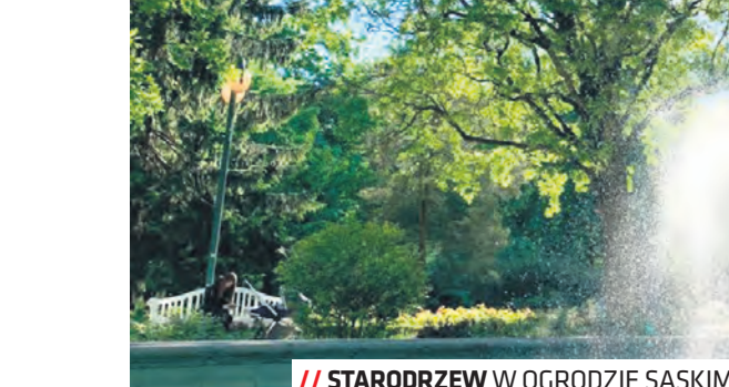
// STARODRZEW W OGRODZIE SASKIM

Obecny wygląd zespołowi klasztornemu nadał architekt Tadeusz Michalak i Kazimierz Kwiatkowski podczas remontu przeprowadzonego w latach 1970–1979.