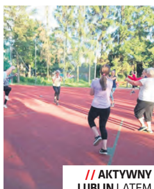
// AKTYWNY LUBLIN LATEM

Miejsce zajęć: boisko Orlik przy Szkole Podstawowej nr 3 w Lublinie, (w razie złej pogody zajęcia zostaną przeniesione na salę gimnastyczną).