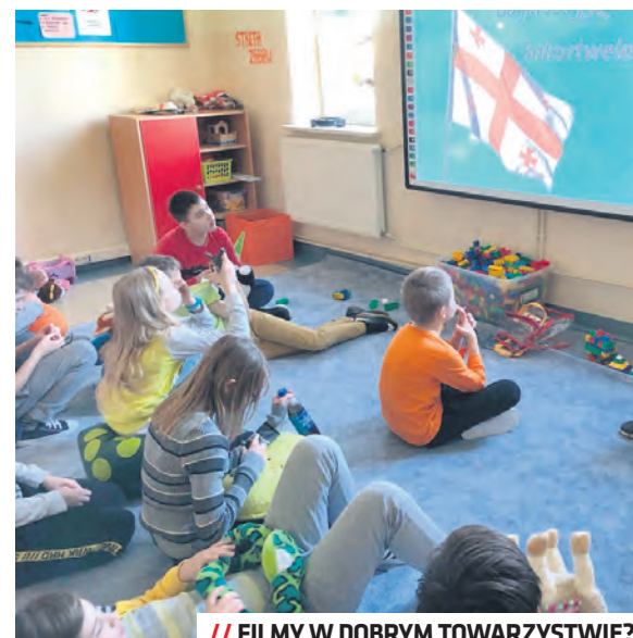
// FILMY W DOBRYM TOWARZYSTWIE?