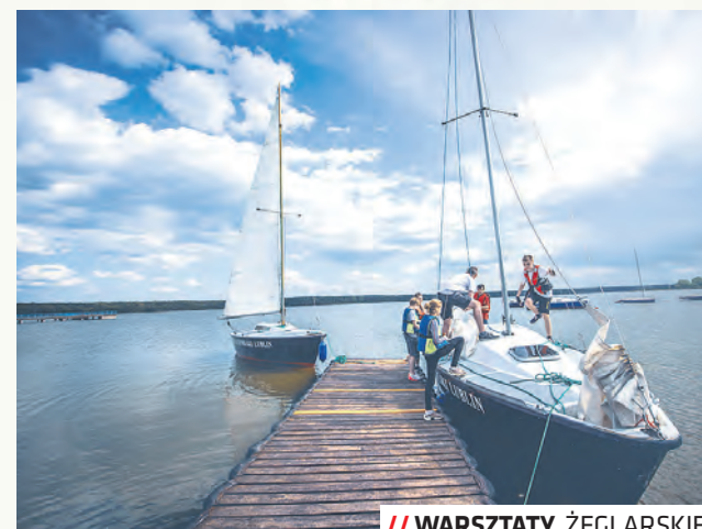
// WARSZTATY ŻEGLARSKIE

rów (listę można znaleźć na stronie www.sezon.lublin.eu ). Zbieraj naklejki według kategorii. Na jednym karnecie możesz zebrać łącznie 13 naklejek Kustosza (muzea, atrakcje turystyczne, instytucje kulturalne), 5 naklejek Kolekcjonera (pamiątki z Lublina, książki, płyty), 5 naklejek Atlety (kajaki, baseny, atrakcje turystyczne, marsz na orientację, pokoje zagadek), 5 naklejek Smakosza (kawiarnie i restauracje),