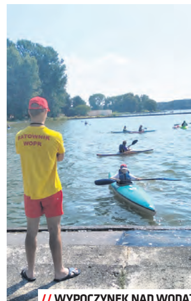
// WYPOCZYNEK NAD WODĄ?