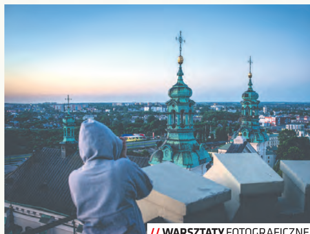
// WARSZTATY FOTOGRAFICZNE

Tegoroczna 11. edycja Sezonu Lublin potrwa do 31 października. Sezon Lublin 2022 to stała oferta 53 partnerów dostępną przez cały czas trwania akcji, podzielona na 6 kategorii. Obejmuje spacer z przewodnikiem, noclegi, gastronomiczne atrakcje turystyczne i muzea, sklepy z pamiątkami, a także miejsca sportu i rekreacji. W akcji mogą wziąć udział zarówno turystycy, jak i mieszkańcy, rodziny z dziećmi, seniorzy, młodzież i dzieci oraz każdy, kto ma ochotę na poznanie miasta przez dobrą zabawę!