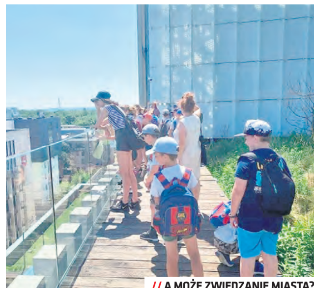
// A MOŻE ZWIEDZANIE MIASTA?