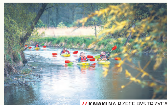
// KAJAKI NA RZECIE BYSTRZYCA

waju Turystyki Urzędu Miasta Lublin. Karnety do zbierania punktów wraz z pierwszą naklejką można odbierać u partnerów Sezonu Lublin 2022 oraz w Centrum Inspiracji Turystycznej