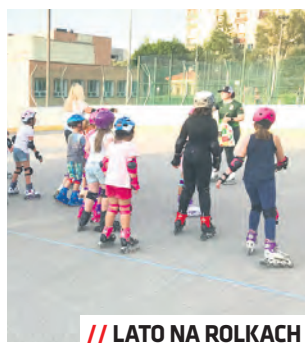
// LATO NA ROLKACH

tydzień przed zajęciami. Szczegóły na stronie www.aktywna-przyszlosc.pl