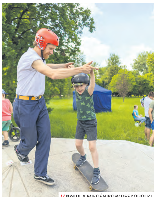
// RAJ DLA MIŁOŚNIKÓW DESKOROLKI

Każda niedziela: CPZ Letnia Akademia Ogrodnicza w Wirrydarzu | 12:00-14:00 | wstęp wolny