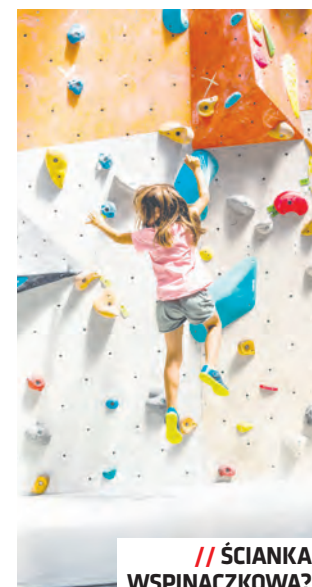
// ŚCIANKA WSPINACZKOWA?