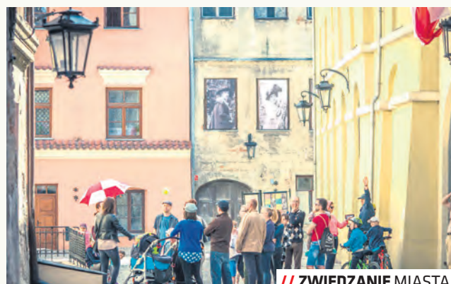
// ZWIEDZANIE MIASTA

– W tym roku wydłużamy czas trwania akcji i wprowadzamy nowe zasady uczestnictwa. Tegoroczna edycja łączy ze sobą aktywne poznanie Lublina z grą polegającą na zbieraniu punktów.