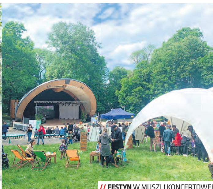
// FESTYN W MUSZLI KONCERTOWEJ