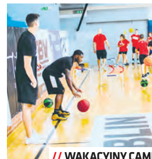
// WAKACYJNY CAMP

Projekty realizowane w ramach Budżetu Obywatelskiego to bezpłatne zajęcia sportowe i rekreacyjne dla seniorów, dorosłych, dzieci i młodzieży. Projekt obejmują ponad 50 godzin treningowych tygodniowo, a do wyboru jest 20 różnych dyscyplin sportowych. Zajęcia odbywają się w nowoczesnych obiektach sportowych, a prowadzą je wykwalifikowani instruktorzy. Zapisy na zajęcia odbywają się na bieżąco,