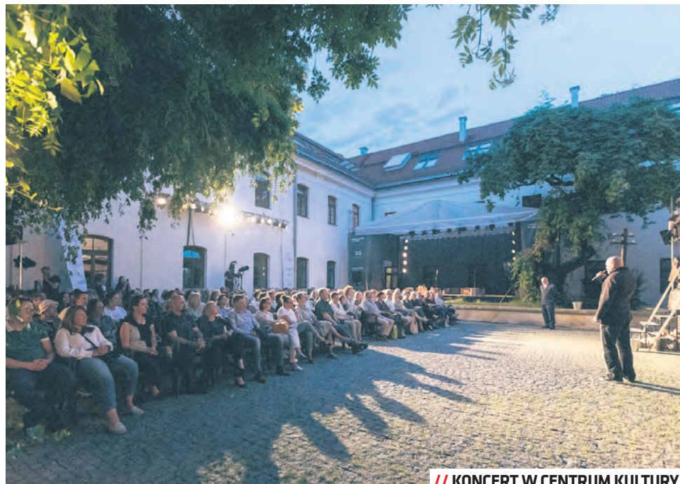
// KONCERT W CENTRUM KULTURY

Zanim oddamy się zabawie w wirrydarz CK, warto rozejrzeć się po zakamarkach obiektu. Dzieje budynku wiążą się z 1723 rokiem, kiedy wystawiono akt fundacyjny i zakupiono grunt pod budowę klasztoru Zgromadzenia Sióstr Nawiedzenia Najświętszej Marii Panny, zwanych w Polsce wizytkami. Zanim obiekt został największym miejskim