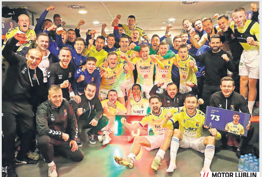
// MOTOR LUBLIN