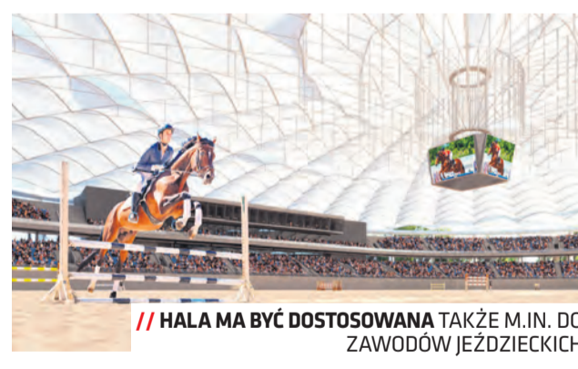
HALA MA BYĆ DOSTOSOWANA TAKŻE M.IN. DO ZAWODÓW JEŹDZIECKICH