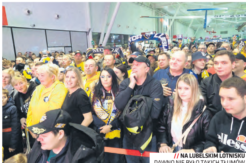
// NA LUBELSKIM LOTNISKU DAWNO NIE BYŁO TAKICH TŁUMÓW