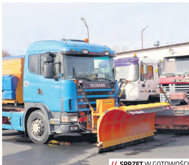
/// SPRZĘT W GOTOWOŚCI