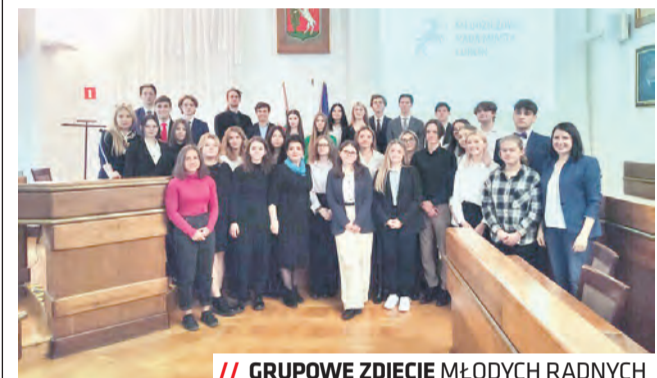
/// GRUPOWE ZDJĘCIE MŁODYCH RADNYCH