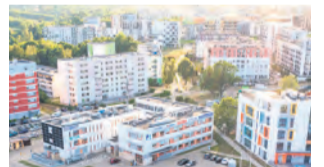
WĘZEŁ PRZEJAZDOWY GRANITOWY

Kluczowa jest realizacja projektów współfinansowanych z RPO, bo ich łączna wartość to 442 mln zł, z czego 261 mln zł stanowi dofinansowanie z Unii Europejskiej. Pierwszy z nich, budowa Dworca Metropolital-