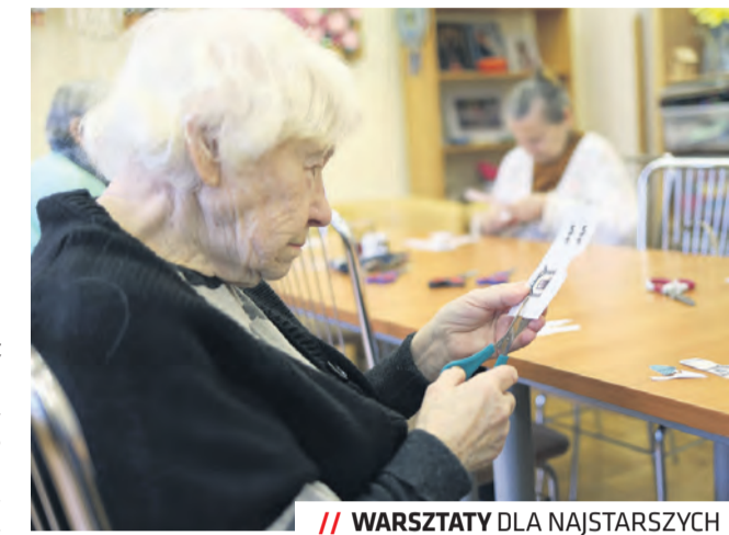
WARSZTATY DLA NAJSTARSZYCH

Od początku grudnia rozpocznie się działalność Środowiskowego Centrum Seniorów przy ul. Śliwińskiego 5 dla mieszkańców Lublina powyżej 60. roku życia. Na seniorów czekają m.in. atrakcyjne wycieczki, fizjoterapia czy zajęcia aktywizujące.