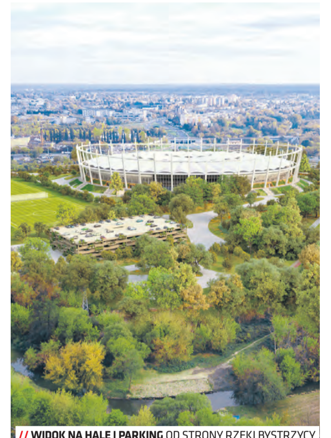
WIDOK NA HALĘ I PARKING OD STRONY RZEKI BYSTRZYCY