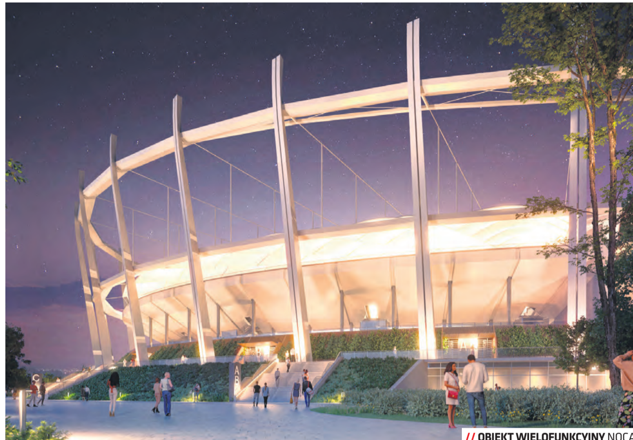
OBIEKT WIELOFUNKCYJNY NOCĄ

Projekt Wolontariat Lubelski ma na celu zebranie informacji o funkcjonujących w Lublinie grupach wolontariackich, opracowanie i wdrożenie miejskiej struktury wolontariatu oraz objęcie osób w nim uczestniczących szkoleniami i wsparciem. Pomoże w tym aplikacja, której zadaniem będzie łączenie wolontariuszy z podmiotami po-