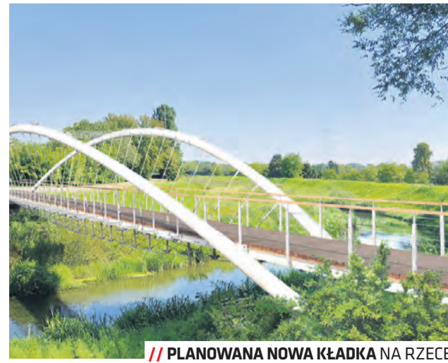
PLANOWANA NOWA KŁADKA NA RZECE

na ok 610 miejsc. Dodatkowo 209 miejsc postojowych pomieści teren pod trybunami. Koncepcja przewiduje łącznie 845 miejsc parkingowych (wraz z pozostałymi miejscami namiennymi dla samochodów osobowych i dla autokarów).