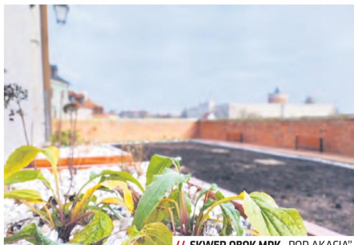
/// SKWER OBOK MDK „POD AKACJĄ”

Niezagospodarowana przestrzeń obok MDK „Pod Akacją” przy ul. Grodzkiej zmieniła się w kameralne miejsce odpoczynku i kontaktu z naturą.