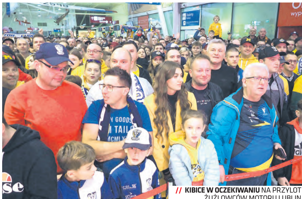
// KIBICE W OCZEKIWANIU NA PRZYLOT ŻUŻŁOWCÓW MOTORU LUBLIN