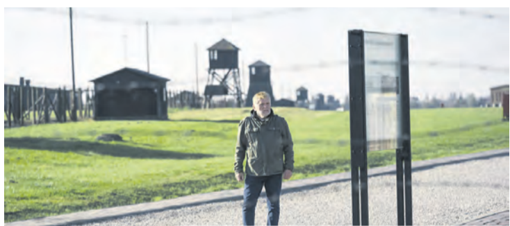
/// PLAN FILMOWY NA LUBELSKIM MAJDANKU

– Obraz skupia się na wydarzeniach sprzed lat, jednak jego przekaz jest aktualny i ważny dziś jako świadectwo okrucieństwa wojny. Niesie też pozytywne przesłanie budowane w oparciu