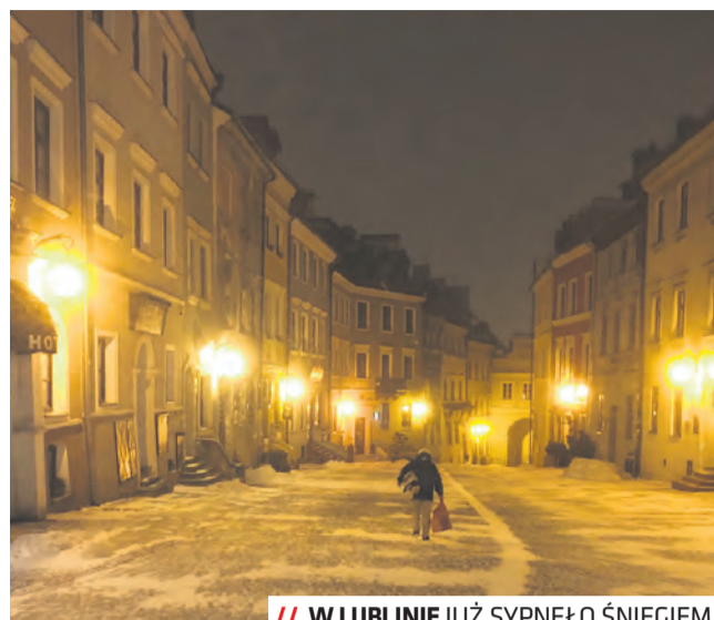
/// W LUBLINIE JUŻ SYPNĘŁO ŚNIEGIEM