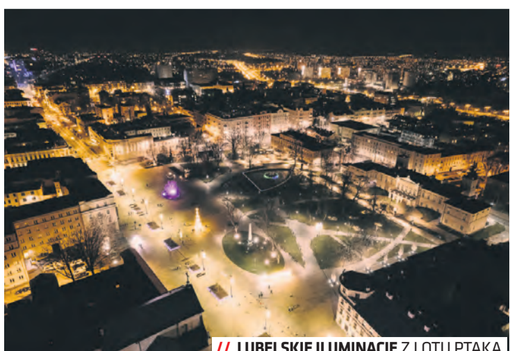
/// LUBELSKIE ILUMINACJE Z LOTU PTAKA

Poruszająca, pełna zwrotów akcji historia otrzymała dofinansowanie ze strony Lubelskiego Funduszu Filmowego w wysokości 30 tys. zł. Producentem filmu jest Fundacja Instytut Grzegorza Królikiewicza.