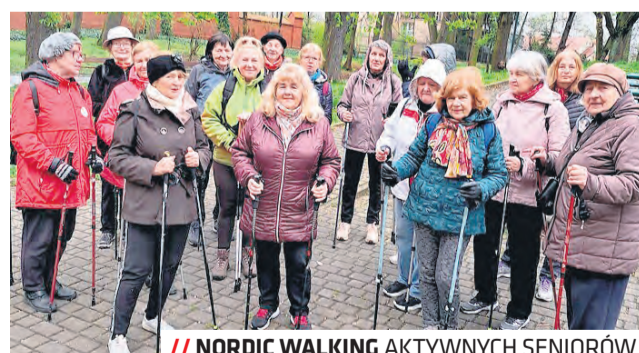
// NORDIC WALKING AKTYWNYCH SENIORÓW

– Liczę na to, że podobnie jak w ubiegłych latach, będą cieszyć się dużym zainteresowaniem mieszkańców. Szczególnie zachęcam do zapisów lubelską młodzież. To doskonała oka-