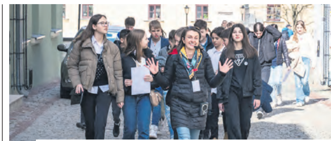
// NAJWIĘCEJ O MIEŚCIE MOŻNA SIĘ DOWIEDZIEĆ OD DOŚWIADCZONEGO I KREATYWNEGO PRZEWODNIKA

Uczestnikami programu „Rodzina Trzy Plus” mogą być wszyscy rodzice oraz ich małżonkowie, którzy zamieszkują w Lublinie oraz wychowują łącznie co najmniej troje dzieci w wieku do 18. roku życia lub do ukończenia 25 lat, gdy dziecko uczy się w szkole lub szkole wyższej. Istotną formą pomocy są m.in. ulgi w odpłatnościach w przedszkolach publicznych, czy możliwość korzystania z biuletu rodzinnego w komunikacji miejskiej. Bogaty pakiet usług programu „Rodzina Trzy Plus” dopełnia oferta lubelskich szkół – 8 z nich co roku oferuje rodzinom bezpłatny wstęp na swoje pływalnie.