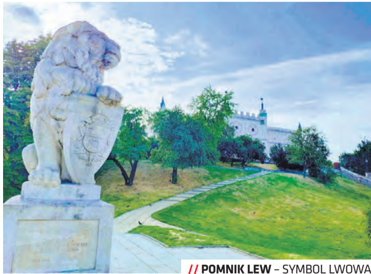
// POMNIK LEW – SYMBOL LWOWA

Pomnik składa się z figury lwa o wysokości 190 cm i 160 cm cokołu. Wykonano go na podstawie rzeźby lwów