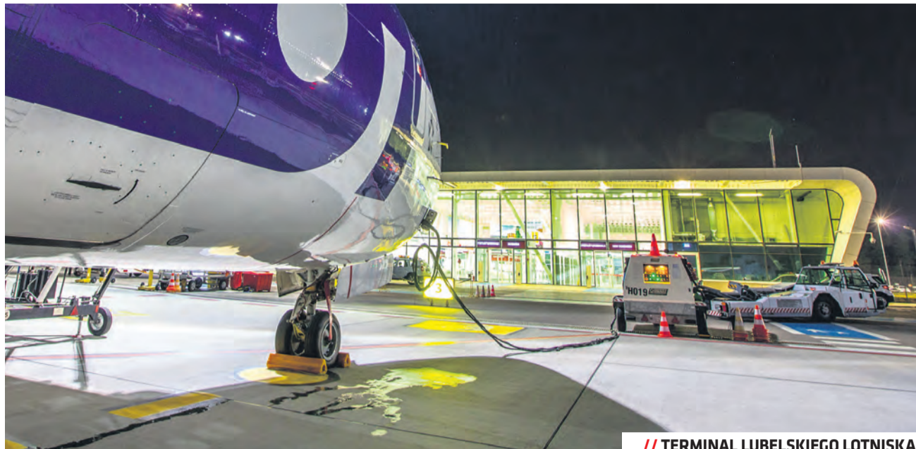
// TERMINAL LUBELSKIEGO LOTNISKA

Radę Studentów Lublina tworzy 26 członków. Swoich reprezentantów w Radzie mają trzy studenckie organizacje działające w Lublinie AIESEC, ELSA i IFMSA oraz dziewięć lubelskich uczelni wyższych.