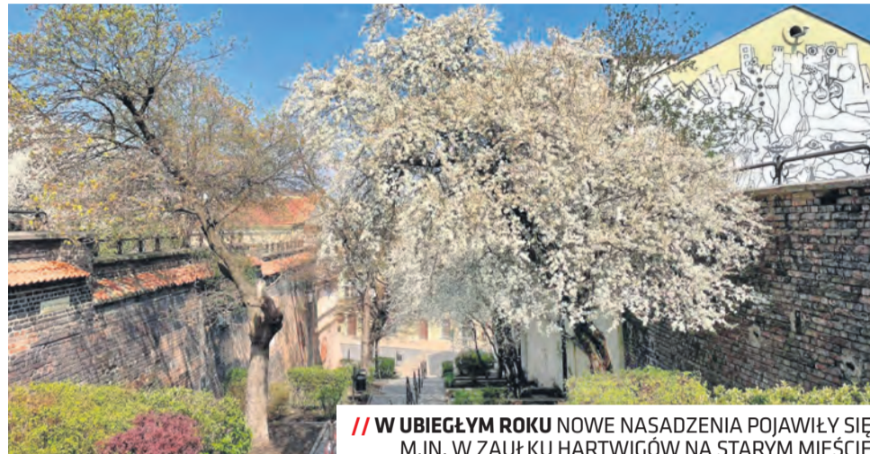
// W UBIEGŁYM ROKU NOWE NASADZENIA POJAWIŁY SIĘ M.IN. W ZAUŁKU HARTWIGÓW NA STARYM MIEŚCIE