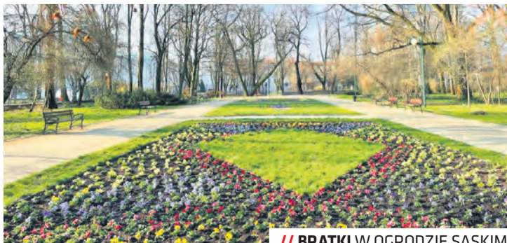
// BRATKI W OGRODZIE SASKIM