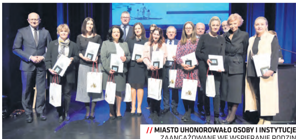
// MIASTO UHONOROWAŁO OSOBY I INSTYTUCJE ZAANGAŻOWANE WE WSPIERANIE RODZIN

Wprowadzony nowatorski program był innowacyjnym krokiem w myśleniu o przyszłości mieszkańców, a inicjatywa stała się impulsem do podjęcia prorodzinnych działań przez kolejne samorządy w Polsce oraz wzorcem dla ogólnopolskiej Karty Dużej