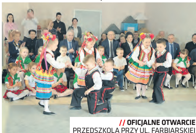
// OFICJALNE OTWARCIE PRZEDSZKOLA PRZY UL. FARBIARSKIEJ

Do nowego obiektu przeprowadziły się Przedszkole nr 14