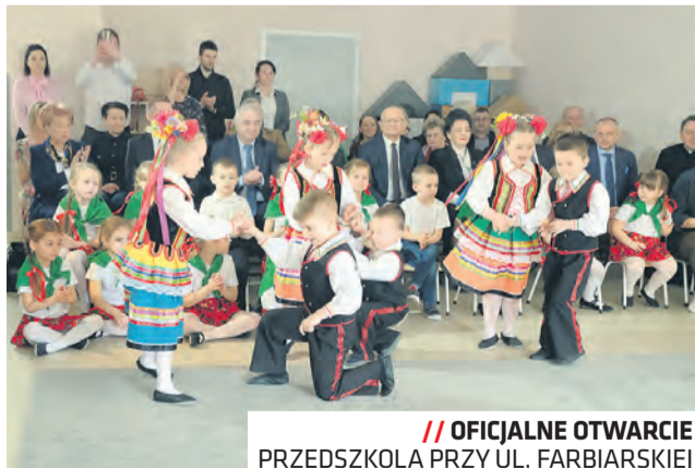
// OFICJALNE OTWARCIE PRZEDSZKOLA PRZY UL. FARBIARSKIEJ

Do nowego obiektu przeprowadziły się Przedszkole nr 14