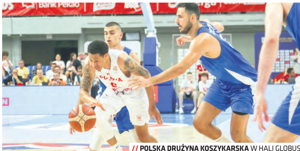
// POLSKA DRUŻYNA KOSZYKARSKA W HALI GLOBUS

nizację imprez, zapewnienie kadry instruktorskiej, dostępu do bazy i zajęć sportowych: – W przygotowywaniu oferty sportowej kierujemy się potrzebami mieszkańców, zarówno w zakresie umożliwienia im uczestnictwa w wydarzeniach jako kibice, jak i wspierania inicjatyw służą-