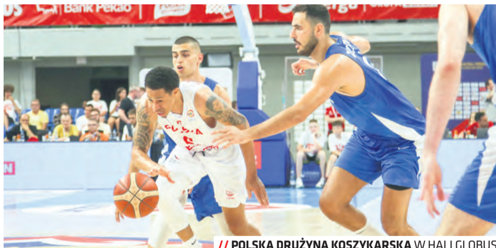
// POLSKA DRUŻYNA KOSZYKARSKA W HALI GLOBUS

nizację imprez, zapewnienie kadry instruktorskiej, dostępu do bazy i zajęć sportowych: – W przygotowywaniu oferty sportowej kierujemy się potrzebami mieszkańców, zarówno w zakresie umożliwienia im uczestnictwa w wydarzeniach jako kibice, jak i wspierania inicjatyw służą-