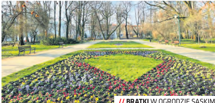
// BRATKI W OGRODZIE SASKIM