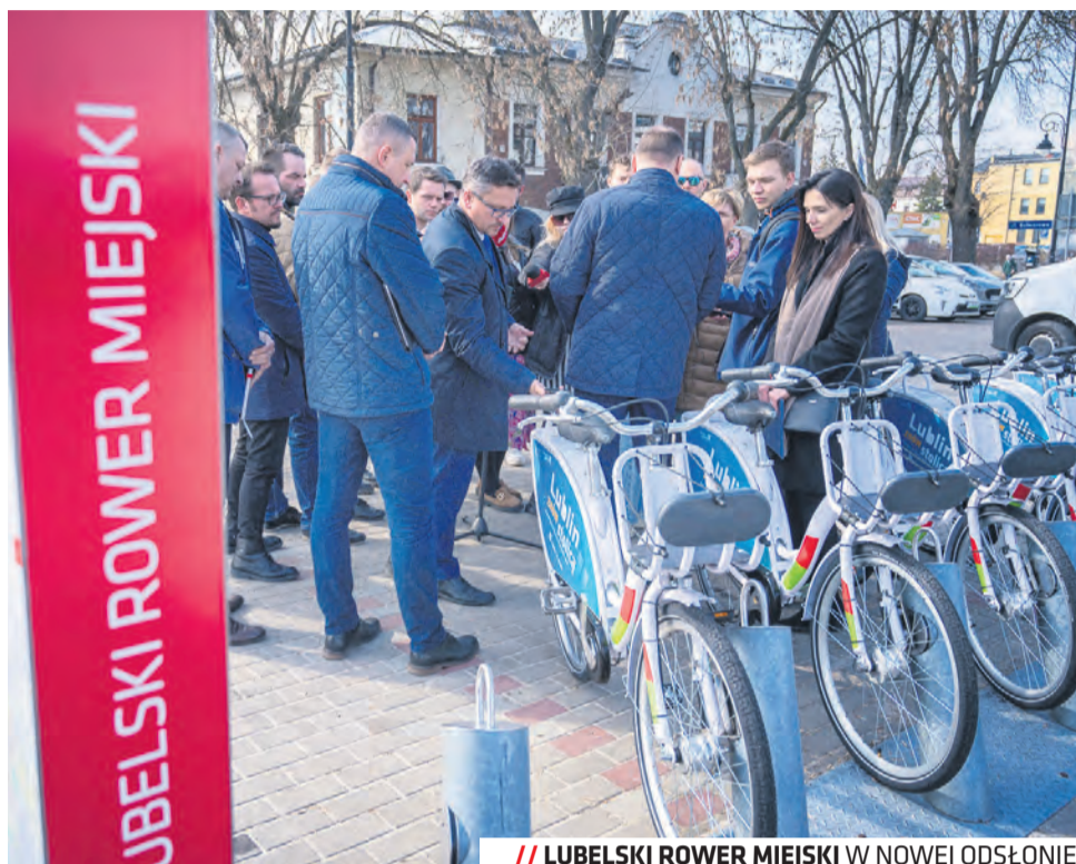
// LUBELSKI ROWER MIEJSKI W NOWEJ ODSŁONIE