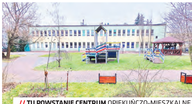
// TU POWSTANIE CENTRUM OPIEKUŃCZO-MIESZKALNE

– Zawarliśmy umowę z wykonawcą. Obiekt powstanie obok istniejącego w tym miejscu