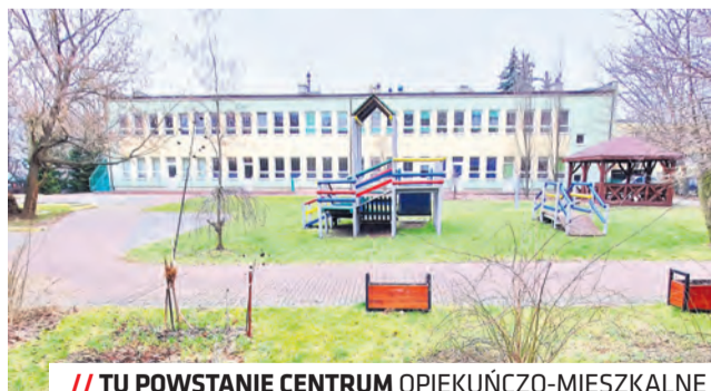
// TU POWSTANIE CENTRUM OPIEKUŃCZO-MIESZKALNE

– Zawarliśmy umowę z wykonawcą. Obiekt powstanie obok istniejącego w tym miejscu