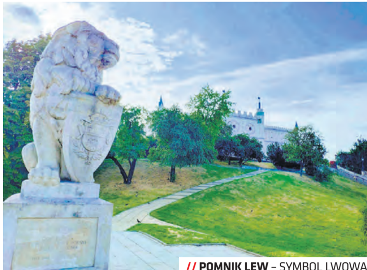
// POMNIK LEW – SYMBOL LWOWA

Pomnik składa się z figury lwa o wysokości 190 cm i 160 cm cokołu. Wykonano go na podstawie rzeźby lwów