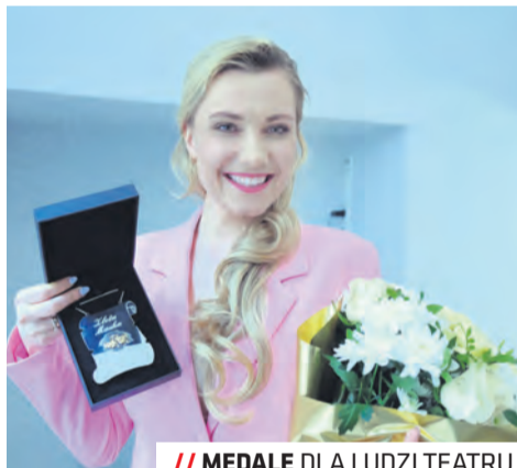
// MEDALE DLA LUDZI TEATRU