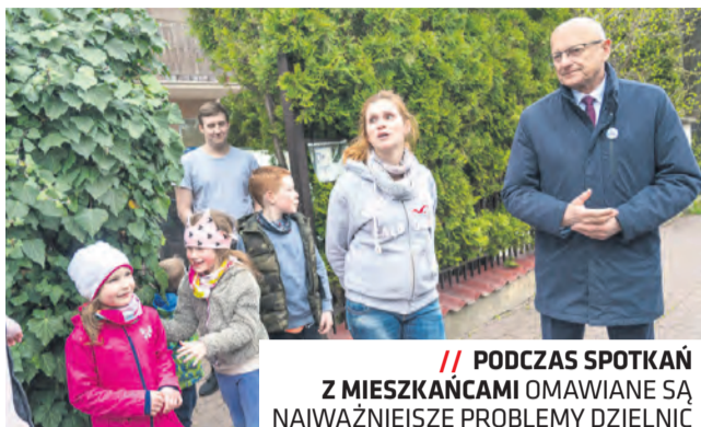
// PODCZAS SPOTKAŃ Z MIESZKAŃCAMI OMAWIANE SĄ NAJWAŻNIEJSZE PROBLEMY DZIELNIC

Rozpoczęły się tegoroczne dzielnicowe warsztaty i spacerzy w ramach projektu „Plan dla dzielnic”.