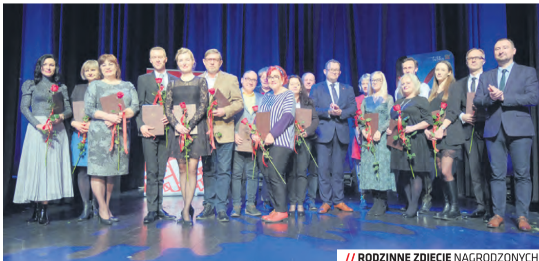
// RODZINNE ZDJĘCIE NAGRODZONYCH

Medale Prezydenta oraz Zastępcy dla Miasta Lublin otrzymało wiele osób tworzących lubelski teatr, zarówno twórcy zawodowi, jak i występujący na deskach amatorzy. Pełną listę nagrodzonych znaleźć można m.in. na stronie www.lublin.eu .