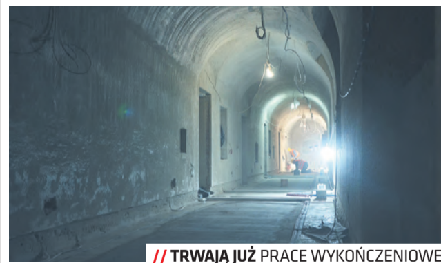
// TRWAJĄ JUŻ PRACE WYKOŃCZENIOWE

Inwestycja w piwnicach Centrum Kultury realizowana jest w ramach projektu „Udośkonalenie nowych powierzchni do prowadzenia działalności kulturalnej w piwnicach klasztoru powiatkowskiego w Lublinie”, współfinansowanego ze środków EFRR w ramach Regionalnego Programu Operacyjnego Województwa Lubelskiego na lata 2014–2020.