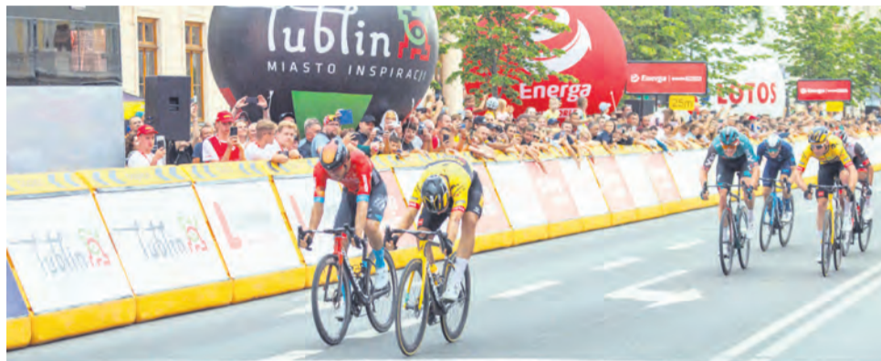
// META I ETAPU TOUR DE POLOGNE NA KRAKOWSKIM PRZEDMIEŚCIU

Zdaniem prezydenta Stepaniuk-Kuśmierzak kluczem do sukcesu jest współpraca całego środowiska i realizacja procesu o systemowym charakterze obejmującym orga-