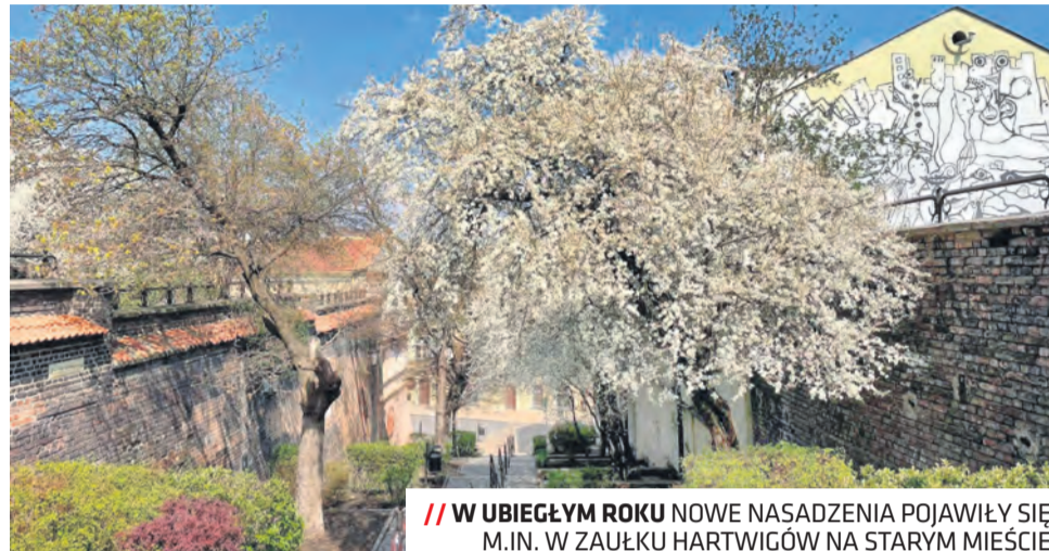
// W UBIEGŁYM ROKU NOWE NASADZENIA POJAWIŁY SIĘ M.IN. W ZAUŁKU HARTWIGÓW NA STARYM MIEŚCIE