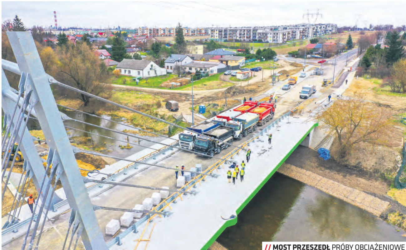
// MOST PRZESZEDŁ PRÓBY OBCIĄŻENIOWE