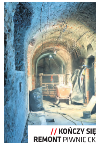
// KOŃCZY SIĘ REMONT PIWNIC CK

Dzięki trwającej adaptacji w piwnicach Centrum Kultury powstaną nowoczesne