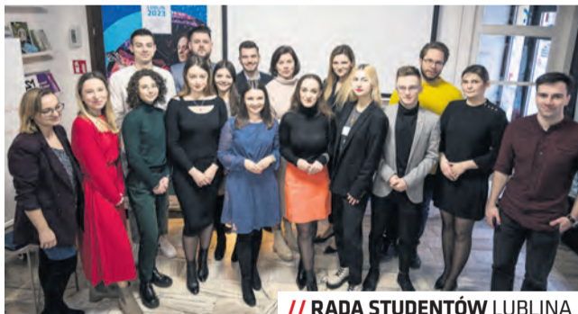
// RADA STUDENTÓW LUBLINA

Rada Studentów Lublina wybrała nowego przewodniczącego i wiceprzewodniczącą.