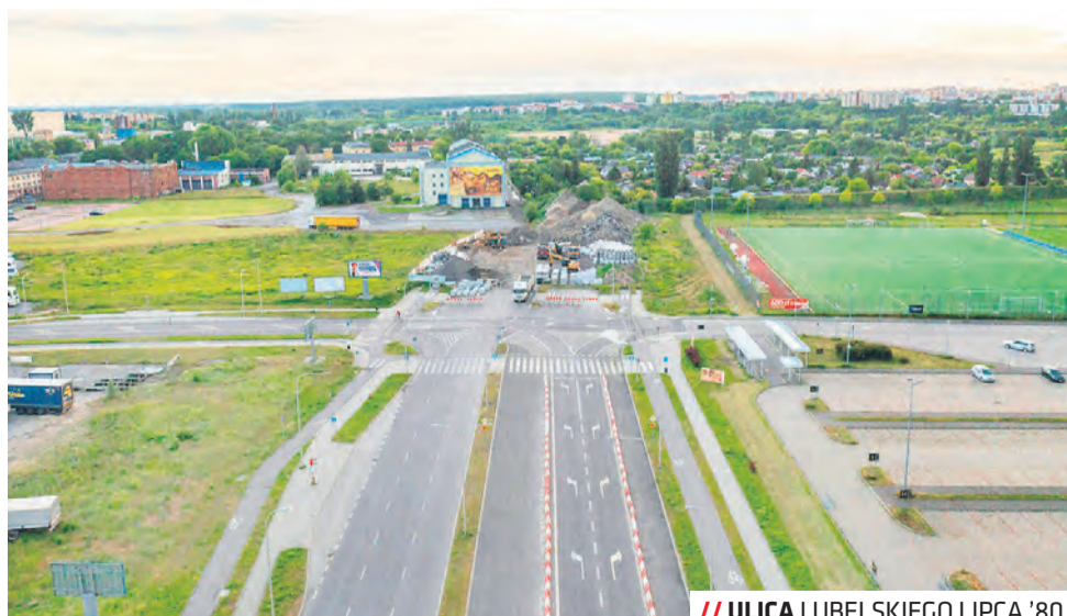
// ULICA LUBELSKIEGO LIPCA '80

– Wybór wykonawcy to ostatni krok formalny, który docelowo pozwoli podpisać umowę i rozpocząć w terenie realizację tego