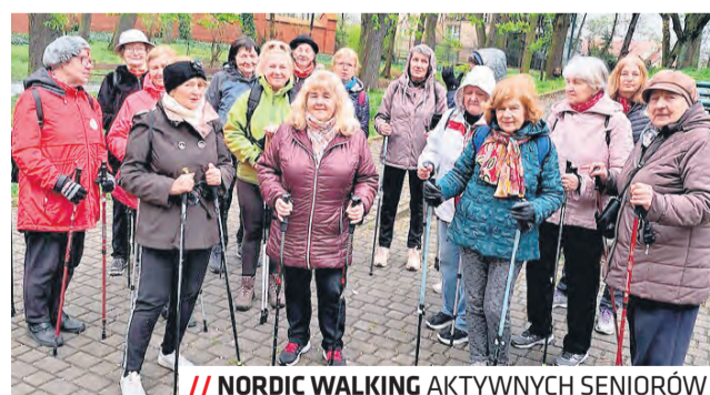
// NORDIC WALKING AKTYWNYCH SENIORÓW

– Liczę na to, że podobnie jak w ubiegłych latach, będą cieszyć się dużym zainteresowaniem mieszkańców. Szczególnie zachęcam do zapisów lubelską młodzież. To doskonała oka-