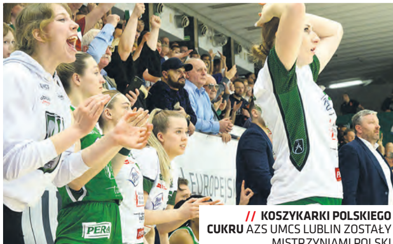
// KOSZYKARKI POLSKIEGO CUKRU AZS UMCS LUBLIN ZOSTAŁY MISTRZYNIAMI POLSKI

Nasze miasto jest jednym z najbardziej przyjaznych sportowi samorządów w Polsce. Stowarzyszenie Sport Biznes Polska wyróżniło Lublin już po raz drugi. Nagrodzony został również program Sportowy Talent. W 2022 roku wydatki miasta na sport wyniosły blisko 48 mln zł. Na promocję poprzez sport przeznaczono ponad 1,46 mln zł. Lubelskie kluby sportowe otrzymały możliwość prowadzenia szkolenia sportowego, rozgrywania meczów oraz organizacji imprez z wykorzystaniem komunalnej infrastruktury sportowej pozostającej w zarządzie MOSiR „Bystrzyca” w Lublinie. Środki przeznaczone na ten cel to ponad 17,5 mln zł.