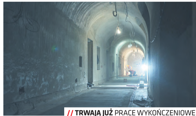
// TRWAJĄ JUŻ PRACE WYKOŃCZENIOWE

Inwestycja w piwnicach Centrum Kultury realizowana jest w ramach projektu „Udośpienie nowych powierzchni do prowadzenia działalności kulturalnej w piwnicach klasztoru powiatkowskiego w Lublinie”, współfinansowanego ze środków EFRR w ramach Regionalnego Programu Operacyjnego Województwa Lubelskiego na lata 2014–2020.