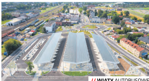
// WIATY AUTOBUSOWE

Architektoniczny wyróżnik i ozdobę budynku stanowią olbrzymie wolnostojące filary, nawiązujące swoim stylem do formy ludowych wycinanek.