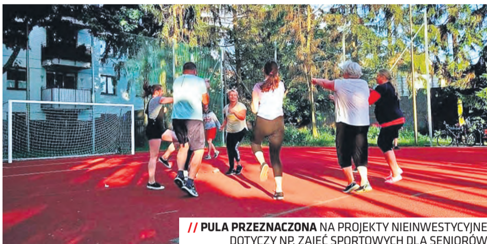
// PUŁA PRZEZNACZONA NA PROJEKTY NIEINWESTYCYJNE DOTYCZY NP. ZAJĘĆ SPORTOWYCH DLA SENIORÓW

remontu nawierzchni ulic, po budowę chodnika, oświetlenia czy ścieżki rowerowej. Na Rurach chcą zbudować najdłuższą zjeżdżalnię w mieście, Podzamcze ma być bezpieczne dla rowerzystów, na Szerokim