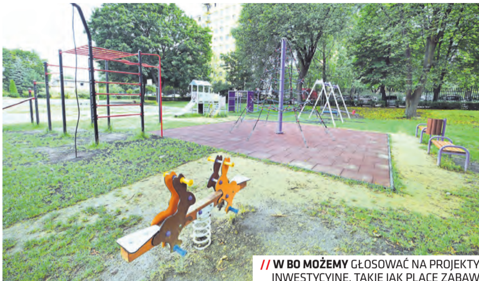
// W BO MOŻEMY GŁOSOWAĆ NA PROJEKTY INWESTYCYJNE, TAKIE JAK PLACE ZABAW

Do kolejnego etapu zakwalifikowało się wiele mniejszych i większych projektów inwestycyjnych w dzielnicach. Od