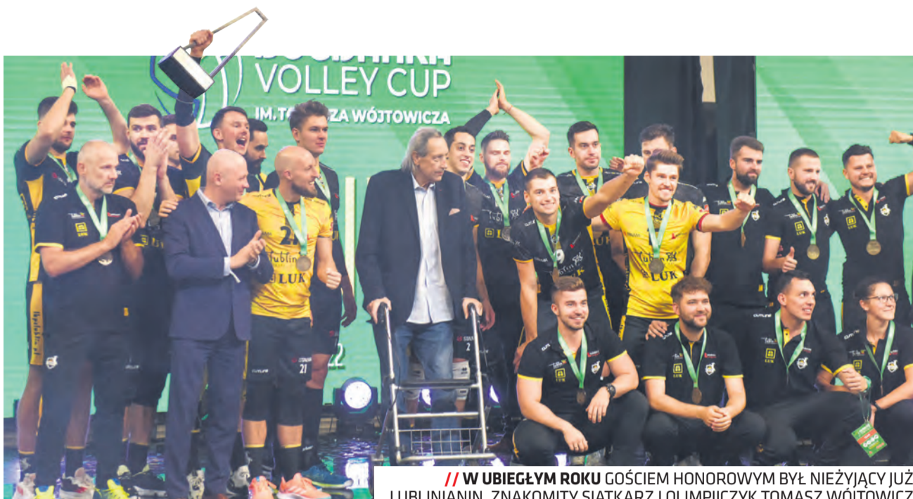
// W UBIEGŁYM ROKU GOŚCIEM HONOROWYM BYŁ NIEŻYJĄCY JUŻ LUBLINIANIN, ZNAKOMITY SIATKARZ I OLIMPIJCZYK TOMASZ WÓJTOWICZ