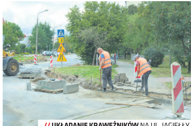
// UKŁADANIE KRAWĘŻNIKÓW NA UL. JAGIEŁY

Nowe nawierzchnie zostały położone m.in. na ulicach: Goździkowej, Biskupińskiej, Słupian, Krwawicza i Piątkowskiego. Zakończyły się też prace na ul. Niepodległości, gdzie drogowcy naprawili asfaltową nawierzchnię zatok parkingowych i przystankowych komu-