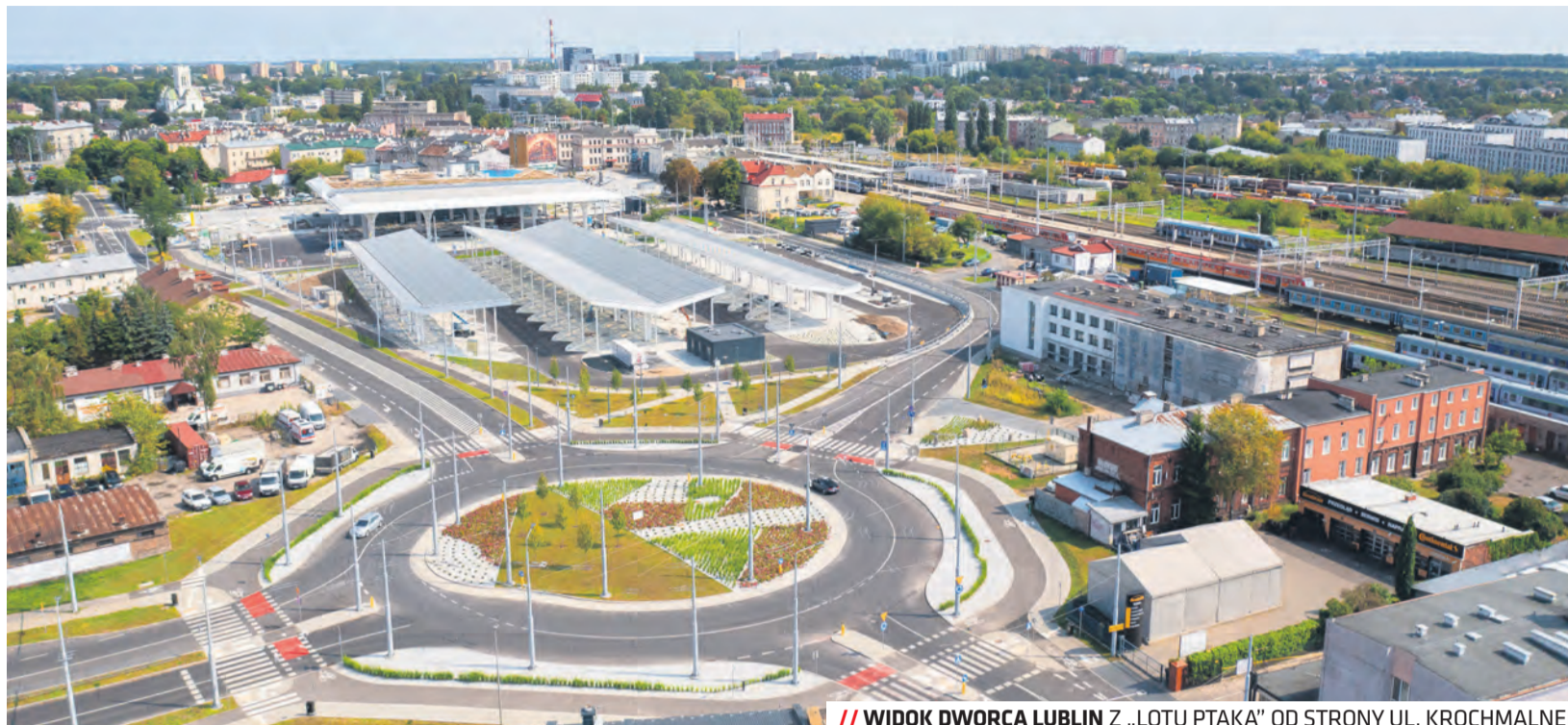
// WIDOK DWORCA LUBLIN Z „LOTU PTAKA” OD STRONY UL. KROCHMALNEJ

Wieloletnie inwestycje w nowoczesny tabor sprawiają, że Lublin jest w ścisłej czołówce systemów elektromobilnych w Polsce oraz w Europie. Inwestycje w autobusy elektryczne i trolejbusy sprawiają, że Lublin już dziś spełnia 30% próg udziału pojazdów zeroemisyjnych w całej flocie. Dla porównania w skali Polski ustawa o elektromobilności nakazuje spełnienie tego progu do 2028 roku.