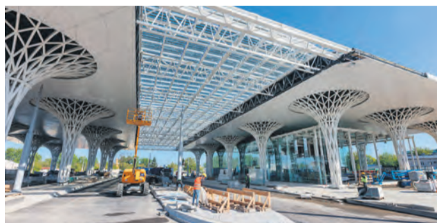
// CHARAKTERYSTYCZNE I NIEPOWTARZALNE METALOWE „GRZYBK” PODTRZYMUJĄCE KONSTRUKCJĘ