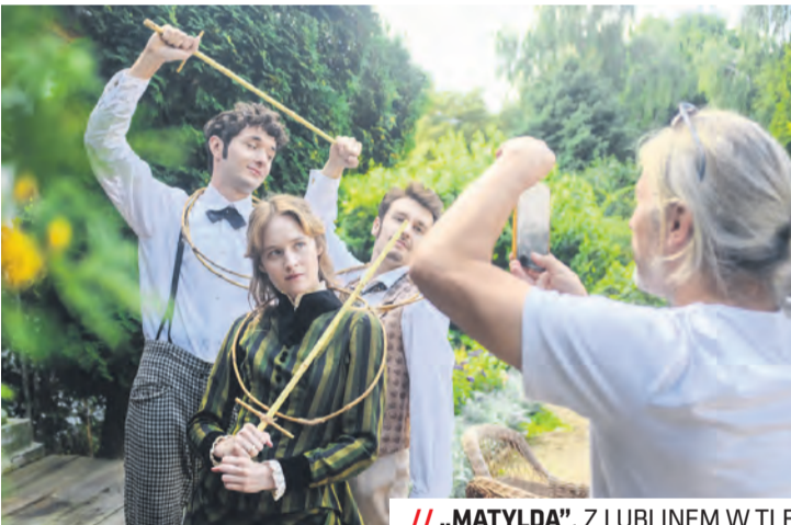
// „MATYLDA”, Z LUBLINEM W TLE

„Matyllda” to saga o walce dobra ze złem. W tle rozgrywają się historyczne wydarzenia i zjawiska, takie jak nie-