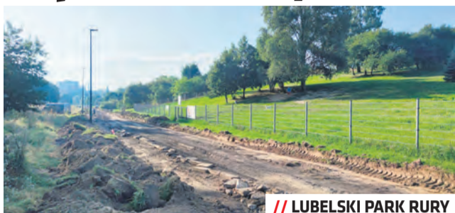
// LUBELSKI PARK RURY

W parku Rury przebudowywana jest Aleja Miast Partnerskich. W tym roku powstanie tam nowa droga pieszo-rowerowa.