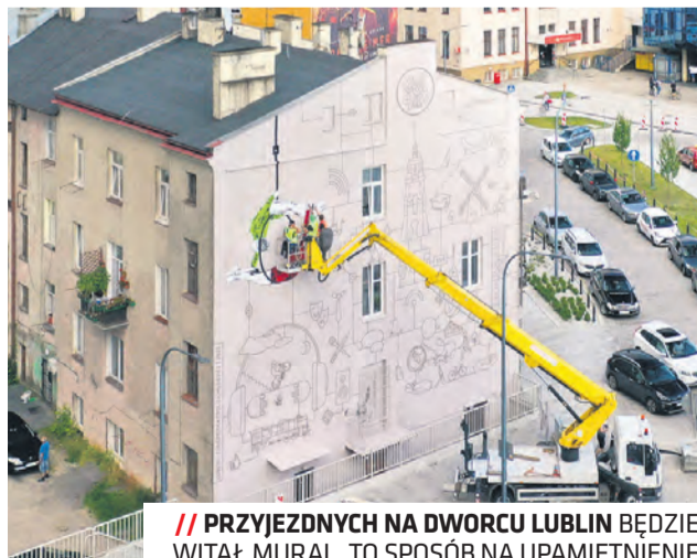
// PRZYJEZDNYCH NA DWORCU LUBLIN BĘDZIE WITAŁ MURAL. TO SPOŚÓB NA UPAMIĘTNIENIE EUROPEJSKIEJ STOLICY MŁODZIEŻY 2023.

Całość zostanie funkcjonalnie i efektywnie oświetlona.