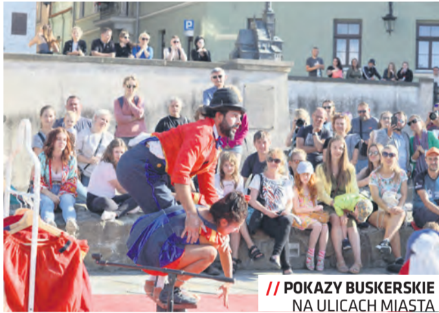
// POKAZY BUSKERSKIE NA ULICACH MIASTA

– W 2023 roku Lublin świętuje obchody Europejskiej Stolicy Młodzieży. Dlatego cieszy nas to, że najliczniejszą grupę turystów odwiedzających nasze miasto stanowią