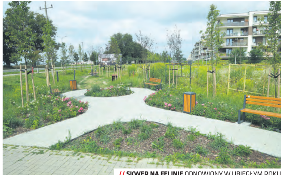
// SKWER NA FELINIE ODNOWIONY W UBIEGŁYM ROKU

W VI edycji Zielonego Budżetu przemianę przejdzie łącznie 11 miejsc w Lublinie. To m.in. park w Głusku, Zielona Sala Wykładowa, skwerki przy ul. Lipowej. Do tego rów-