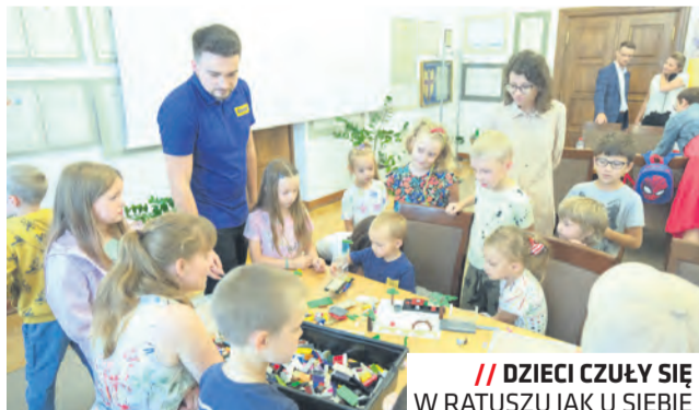
// DZIECI CZUŁY SIĘ W RATUSZU JAK U SIEBIE

Lubelski Family Spot ma bogaty program merytoryczny i cieszy się dużym zaintereso-