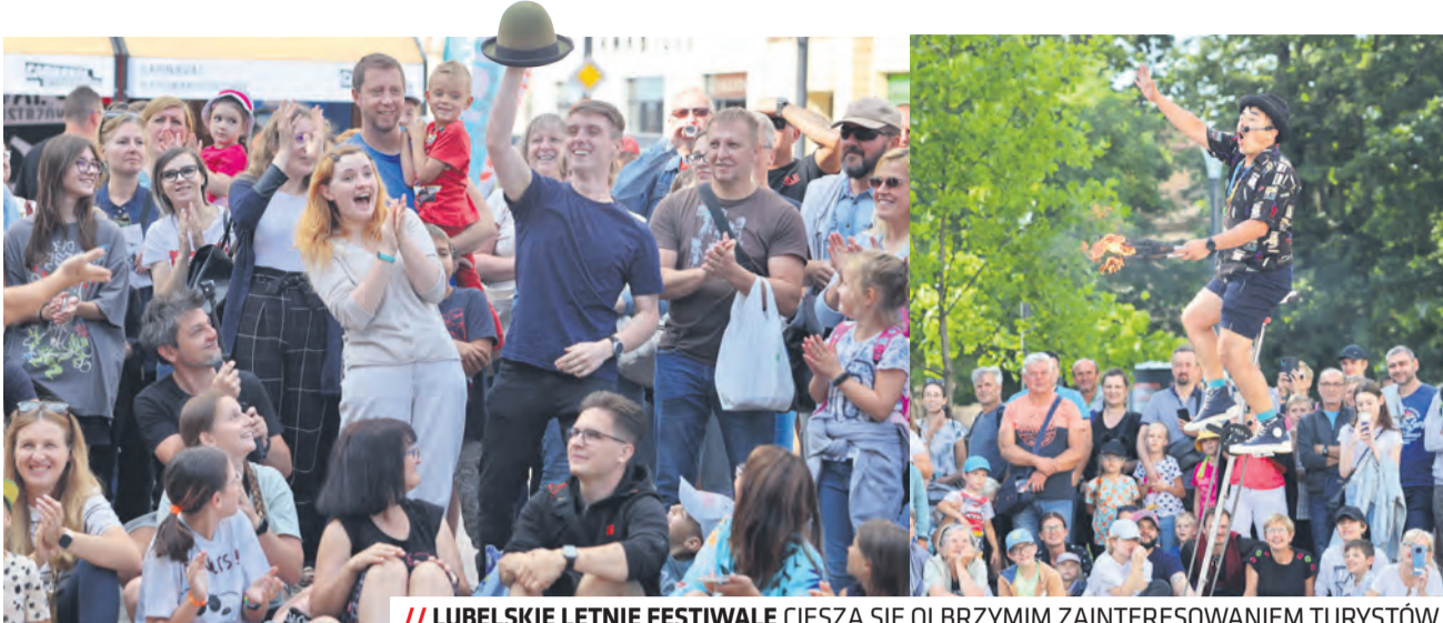
// LUBELSKIE LETNIE FESTIWALE CIESZĄ SIĘ OLBRZYMI ZAINTERESOWANIEM TURYSTÓW