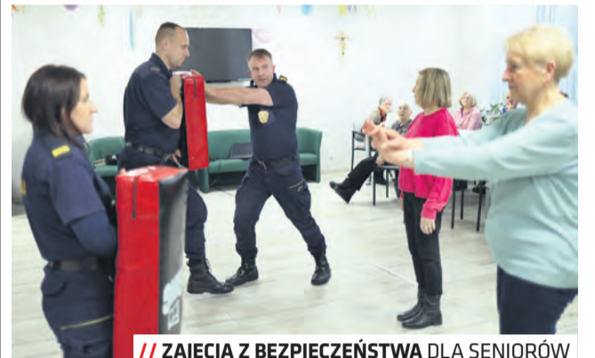
// ZAJĘCIA Z BEZPIECZEŃSTWA DLA SENIORÓW

Projekt przewiduje również wymianę części kamer monitoringu wizyjnego w Ogrodzie Saskim.