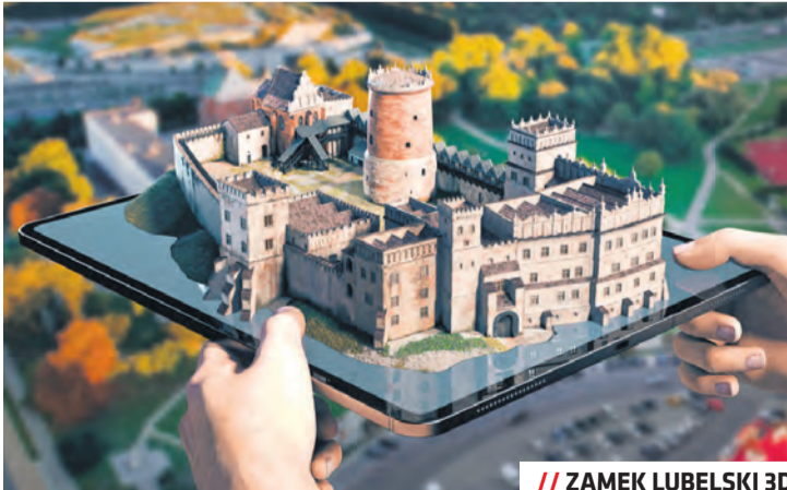
// ZAMEK LUBELSKI 3D

Nowy model 3D przedstawia rezydencję królewską, jeden z najważniejszych zabytków w historii Lublina. Początki zabudowań na Wzgórzu Zamkowym sięgają jeszcze XII wieku, ale murowany zamek powstał wraz z Kaplicą Trójcy Świętej w wieku XIV. Budynek gościł polskich królów, w tym wielokrotnie króla Władysława Jagiełłę, a w 1569 roku w jego salach toczyły się