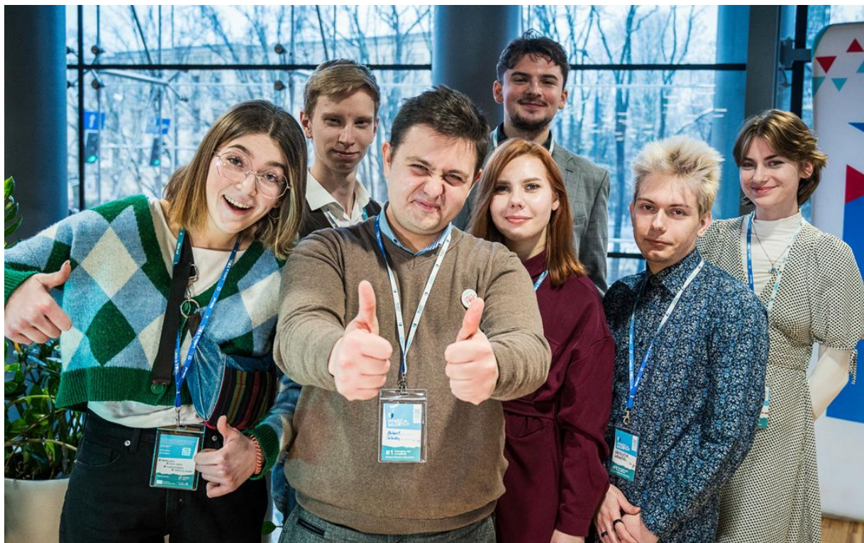
Foto: Zdjęcie uczestników i uczestniczek Kongresu

Wskazano potrzebę zapewnienia cichego miejsca: Brakowało cichego pomieszczenia, w którym można by było odpocząć od wszelkich bodźców, wyciszyć się, etc. Pojawiła się jedna sugestia, by w przypadku kolejnych edycji Kongresu zadbać o bardziej równomierny udział osób różnych płci. Jedna z osób zaproponowała, że warto by było zrealizować dłuższy projekt w podobnej tematyce, np. wakacyjny Erasmus.