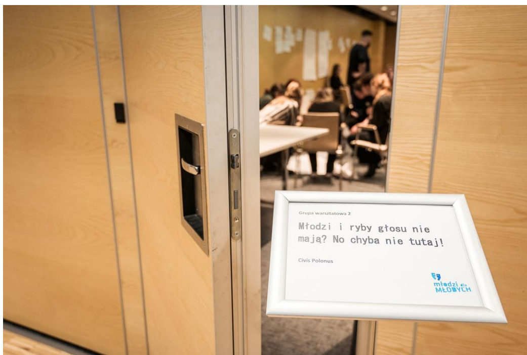
Foto: zdjęcie z warsztatów

Z czym zmagają się młodzież (co ma wpływ na brak zaangażowania):