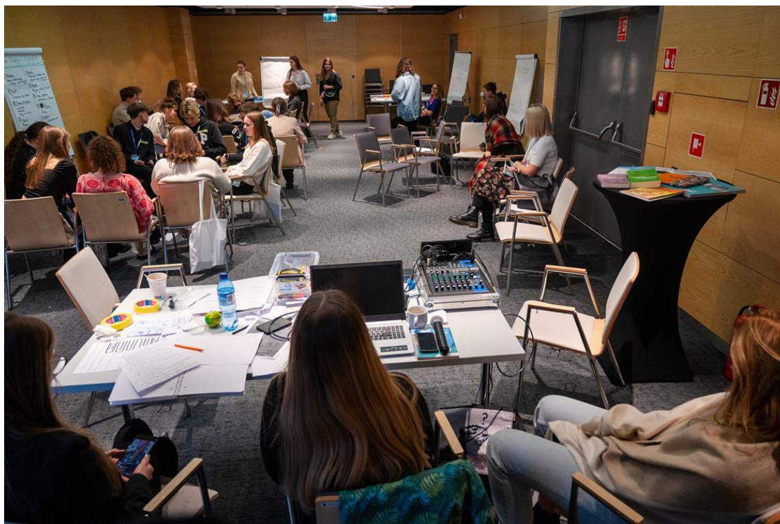
Foto: zdjęcie z warsztatów

Uczestnicy i uczestniczki warsztatu pn. „Miasto przyjazne młodym - warsztaty o kreowaniu miasta pod potrzeby młodzieży” pracowali w kontekście życia w mieście i tego, jak miasto realizuje potrzeby młodych ludzi.