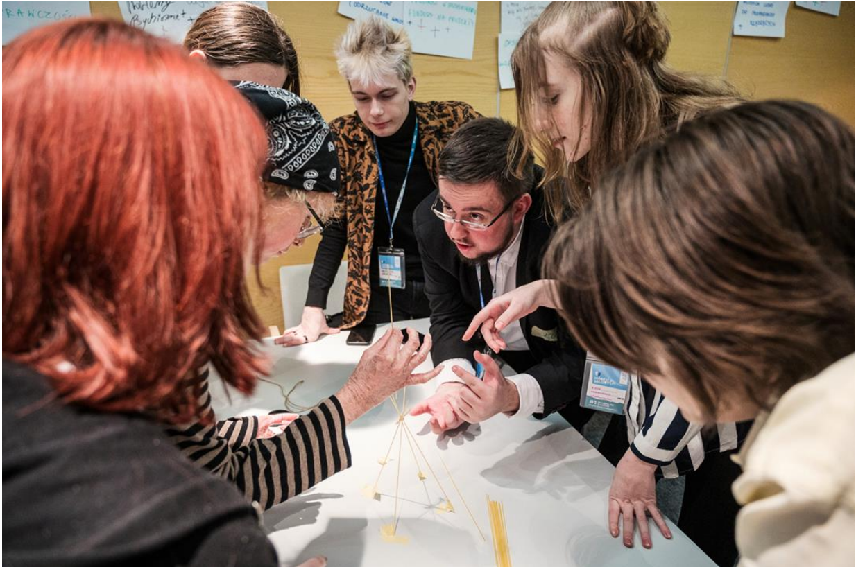
Foto: zdjęcie z warsztatów