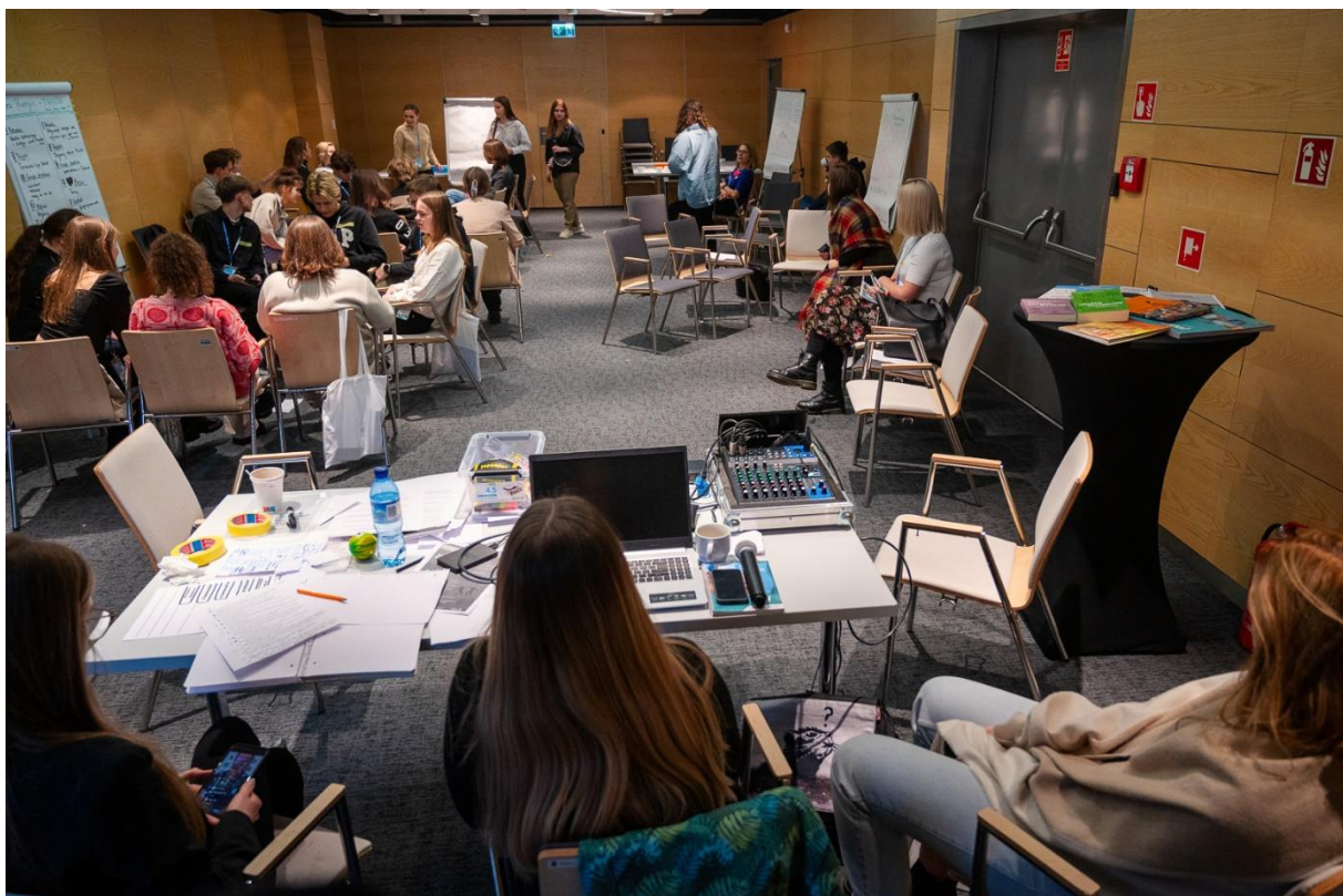
Foto: zdjęcie z warsztatów