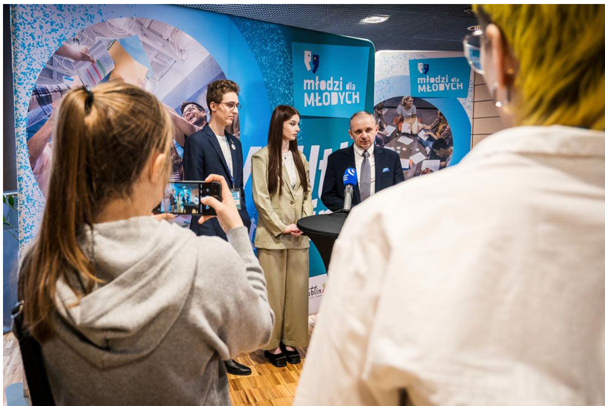
Foto: zdjęcie z konferencji prasowej przed rozpoczęciem Kongresu: przedstawiciele Młodzieżowej Rady Miasta Lublin i władz miasta Lublina.

W tym raporcie podsumowane zostały treści wypracowane głównie przez 4 grupy warsztatowe pracujące w obszarach: Wolontariat, Współrzędzenie, Zdrowie Psychiczne oraz Miasto. Każda grupa pracowała inną metodą, ale wszystkie dążyły do wypracowania wniosków dotyczących potrzeb, problemów, rozwiązań i metod włączania młodzieży. Druga część raportu podsumowuje ankietę ewaluacyjną dotyczącą kongresu.