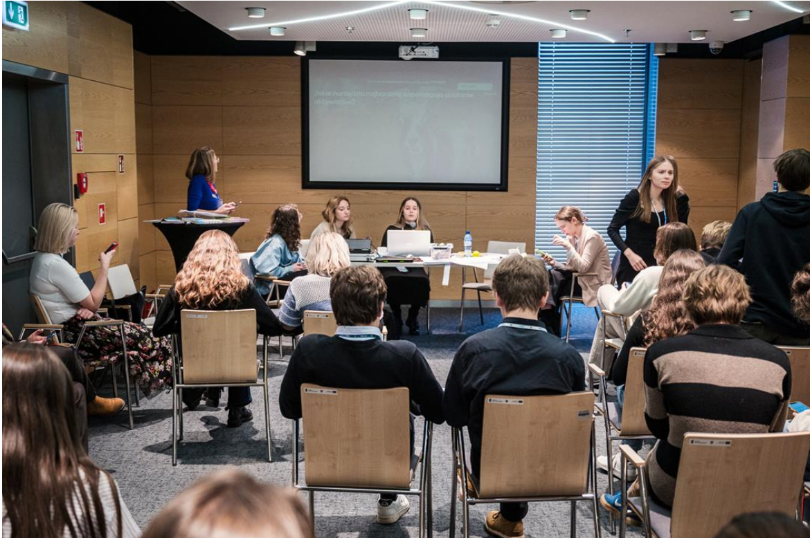
Foto: zdjęcie z warsztatów