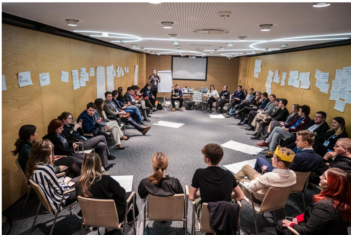
Foto: zdjęcie z warsztatów

Problemy wybrane przez grupę do dalszej pracy i wskazania rozwiązań: