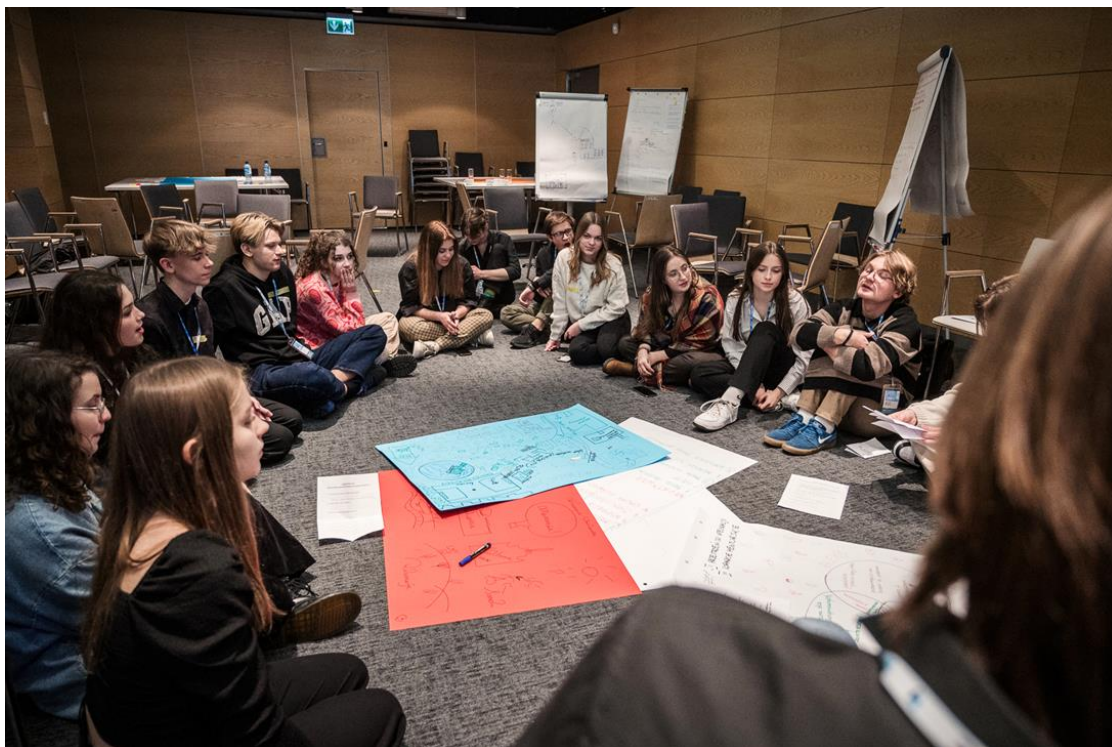
Foto: zdjęcie z warsztatów

zespoły, wychodząc od rozmowy o rozwiązaniach, skupiały się na problemach, inne bardziej na zdefiniowaniu potrzeb.