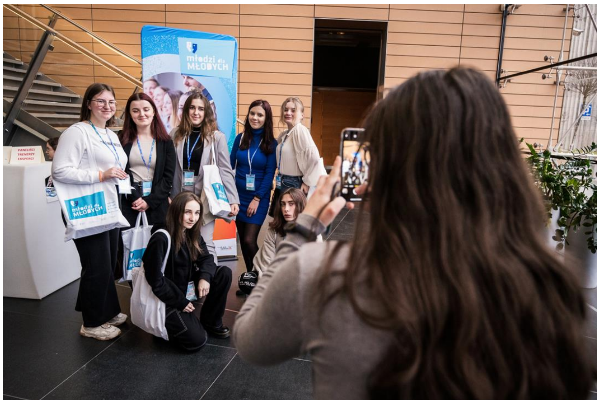
Foto: osoby uczestniczące w Kongresie na pamiątkowym zdjęciu