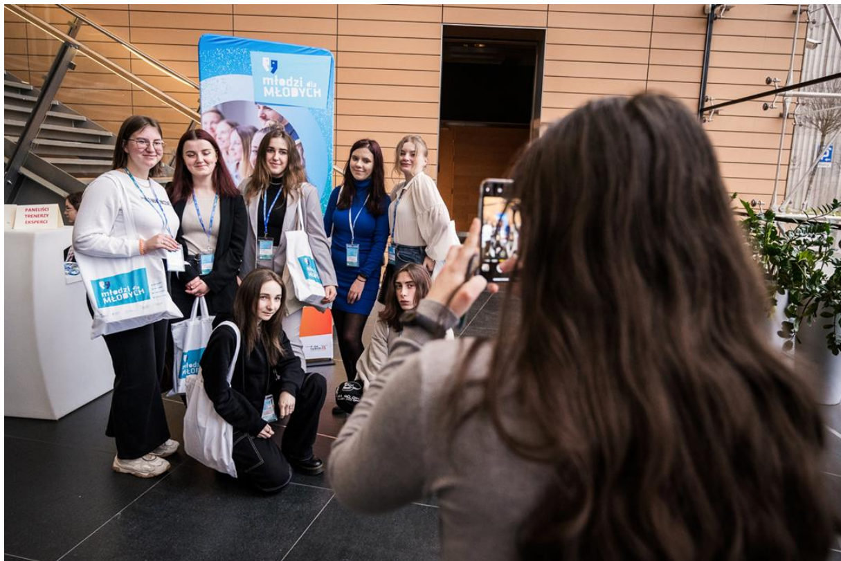
Фото: Учасники Конгресу на пам'ятному фото

Основна мета, яку вказала група: створення міста, заснованого на потребах молоді.