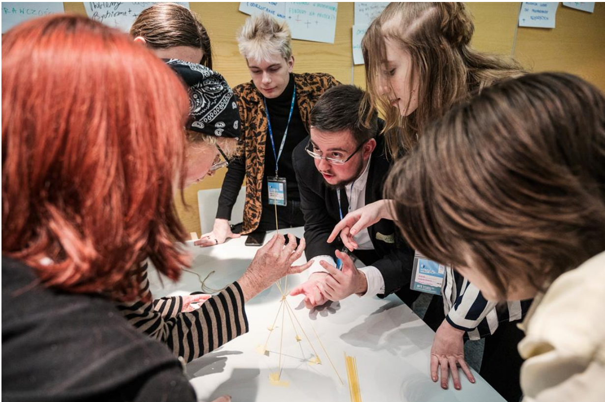
Фото: знімок з воркшопу