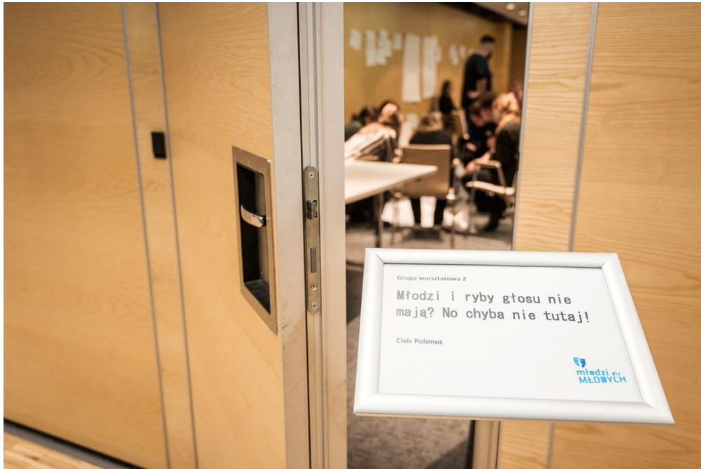
Фото: знімок з воркшопу

З чим бореться молодь (що сприяє відсутності зацікавленості):