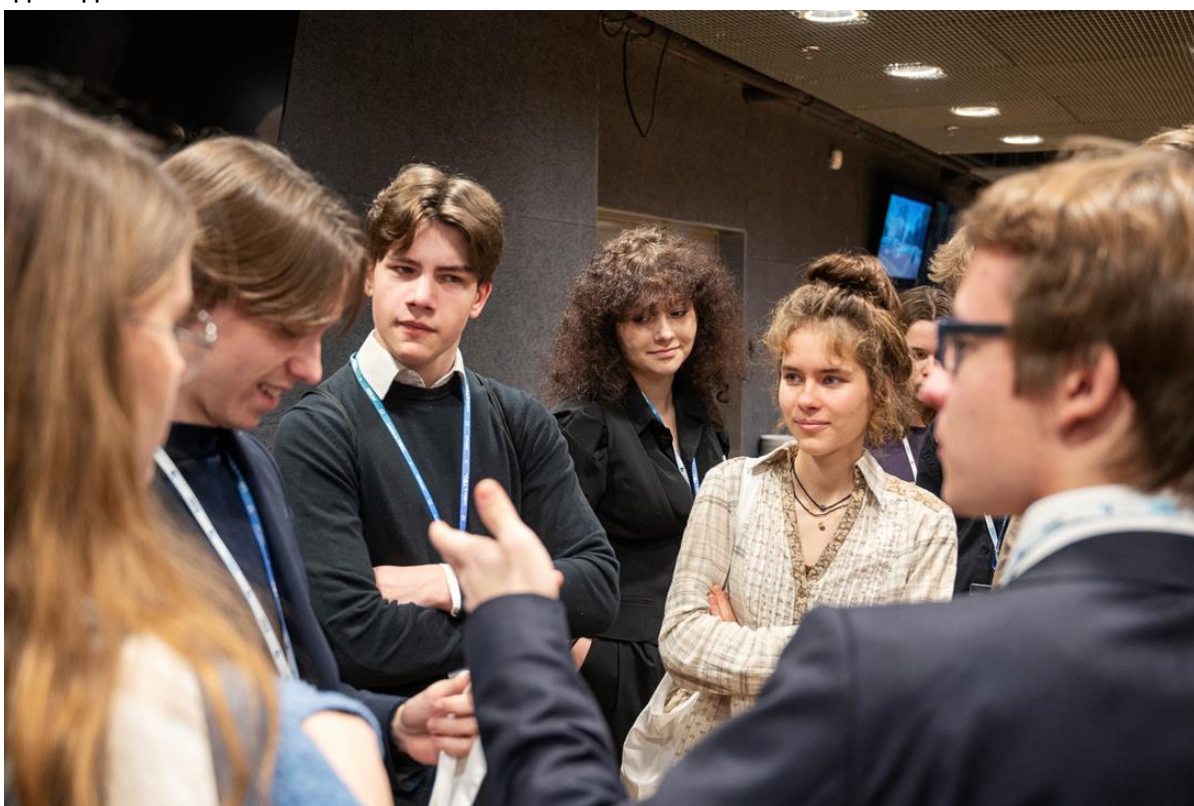
Фото: Учасники конгресу - кулуарні дискусії