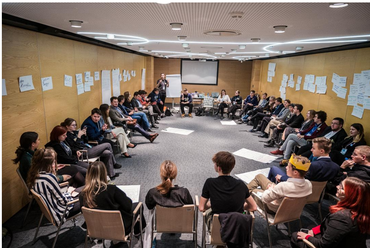
Фото: знімок з воркшопу

Вибрані групою проблеми для подальшої роботи та вирішення: