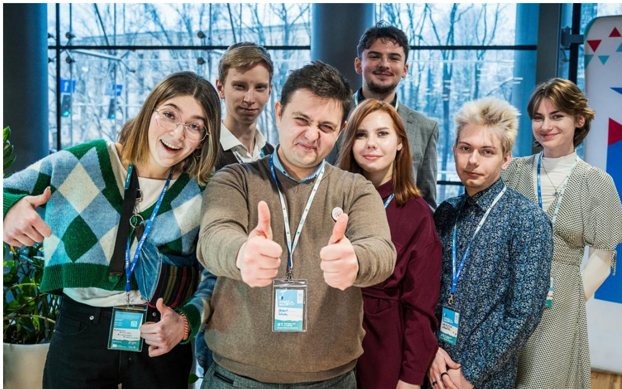
Фото: учасники та учасниці Конгресу

Було виявлено потребу в тихому просторі: Не вистачало тихої кімнати, де люди могли б відпочити від усіх подразників, заспокоїтися тощо. Було висловлено пропозицію, що для майбутніх Конгресів слід забезпечити більш рівномірну участь людей різної статі. Одна людина припустила, що варто було б організувати більш тривалий проект на подібну тему, наприклад, Erasmus під час канікул.