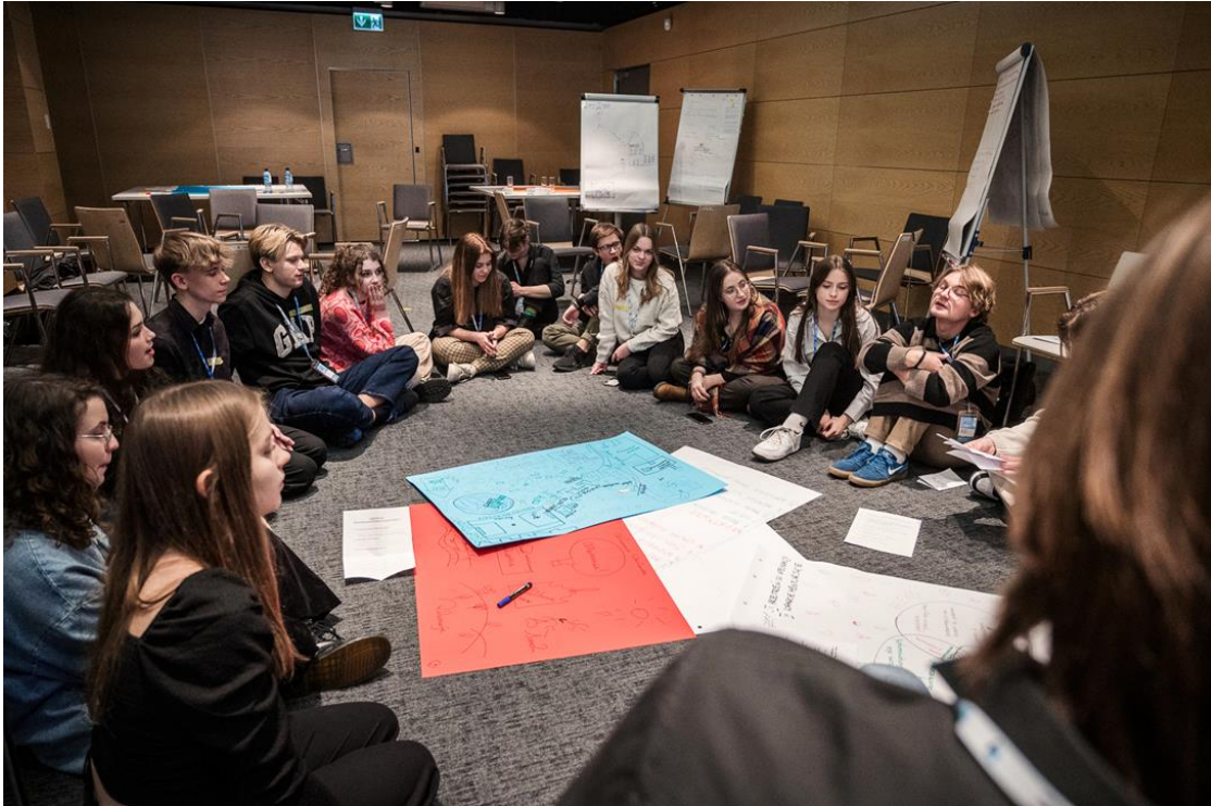
ФОТО: ЗНІМОК З воркшопу