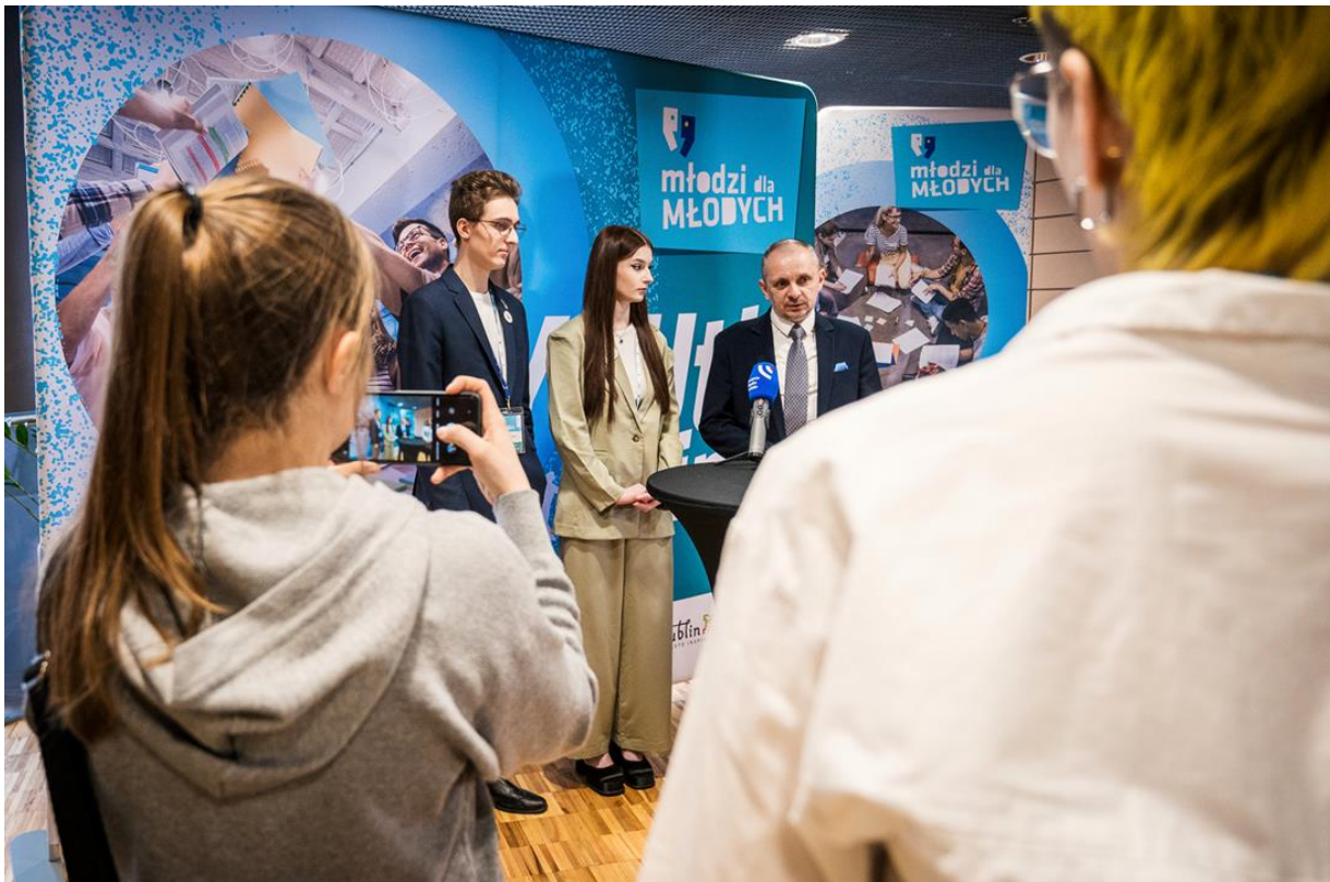
Фото: прес-конференція перед Конгресом: представники Люблінської міської молодіжної ради та міської влади Любліна.

У цьому звіті узагальнено матеріали, розроблені переважно 4-ма робочими групами, які працювали у таких сферах, як: Волонтерство, Спільне управління, Психічне здоров'я та Місто. Кожна група працювала з застосуванням іншого методу, але всі вони були спрямовані на розробку висновків щодо потреб, проблем, рішень та методів залучення молоді. Друга частина звіту підсумовує оцінювальне опитування, що стосується Конгресу.