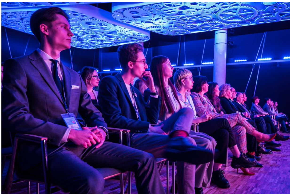
Фото: Учасники Конгресу молодих активістів та активісток «Давайте познайомимося!» в Любліні

молоді - діяльність молоді Любліна з метою інтеграції молодіжних середовищ», який є частиною святкування «Європейська молодіжна столиця Люблін 2023», що реалізується за фінансової підтримки Європейського Союзу в рамках програми Erasmus+.