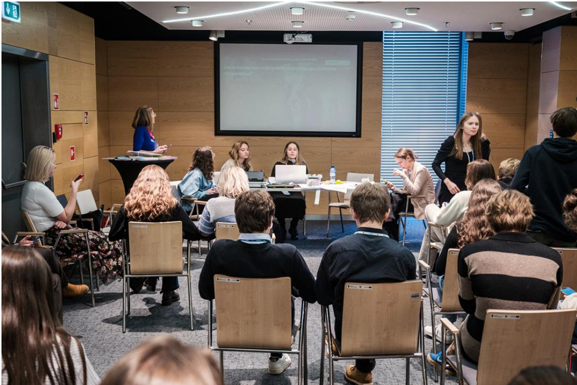
Фото: знімок з воркшопу