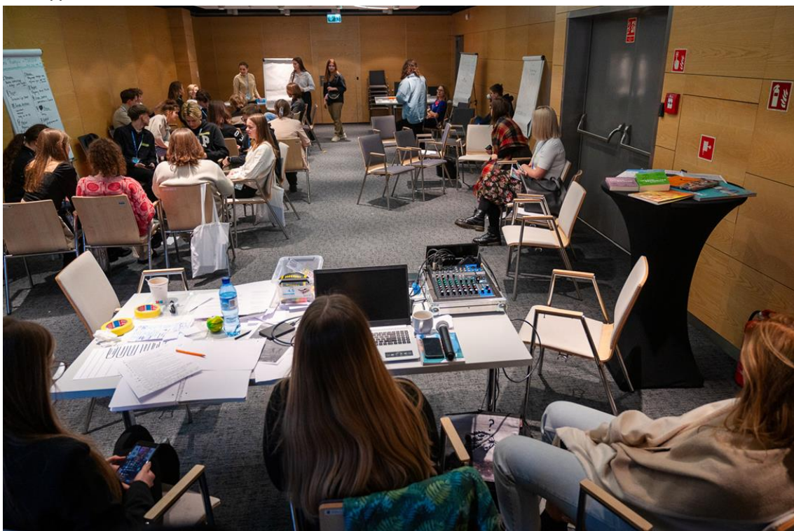
Фото: знімок з воркшопу

Учасники воркшопу "Місто, доброзичливе для молоді - воркшоп зі створення міста, що відповідає потребам молоді" працювали в контексті міського життя та того, як місто задовольняє потреби молоді.