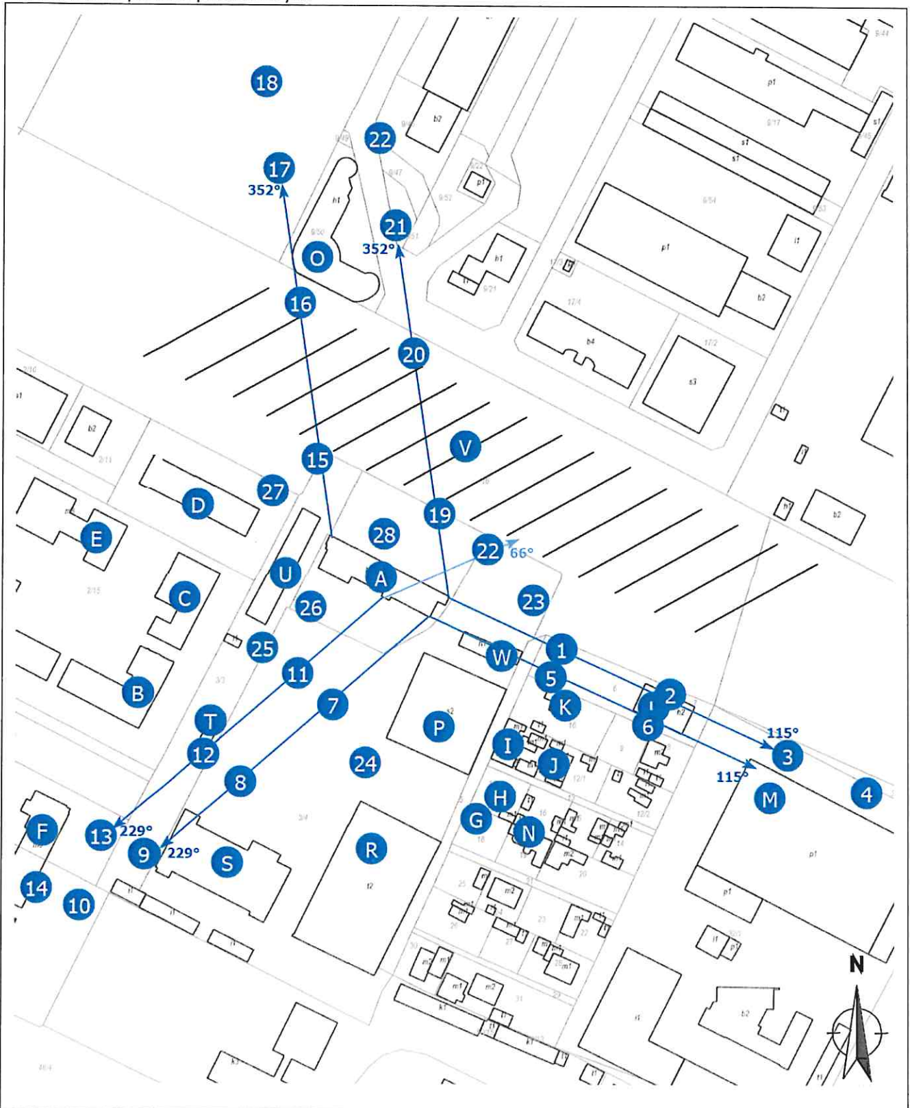
Zař. 2. Widok pionów pomiarowych