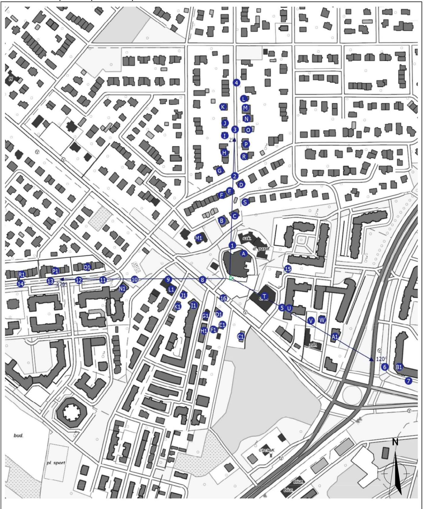
Zař. 2. Widok pionów pomiarowych