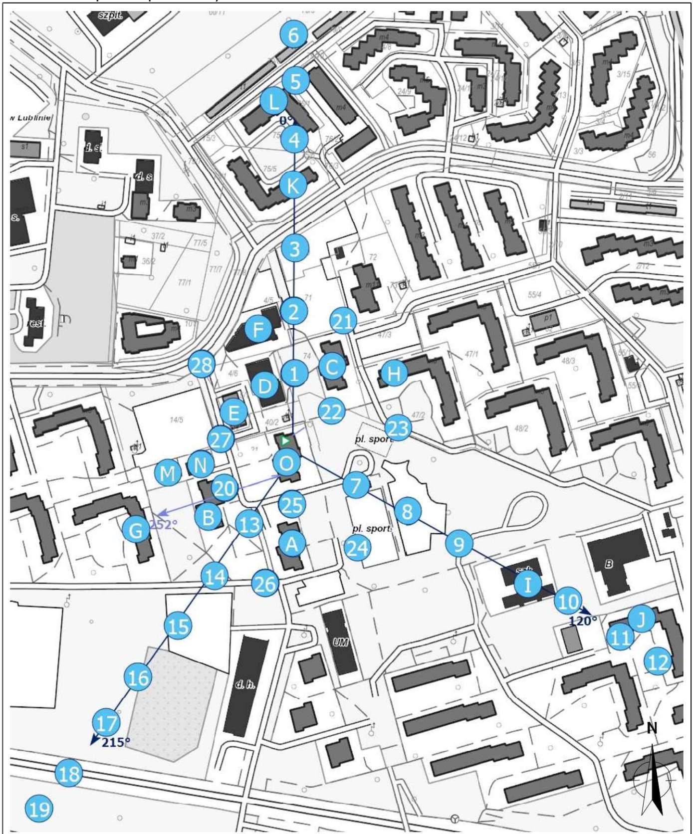
Załącznik 2. Widok pionów pomiarowych

LEGENDA: inna instalacja radiokomunikacyjna pion pomiarowy z poprawką pomiarową (brak innych instalacji radiokomunikacyjnych) pion pomiarowy z poprawką pomiarową (w zasięgu innych instalacji radiokomunikacyjnych) antena sektorowa antena radioliniowa brak dostępu Odległość, do której zostały wykonane pomiary mierząc od instalacji antenowej wynosi min.: 334 metrów.