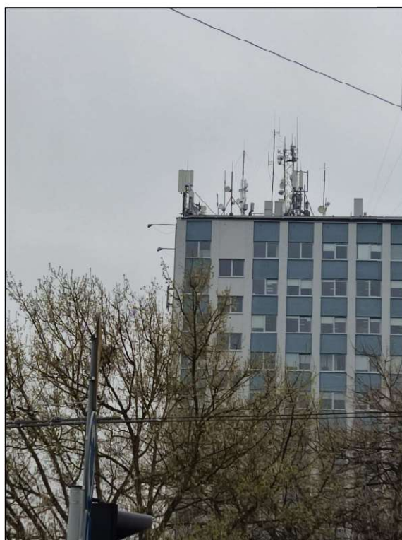
Rys. 4 Widok badanego obiektu