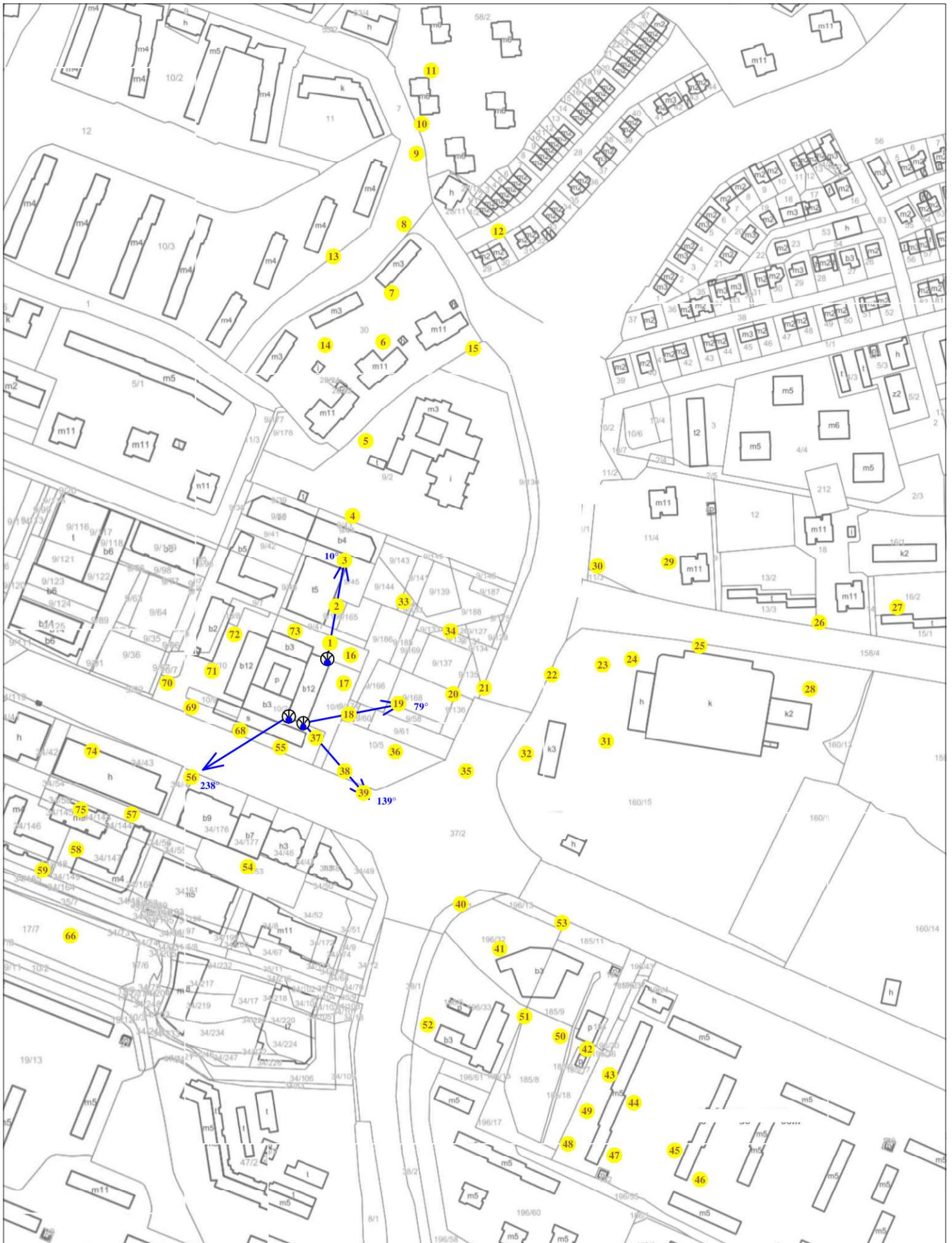
Rys. 2 Lokalizacja pionów pomiarowych

Legenda: brak dostępu antena radioliniowa źródło PEM pion pomiarowy antena sektorowa