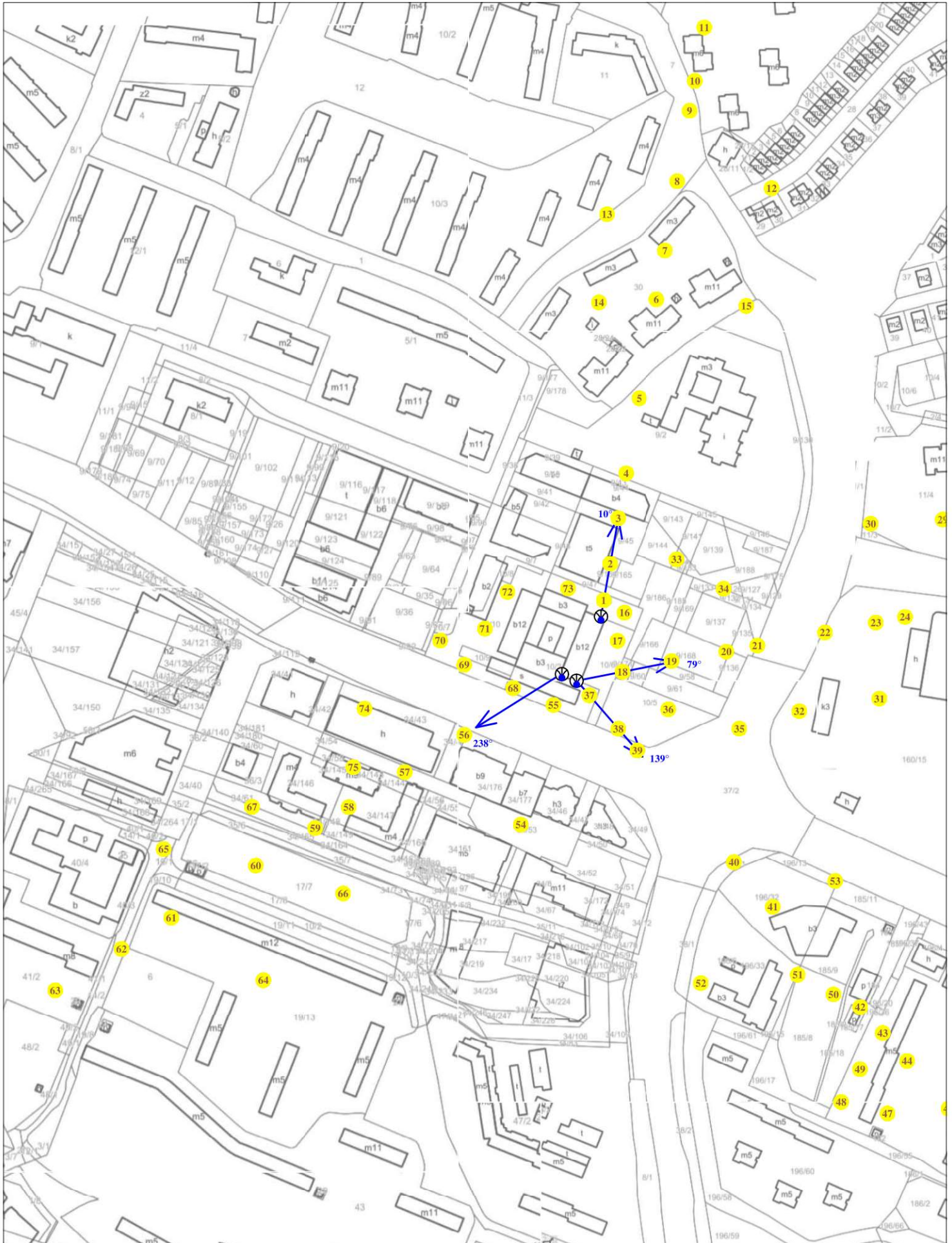
Rys. 3 Lokalizacja pionów pomiarowych