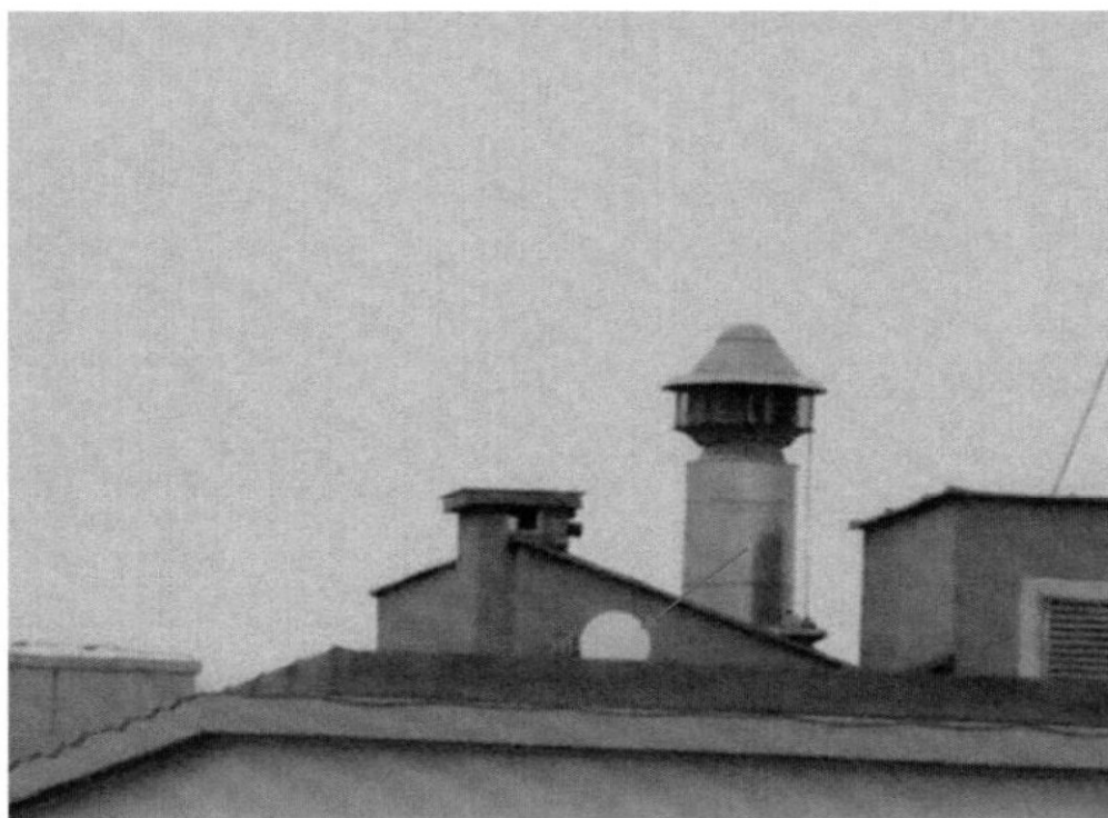
Widok instalacji radiokomunikacyjnej Stacja Netia LUBLB527 - LUBLM00274 Lublin, ul. Jana Pawła II 17.