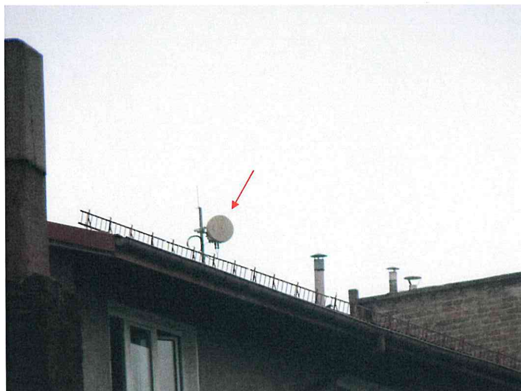
Widok instalacji radiokomunikacyjnej Stacja Netia LUBLB547 - LUBLM00278 Lublin, ul. Bartosza Głowackiego 13.