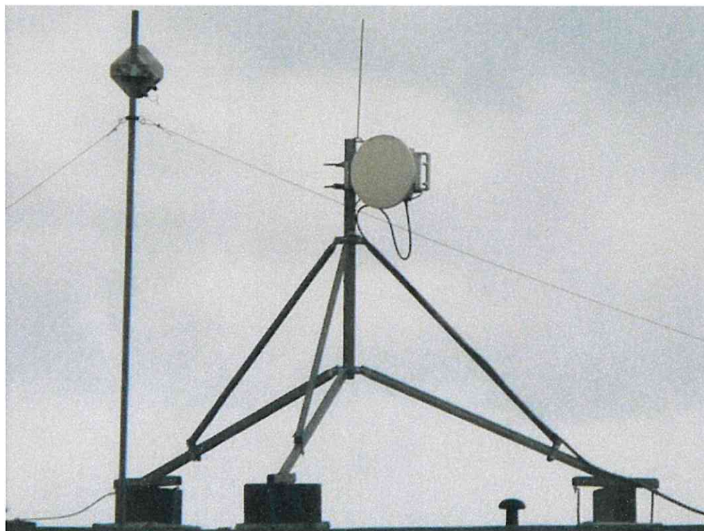
Widok instalacji radiokomunikacyjnej Stacja Netia LUBLB351 - LUBLM00257ANT003 Lublin, ul. Turystyczna 11A.