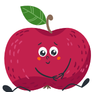
Ajentów sklepików szkolnych