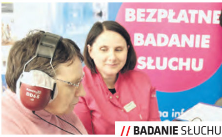
// BADANIE SŁUCHU

Na cały październik Miasto przygotowało bogatą ofertę warsztatów dla osób starszych,