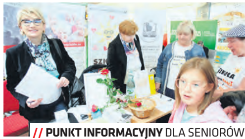
// PUNKT INFORMACYJNY DLA SENIORÓW