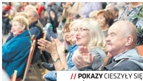
// POKAZY CIESZYLI SIĘ DUŻYM POWODZENIEM

które zachęcały do aktywnego spędzania czasu oraz rozwijania umiejętności i wiedzy. Skorzystać z niej mogły wszystkie osoby w wieku od 60 lat,