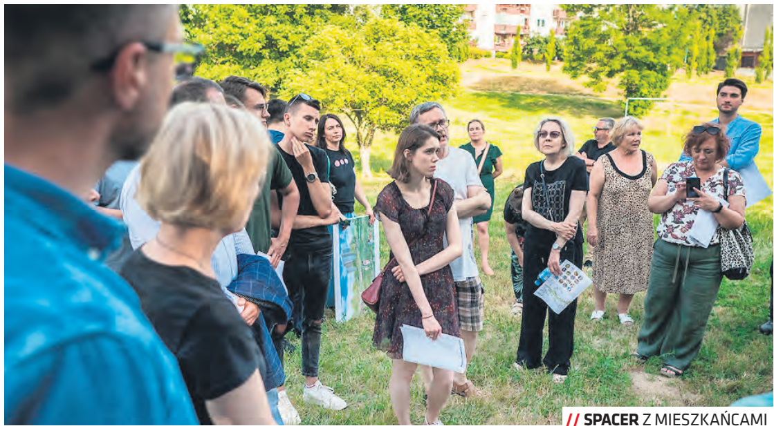
// SPACER Z MIESZKAŃCAMI

Polana Północna zaś to część terenów zielonych zlokalizowana powyżej al. Smorawińskiego, między budynkiem Urzędu Skarbowego a domem towarowym. W Strefie Street Artu, zlokalizowanej pod wiaduktem w al. Smorawińskiego,