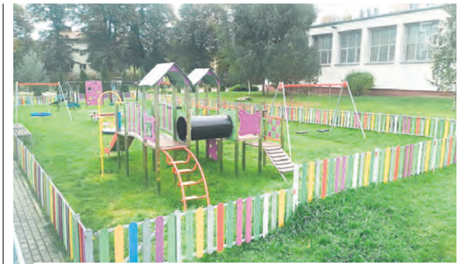
/// NOWY PLAC ZABAW PRZY SZKOLE PODSTAWOWEJ NR 1

Aktualnie na cmentarzu komunalnym, łącznie z cmentarzem przy ul. Białej, jest pochowanych około 69 tys. osób