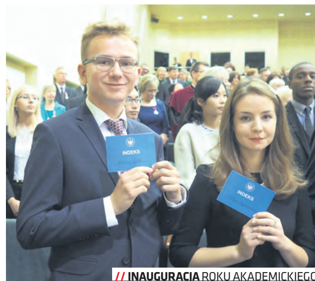
// INAUGURACJA ROKU AKADEMICKIEGO.

Najpopularniejszym kierunkiem tegorocznej rekrutacji na Uniwersytecie Marii Curie-Skłodowskiej była lingoistyka stosowana. Na Uniwersytecie Przyrodniczym najpopularniejsze są kie-