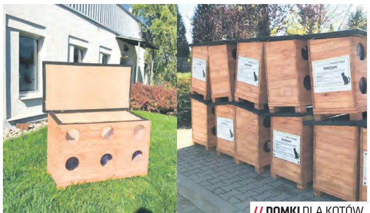
// DOMKI DLA KOTÓW.

Nowe drewniane kocie domki pojawiają się na terenie lubelskich osiedli mieszkaniowych. Schronienia posiadają ocieplone ścianki oraz uchylne dach, który ułatwia utrzymanie czystości wewnątrz. Każdy z domków