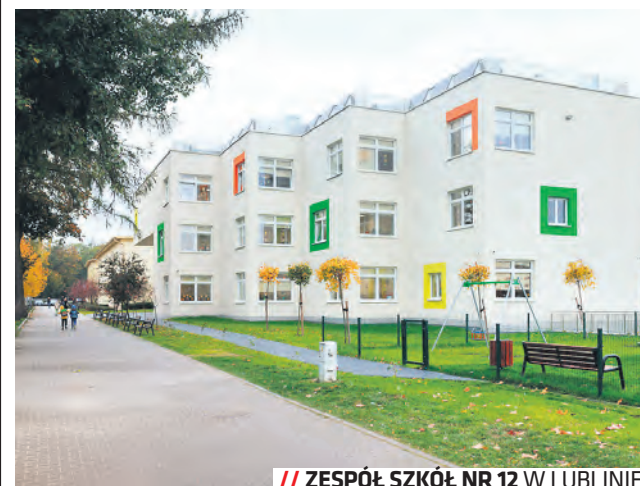
// ZESPÓŁ SZKÓŁ NR 12 W LUBLINIE

Zakończyła się rozbudowa Zespołu Szkół nr 12 na lubelskim Sławinie. Od września przedszkole dla ponad 300 dzieci ma nowe przestrzenie.