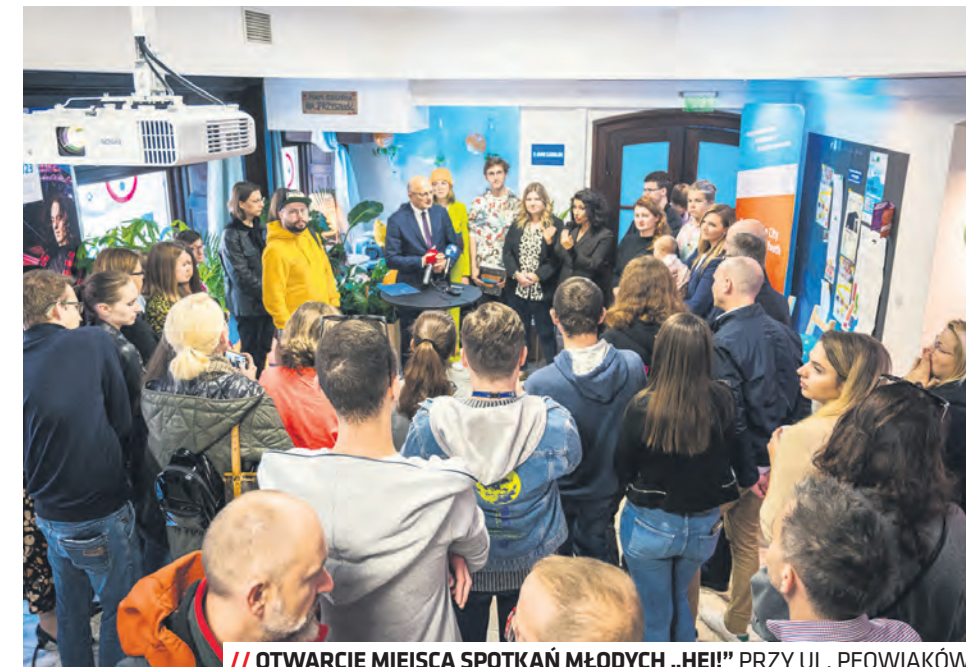
// OTWARCIE MIEJSCA SPOTKAŃ MŁODYCH „HEJ!” PRZY UL. PEOWIAKÓW

– Hej! to inicjatywa, która spełnia potrzeby młodych jako alternatywa dla spotkań w plenerze czy w lokalach komercyjnych. Jestem pewna, że będzie jednym z ulubionych miejsc młodzieżowych, pełnym wielu aktywności i spotkań – mówi