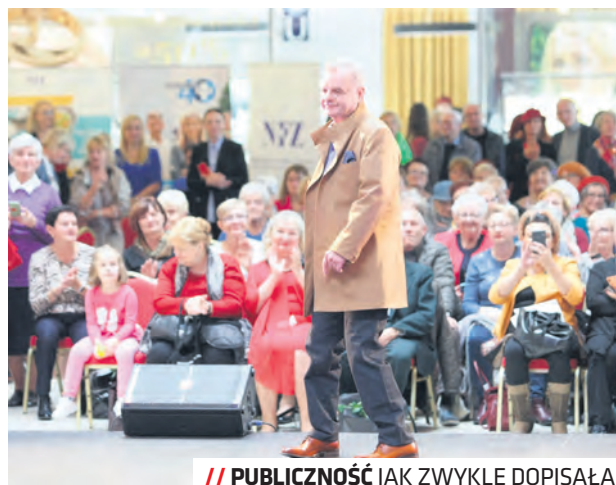
// PUBLICZNOŚĆ JAK ZWYKLE DOPISAŁA