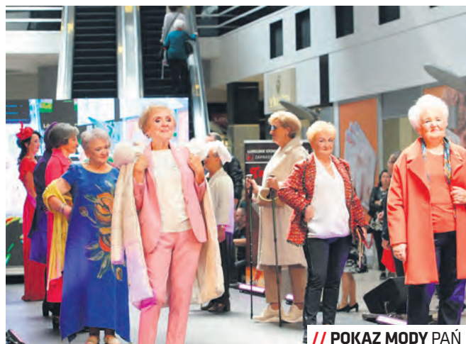
// POKAZ MODY PAŃ

Spilno Lublin jest efektem wspólnej pracy lubelskich organizacji pozarządowych. Wszystkie działania finansowane będą ze środków UNICEF-u. To miejsce stworzone specjalnie z myślą o potrzebach młodych osób z Ukrainy, ich polskich kolegów i koleżanek, a także rodziców i opiekunów. W specjalnie przygotowanej przestrzeni działają będzie system wsparcia, obejmujący między innymi aspekty psychologiczne, psychospołeczne czy prawne, a także szereg aktywności ułatwiających integrację i wspólne działania społeczności lokalnej. UNICEF, Miasto Lublin i organizacje pozarządowe tworzące Spilno Lublin pracować będą na rzecz włączenia społeczności polskiej i ukraińskiej w budowanie programu i oferty miejsca. Siedziba inicjatywy zlokalizowana będzie w hali Globus.