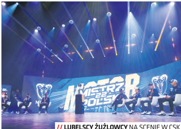
// LUBELSCY ŻUŻLOWCY NA SCENIE W CSK