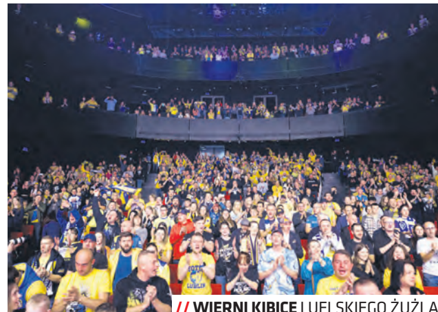
// WIERNI KIBICE LUBELSKIEGO ŻUŻLA