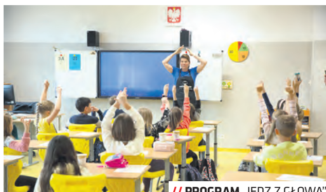
// PROGRAM „JEDZ Z GŁOWĄ”

Program „Jedz z głową” jest jednym z wielu działań podejmowanych przez Miasto Lublin na rzecz ochrony zdrowia i profilaktyki chorób wśród dzieci. Od 2015 roku realizowany jest program wczesnego wykrywania wad wzroku i zezów skierowany do uczniów klas II szkół podstawowych na terenie miasta. Od wielu lat uczniowie lubelskich szkół objęci są programem profilaktyki i próchnicy zębów. W tym roku Miasto przeznaczy na ten cel 660 tys. zł. W ramach działań