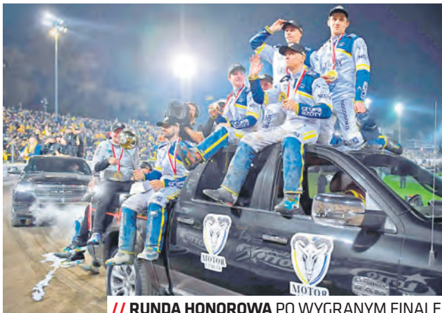
// RUNDA HONOROWA PO WYGRANYM FINALE