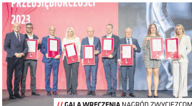
// GALA WRĘCZENIA NAGRÓD ZWYCIĘZCOM