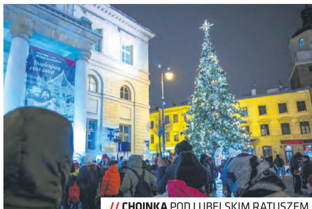
// CHOINKA POD LUBELSKIM RATUSZEM