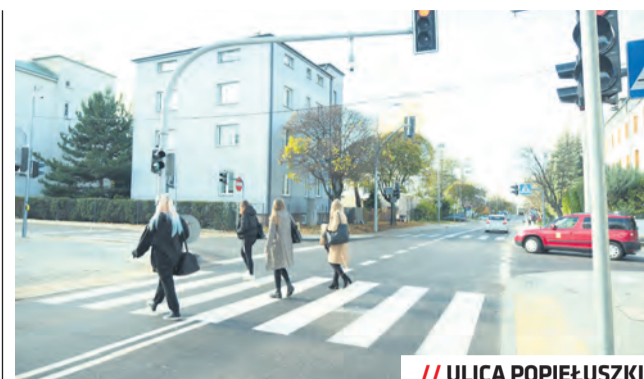
// ULICA POPIEŁUSZKI

Od stycznia tytułu Europejskiej Stolicy Młodzieży nosić będzie belgijska Gandawa.