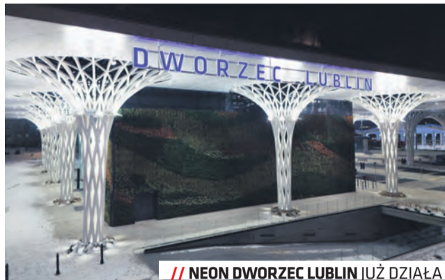
NEON DWORZEC LUBLIN JUŻ DZIAŁA

Wielofunkcyjny budynek główny Dworca Lublin wyróżnia się nie tylko niepowtarzalną architekturą, ale przede wszystkim zastosowaniem szeregu rozwiązań podyktowanych troską o środowisko. W obiekcie zainstalowano m.in. pompy ciepła, które mają dostarczyć energię potrzebną do ogrzania budynku. Zmniejszeniu zużycia energii ma służyć pomysł „budynku w budynku”, czyli otoczenia