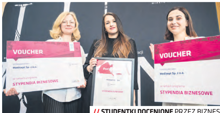
// STUDENTKI DOCENIONE PRZEZ BIZNES

– Dzięki wspólnej inicjatywie samorządu, biznesu i uczelni rozpoczynamy pilotażową edycję nowego programu. Lubelski biznes chce wspierać młodych. Gratuluję wszystkim laureatom i laureatkom oraz życzę sukcesów w zdobywaniu