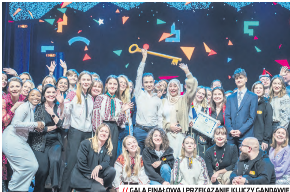
// GALA FINAŁOWA I PRZEKAZANIE KLUCZY GANDAWIE

W 2023 roku miasto wsparło finansowo ponad 1000 inicjatyw młodzieżowych w ramach programu Miasto Kultury, Dzielnice Kultury oraz Młodzież Inspiruje Miasto. Na terenie Lublina powstało 8 przestrzeni młodzieżowych, takich jak Hej!, Baza, ReWir, czy Kosmos, które odwiedziło do tej pory 10 tys. osób. Part-