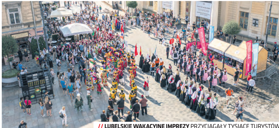
// LUBELSKIE WAKACYJNE IMPREZY PRZYCIĄGAŁY TYSIĄCE TURYSTÓW

W minionym sezonie turystycznym do Lublina przyjechało 434 tys. podróżnych z Polski, z czego 177 tys. stanowili odwiedzający jednodniowi, natomiast 257 tys. to turyści, czyli korzystający z noclegów. Spośród tych, którzy zdecydowali się na nocleg, aż 49% to osoby, które spędziły w naszym mieście od 2 do 4 nocy, 34% skorzystało z jednego