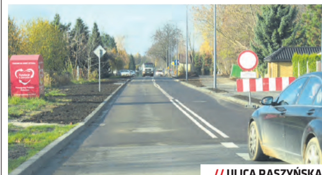
// ULICA RASZYŃSKA

Odbiory techniczne przeszła także ul. Popiełuszki, która na odcinku od ul. Junoszy do ul. Legionowej otrzymała nową nawierzchnię. Przebudowano także skrzyżowanie ul. Popiełuszki z ul. Głowackiego, a odnowioną sygnalizację świetlną włączono do Systemu Zarządzania Ruchem. Ulica zyskała nowoczesne oświetlenie. Zmiany objęły również infrastrukturę przystankową. Istniejący przystanek na wysokości Domu Pomocy Społecznej im. Matki Teresy z Kalkuty zmienił swoje miejsce i docelowo znajduje się za skrzyżowaniem z ul. Junoszy. Na przystankach pojawiły się nowe wiaty oraz punkty dynamicznej informacji pasażerskiej.