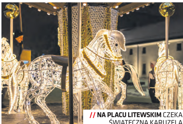
// NA PLACU LITEWSKIM CZEKA ŚWIĄTECZNA KARUZELA