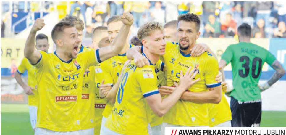
// AWANS PIŁKARZY MOTORU LUBLIN