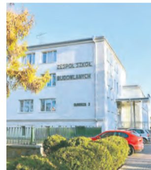
// ZESPÓŁ SZKÓŁ BUDOWLANYCH W LUBLINIE

Przy ZSB im. E. Kwiatkowskiego zostanie wykonana bieżnia lekkoatletyczna o długości 117 m z nawierzchnią poliuretanową. Obok będzie