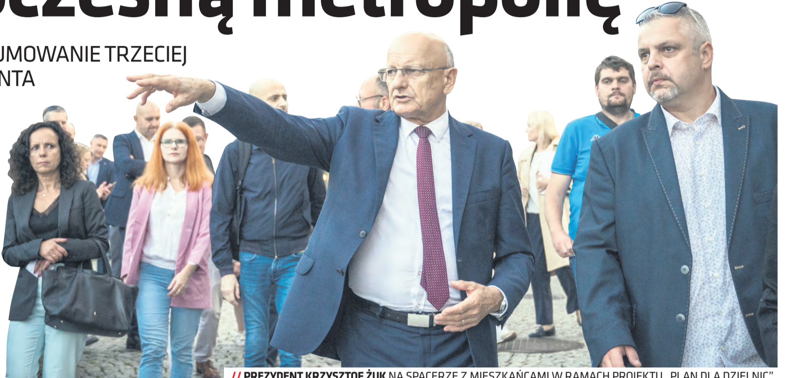
// PREZYDENT KRZYSZTOF ŻUK NA SPACERZE Z MIESZKAŃCAMI W RAMACH PROJEKTU „PLAN DLA DZIELNIC”

Przed miastem kolejne ważne inwestycje. Trwa projektowanie wielofunkcyjnego obiektu sportowo-rekreacyjnego z funkcją stadionu żużlowego na 18,5 tys. widzów, który poza funkcją sportową ma służyć również do organizacji koncertów, targów oraz pokazów. W trakcie projektowania jest także m.in. Centrum Sztuki Dzieci i Młodzieży przy ul. Kunickiego. Finalizowane jest postępowanie na wybór wykonawcy budowy przedłużenia ul. Węglarza oraz rozbudowy ul. Wallenroda. W toku jest przetarg na przebudowę kładki dla pieszych nad ul. Filaretów. Trwa też opracowanie kompletnej dokumentacji projektowej na przebudowę ul. Zana oraz na budowę węzła przesiadkowego przy przystanku PKP Lublin Ponikwoda.