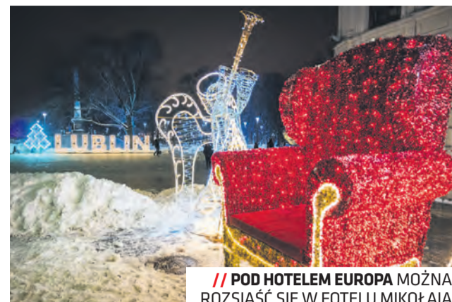
// POD HOTELEM EUROPA MOŻNA ROZSIĄĆ SIĘ W FOTELU MIKOŁAJA