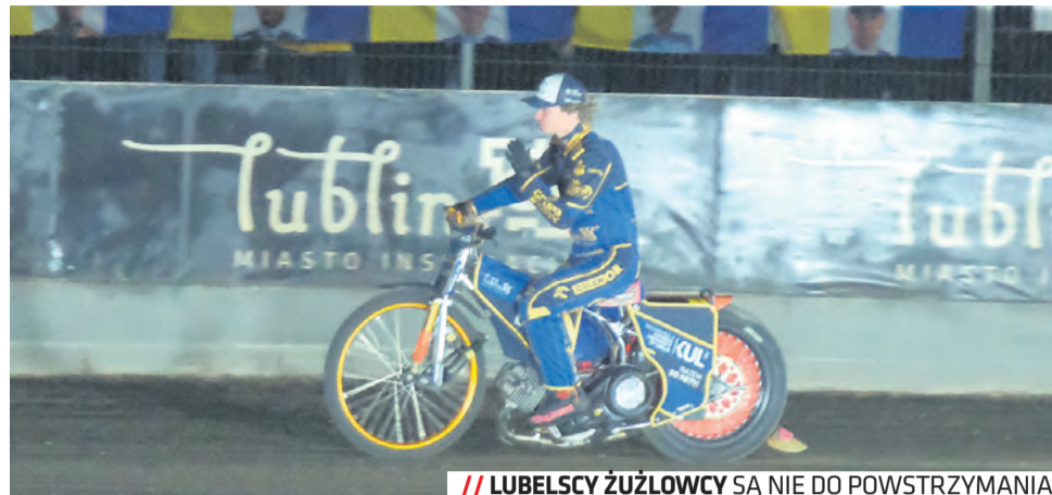
// LUBELSCY ŻUŻLOWCY SĄ NIE DO POWSTRZYMANIA