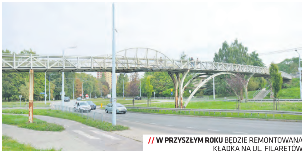
// W PRZYSZŁYM ROKU BĘDZIE REMONTOWANA KŁADKA NA UL. FILARETÓW