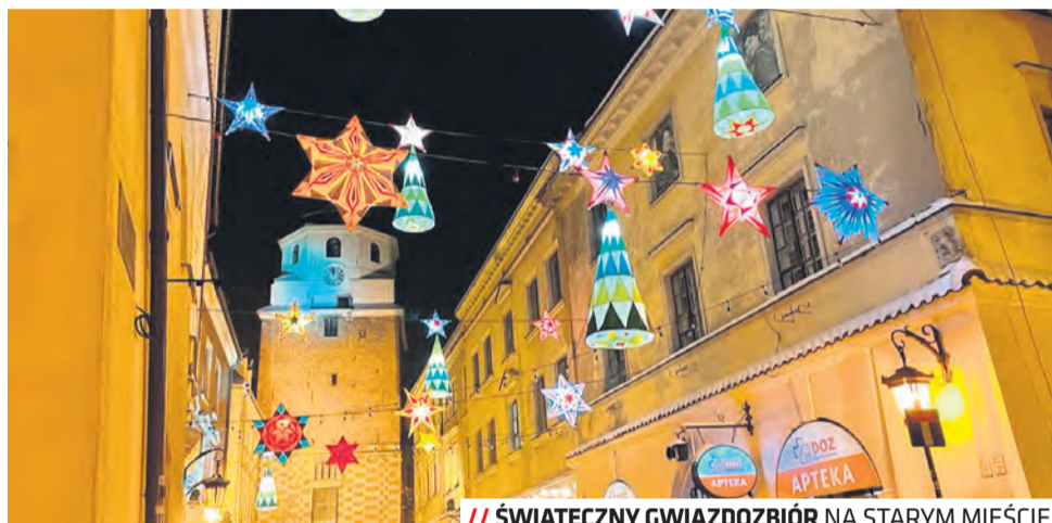
// ŚWIĄTECZNY GWIAZDOZBIÓR NA STARYM MIEŚCIE

Na 17 grudnia w Warsztatach Kultury zaplanowano Sprawunki – Targi Rzeczy