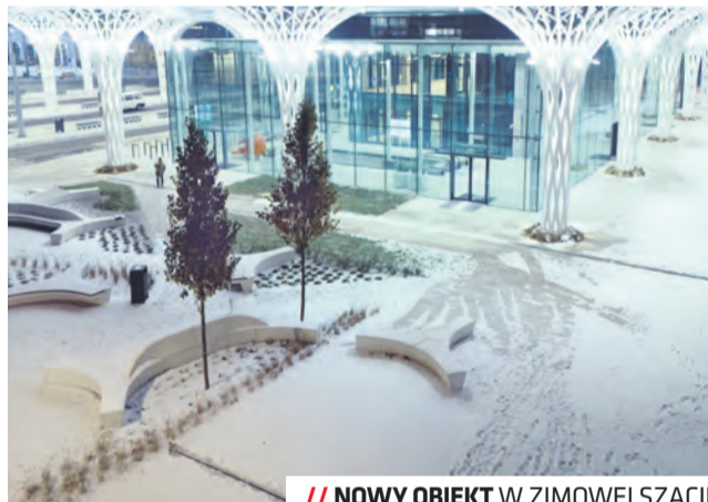
NOWY OBIEKT W ZIMOWEJ SZACIE

hali głównej dworca szklaną ścianą o niskim współczynniku przenikania ciepła. Dach nad stanowiskami autobusowymi pokryty jest panelami fotowoltaicznymi. Natomiast część dachu budynku będzie pełnić funkcję użytkową. Znajdzie się tam m.in. plac zabaw, ale, co ważne, również nasadzenia zieleni, głównie gatunkami roślin szczególnie wydajnych w oczyszczaniu powietrza. Kolejnym rozwiązaniem jest zastosowanie antysmogowej kostki brukowej. Pod budynkiem został zlokalizowany garaż podziemny dla