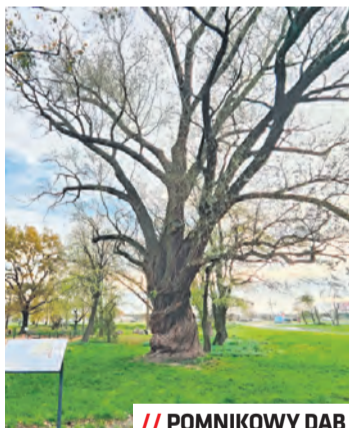
// POMNIKOWY DĄB

– Pomniki przyrody odgrywają znaczącą rolę w łagodzeniu skutków zmian klimatu oraz są domem