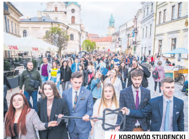
// KOROWÓD STUDENCKI

Lubelscy studenci połączyli w tym roku siły i wspólnie zorganizowali w maju Lublinalia 2023. Był korowód i koncerty. Dni Kultury Studenckiej wsparły miejskie instytucje.