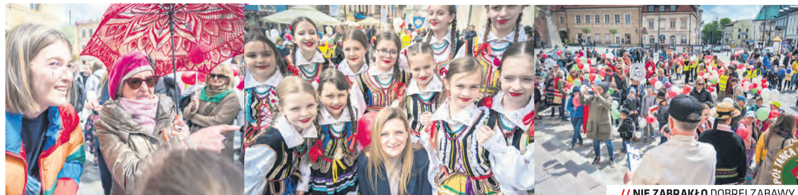
/// NIE ZABRAKŁO DOBREJ ZABAWY

Celem konkursu Top Inwestycji Komunalne, organizowanego przez Polskie Towarzystwo Wspierania Przedsiębiorczości, było wskazanie skali inwestycji komunalnych oraz ich znaczenia dla gospodarki, regionu i mieszkańców.