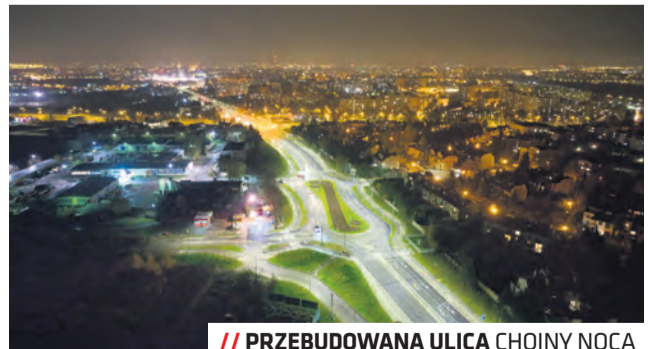
/// PRZEBUDOWANA ULICA CHOINY NOCĄ

Lublin został nagrodzony w konkursie Top Inwestycji Komunalne 2023 za projekt unijny obejmujący m.in. przebudowę ul. Choiny, budowę petli i pierwszego w mieście parkingu typu Park & Ride.