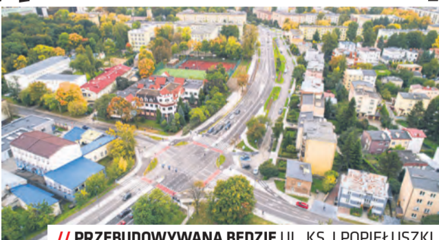
/// PRZEBUDOWYWANA BĘDZIE UL. K.S. J. POPIELUSZKI

Przez całe wakacje przebudowana będzie ul. Popiełuszki. Ważne tegoroczne inwestycje dotyczą także dzielnicy Felin. Ruszyć ma również budowa przedłużenia ul. Lubelskiego Lipca '80.