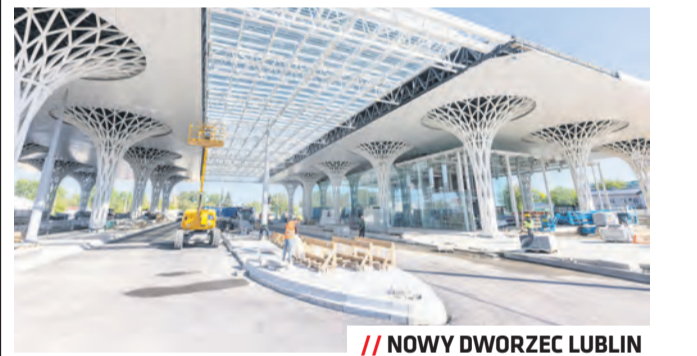
// NOWY DWORZEC LUBLIN

Prace objęły również przebudowę m.in. ulic: Dworcowej, Młyńskiej, 1 Maja, Pocztowej oraz Gazowej oraz budowę nowych zjazdów.