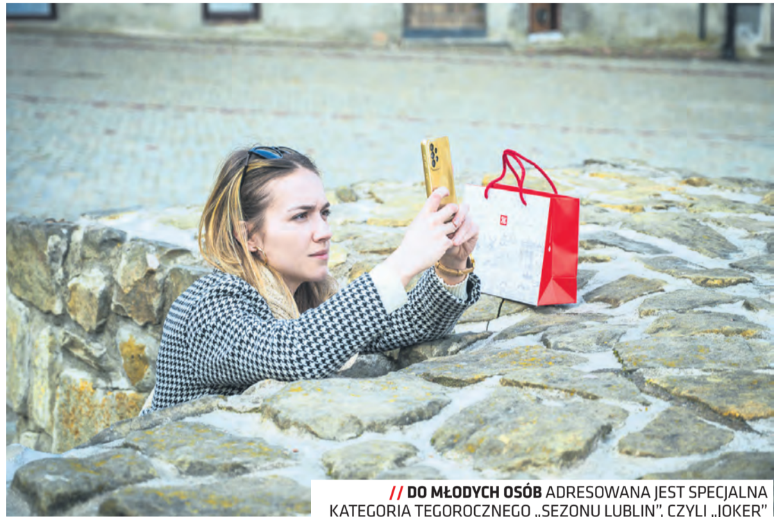
// DO MŁODYCH OSÓB ADRESOWANA JEST SPECJALNA KATEGORIA TEGOROCZNEGO „SEZONU LUBLIN”, CZYLI „JOKER”

– Sezon Lublin 2023 to prawie sto różnorodnych atrakcji. Z pew-