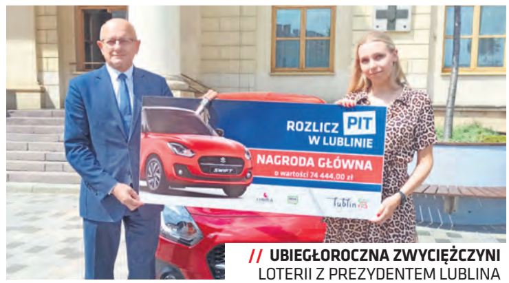
// UBIĘGOROCZNA ZWYCIĘŹCZYNI LOTERII Z PREZYDENTEM LUBLINA

– Co roku zachęcamy do rozliczania podatku dochodowego w Lublinie. To konkretne wsparcie finansowe dla miasta, ale i możliwość udziału w loterii z szansą na wygranie cennych nagród, w tym samochodu o napędzie hybrydowym. Bardzo nas cieszy rosnące i rekordowe zainteresowanie