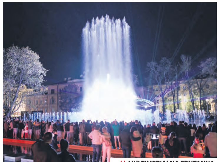
// MULTIMEDIALNA FONTANNA

Widowisko „Lublin is YOUTH” w całości poświęcone jest młodości. Oповіда o poszukiwaniu przez młodych