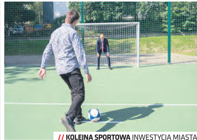
// KOLEJNA SPORTOWA INWESTYCJA MIASTA

W ekipie pozostaną w przyszłym roku Bartosz Zmarzlik, Fredrik Lindgren i Jack Holder. W takim składzie Motor Lublin w 2024 roku ponownie będzie zdecydowanym faworytem do zdobycia tytułu mistrza Polski.