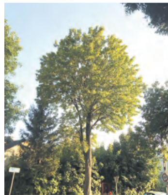
// PIELEGNACJA WYSOKICH DRZEW TO DUŻE WYZWANIE