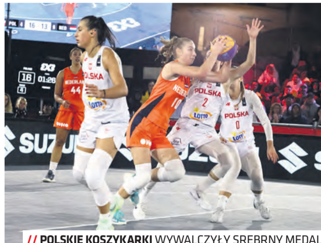
// POLSKIE KOSZYKARKI WYWALCZYŁY SREBRNY MEDAL

Za to wielką historię napisały w tym turnieju panie! Po wygranych meczach z Grecją i Tunezją niespodziewana porażka z Litwą i wyniki innych meczów sprawiły, że w kończącej fazę grupową meczu z Niemkami Polki musiały wygrać i to różnicą pięciu