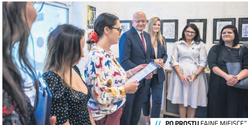
// „PO PROSTU FAJNE MIEJSCE”

Miasto wyda w przyszłym roku kalendarz z okazji Europejskiej Stolicy Młodzi Lublin 2023. Ogłoszony został konkurs na grafikę, adresowany do młodzi szkół ponadpodstawowych oraz osób dorosłych do 30. roku życia. Tematem prac konkursowych był Lublin. Spośród przesłanych prac Komisja Konkursowa wybrała finałową trzydziestkę, a wśród niej 11 najlepszych, które zostaną umieszczone na miesięcznych kartach w kalendarzu. Wyboru ostatniej, dwunastej grafiki dokonali internauci podczas głosowania na profilu Miasta Lublin na portalu społecznościowym Facebook. Dla autorów 3 najlepiej ocenionych grafik oraz autora pracy wybranej przez internautów przewidziano nagrody pieniężne o wartości od 1 tys. zł do 2 tys. zł.