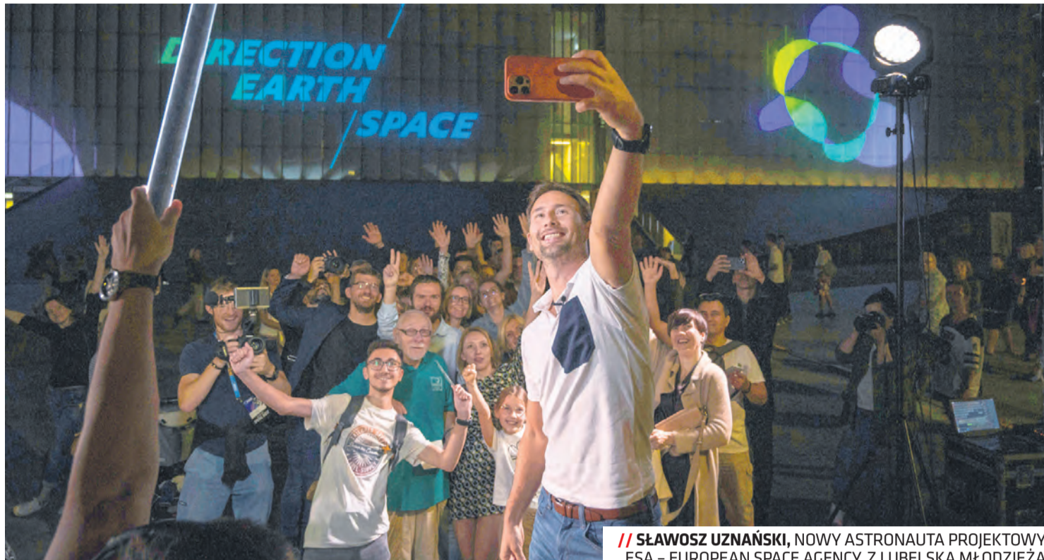
// SŁAWOSZ UZNAŃSKI, NOWY ASTRONAUTA PROJEKTOWY ESA – EUROPEAN SPACE AGENCY, Z LUBELSKĄ MŁODZIEŻĄ

Informator miejski | WYDAWCA: Urząd Miasta Lublin, 20-109 Lublin, pl. Króla Władysława Łokietka 1 REDAKCJA: Kancelaria Prezydenta Miasta Lublin email: informator@lublin.eu | tel. 81 466 19 16 NAKŁAD: 150 000 egzemplarzy | DRUK: Polska Press Grupa, Oddział Poligrafia, Drukarnia w Sosnowcu