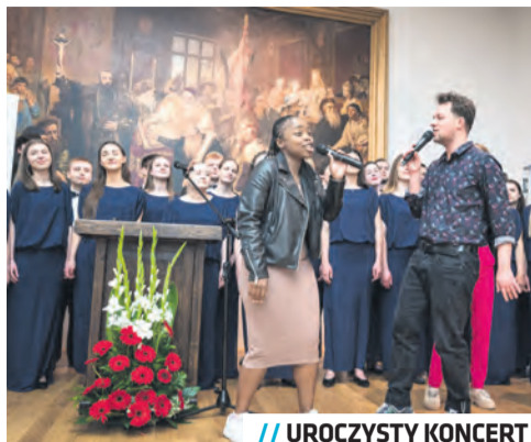
// UROCZYSTY KONCERT