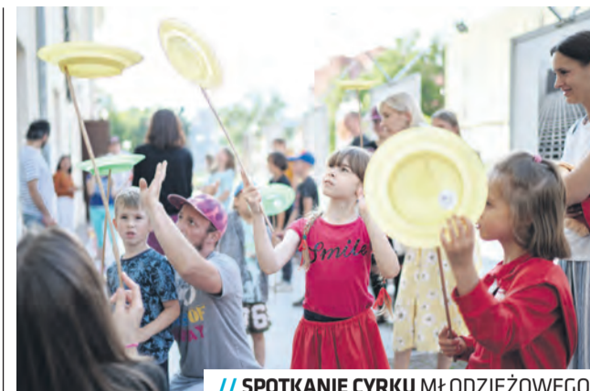
// SPOTKANIE CYRKU MŁODZIEŻOWEGO

Fundacja Sempre a Frente od trzynastu lat zajmuje się wsparciem zdrowia psychicznego dzieci i młodzieży. Otwarte we wrześniu zeszłego roku jedyne w województwie Centrum Pomocy Dzieciom w Lublinie jest szóstą taką placówką w Polsce. Od początku otrzymało wsparcie Europejskiej Stolicy Młodzieży Lublin 2023 oraz największej organizacji działającej na rzecz dzieci krzywdzonych w kraju – Fundacji Dajemy Dzieciom Siłę i przynależy do koordynowanej przez nią sieci Centrów Pomocy Dzieciom w Polsce. ZCPD można się skontaktować za pomocą e-mail: cpd@sempre.org.pl lub pod numerem tel. 690 080 886.