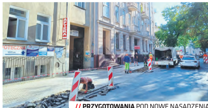
// PRZYGOTOWANIA POD NOWE NASADZENIA

Prace brukarskie objęły usunięcie części kostki z istniejącego chodnika. W październiku ruszą nasadzenia drzew i krzewów – docelowo trafi tam 7 lip drobnolistnych „Greenspire” oraz