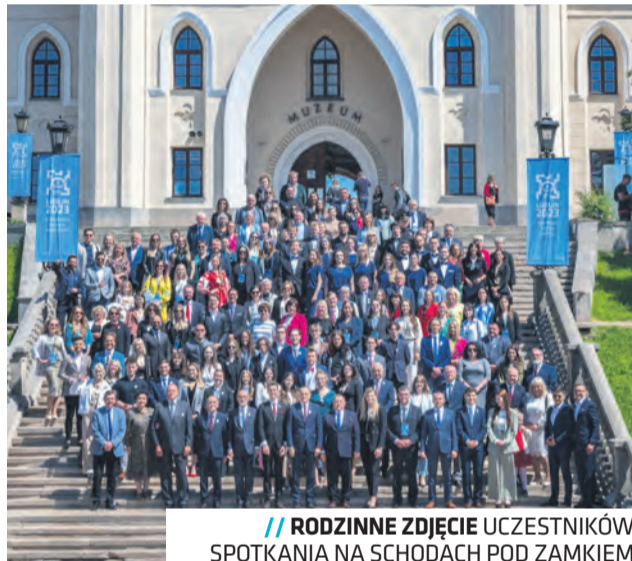
// RODZINNE ZDJĘCIE UCZESTNIKÓW SPOTKANIA NA SCHODACH POD ZAMKIEM

Największym tegorocznym wyzwaniem było sprostanie celom, jakie stawiał otrzymany tytuł ESM. Młodzi radni zaangażowali się w realizację wielu projektów oraz nowych pomysłów i przedsięwzięć. Jedną z najważniejszych inicjatyw