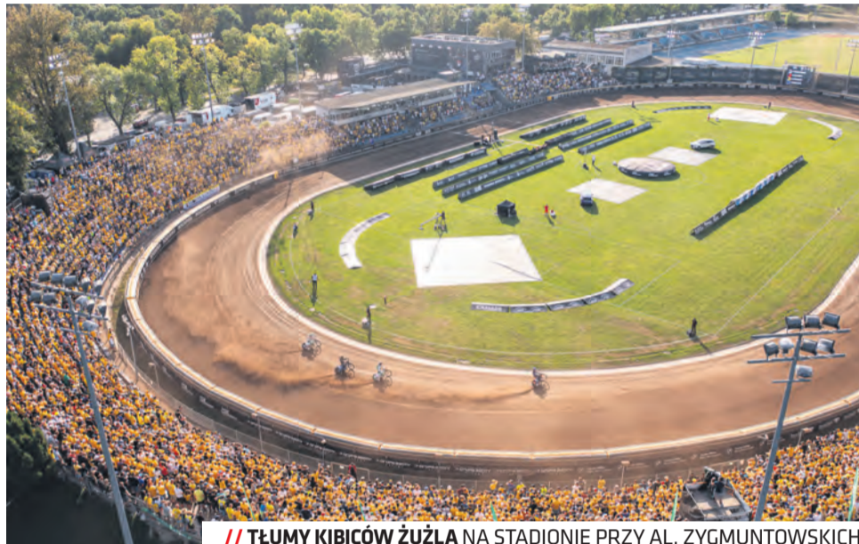
// TŁUMY KIBICÓW ŻUŻLA NA STADIONIE PRZY AL. ZYGMUNTOWSKICH

Być może po pierwszym meczu finałowym w Lublinie, który Motor wygrał „tylko” 51:39, kibice „czarnego sportu” zastanawiali się, czy Motor obroni punktową zaliczkę we Wrocławiu. Na lubelskim torze Sparta wystąpiła bardzo osłabiona brakiem Taia Woffindena i Macieja Janowskiego, a mimo to przegrała „jedynie” 12 punktami. Zdarzały się już takie żużlowe dwumecze, w którym przegrana ekipa potrafiła w rewanżu odrobić takie straty. Żeby nie szukać daleko, warto przywołać historię Motoru z 2018 roku, gdy w finale baraży o awans do Ekstraligi lubelski zespół pokonał ostatecznie ROW Rybnik i rok temu, gdy w finale Ekstraligi najpierw przegrał 12 punktami w Gorzowie Wielkopolskim, by potem wygrać wyżej na stadionie przy Alejach