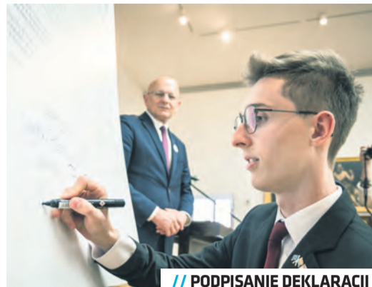
// PODPISANIE DEKLARACJI

Miejski Aktywator Młodzieżowy (MAM) to realizowany w ramach obchodów ESM 2023 program mikrograntów na działania społeczne i obywatelskie dla nieformalnych grup młodzieżowych (w przedziale od 10 do 30 lat). W jego ramach ma zostać udzielonych minimum 20 grantów finansowych. Młodzież chcąc zrealizować swój pomysł będzie otoczona wsparciem merytorycznym, logistycznym i finansowym.