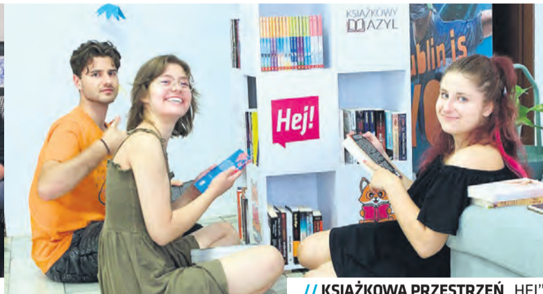
// KSIĄŻKOWA PRZESTRZEŃ „HEJ”