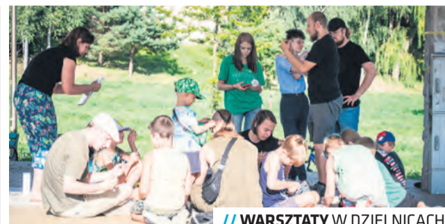
// WARSZTATY W DZIELNICACH

SBO. Szkoły pracują na warsztatach z zakresu budowania Szkolnych Zespołów Roboczych, zarządzania ich pracą w kontekście partycypacyjnego włączania społeczności szkolnej do działania, pisania regulaminu SBO oraz mapowania potrzeb.