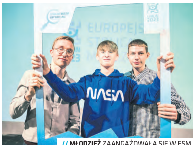
// MŁODZIEŻ ZAANGAŻOWAŁA SIĘ W ESM