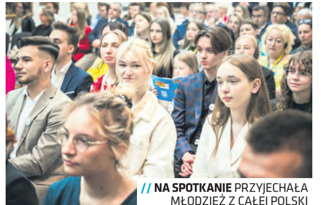
// NA SPOTKANIU PRZYJECHAŁA MŁODZIEŻ Z CAŁEJ POLSKI