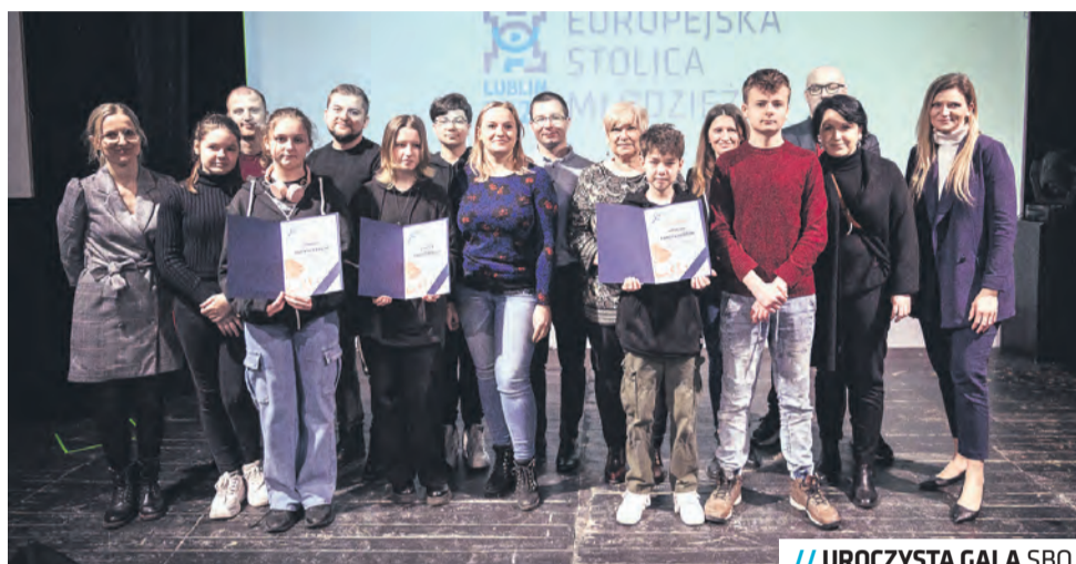
// UROCZYSTA GALA SBO

SBO to także dawka wiedzy o szkolnych finansach i społeczeństwie, nauka przedsiębiorczości, co najważniejsze, wszystko odbywa się w praktyce, a nie jak zazwyczaj za szkolną ławką. Uczniowie i uczennice, którzy współdecydują o szkole, w większym stopniu identyfikują się z jej przestrzenią i mają