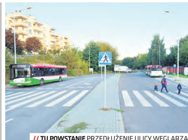
// TU POWSTANIE PRZEDŁUŻENIE ULICY WĘGLARZA

łączą największe osiedla ze Śródmieściem. Do obsługi komunikacyjnej zostaną włączone nowe ulice: Żelwerowicza, Królowej Bony, Zygmunta Augusta, Dunikowskiego, Wyścigowa, Zachodnia i część Głębokiej. Pojawią się także nowe połączenia bezpośrednie, np. Bohaterów Września – Dworzec Główny PKP, Koncertowa – Choiny, Chodźki, pl. Litewski. W całym mieście ma wzrosnąć częstotliwość kursowania komunikacji w porach o największym zapotrzebowaniu na przewozy – w szczytach 24 linie co kwadrans.