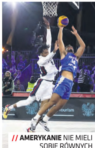
// AMERYKANIE NIE MIELI SOBIE RÓWNYCH

Tym razem Polacy w pierwszym meczu przegrali z drużyną Beninu, a potem ulegli także Francji i Austrii. Zwycięstwo w ostatnim meczu z Rumunią nic już nie dawało i reprezen-