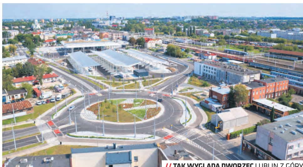
// TAK WYGLĄDA DWORZEC LUBLIN Z GÓRY

Najważniejszym celem nowej siatki jest zwiększenie zarówno dostępności, jak i częstotliwości kursowania komunikacji miejskiej, co z jednej strony zaspokoi oczekiwania pasażerów, a z drugiej – zauważalnie przełoży się na poprawę komfortu podróży autobusami i trolej-