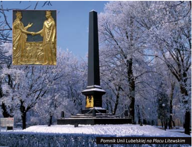
Pomnik Unii Lubelskiej na Placu Litewskim