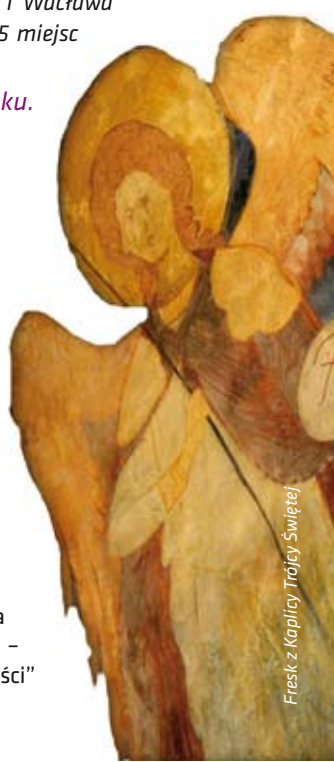
Fresk z Kaplicy Trójcy Świętej

w estońskim Tallinie oraz dwa miejsca w Holandii: Pałacowi Pokoju w Hadze, w którym mieści się siedziba Międzynarodowego Trybunału Sprawiedliwości oraz nazistowski obozowi przejściowemu z drugiej wojny światowej Westerbork, znajdującemu się w Hooghalen na północnym wschodzie kraju. W naborze 2014 r. państwa uprawnione do składania propozycji, przekazały do Komisji Europejskiej ogółem 36 kandydatur. Europejski panel ekspertów zarekomendował przyznanie Znak 16 kandydaturom, przy czym Polska jest jedynym krajem UE, który uzyskał aż trzy nominacje (Konstytucja 3 Maja 1791, Historyczna Stocznia Gdańska – obiekty związane z postaniem „Solidarności” oraz Unia Lubelska).