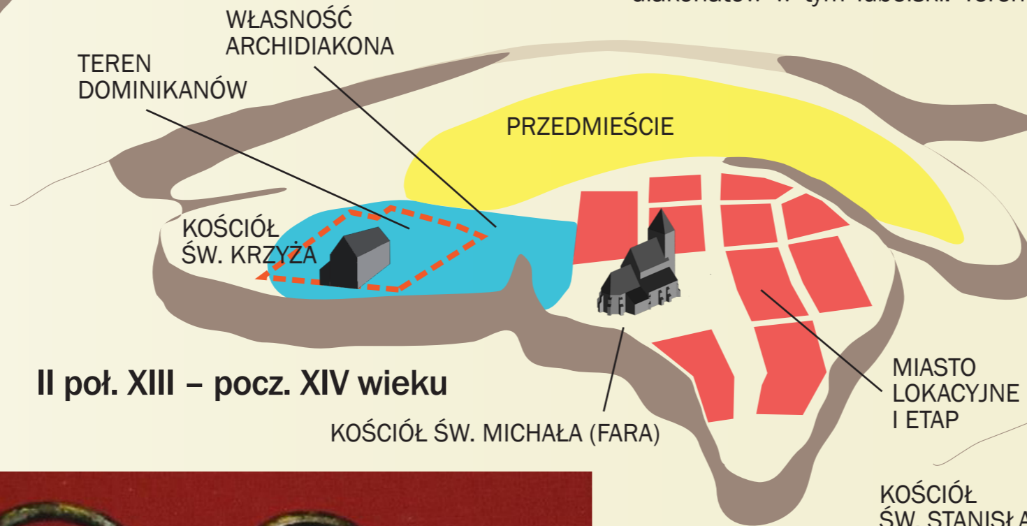
II poł. XIII – pocz. XIV wieku