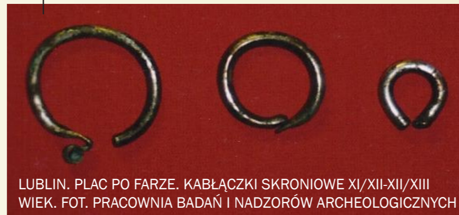
LUBLIN. PLAC PO FARZE. KABŁĄCZKI SKRONIOWE XI/XII-XII/XIII WIEK.