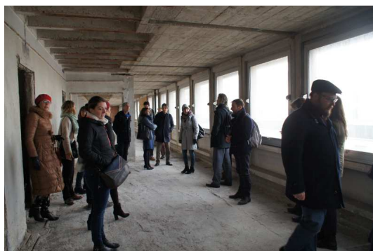
Wizyta studyjna w obiekcie wskazanym do projektu przez Miasto Bruksela - ARLON 104.