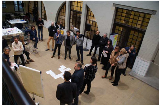
Wystąpienia lubelskiej delegacji w drugim dniu spotkania.