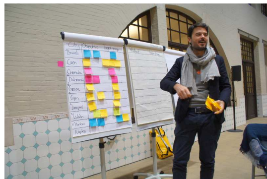
Warsztaty poświęcone aktywnościom lokalnych grup wsparcia poszczególnych partnerów.