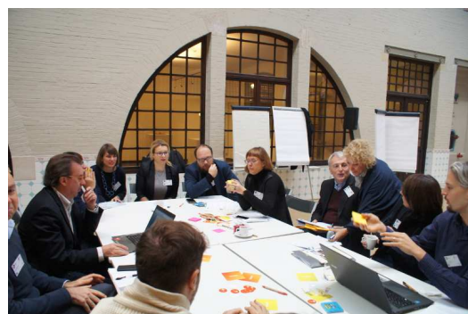
Przedstawiciele lubelskiej delegacji podczas prezentacji i warsztatów w pierwszym dniu spotkania.