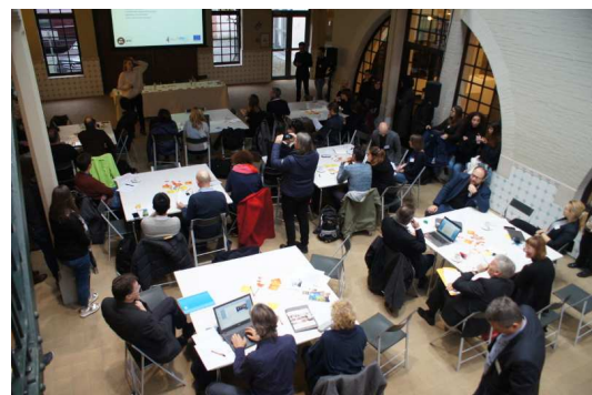
Pierwszy dzień spotkania projektowego w Brukseli.