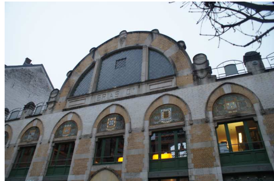
Les Ateliers des Tanneurs – dawny skład i rozlewnia wina, w którym odbywało się spotkanie.