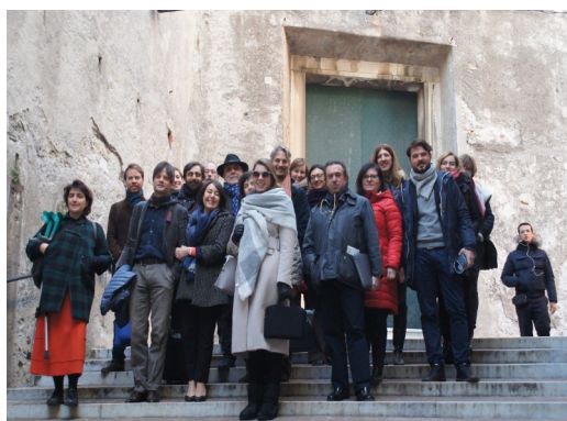
Zdjęcie grupowe uczestników spotkania.