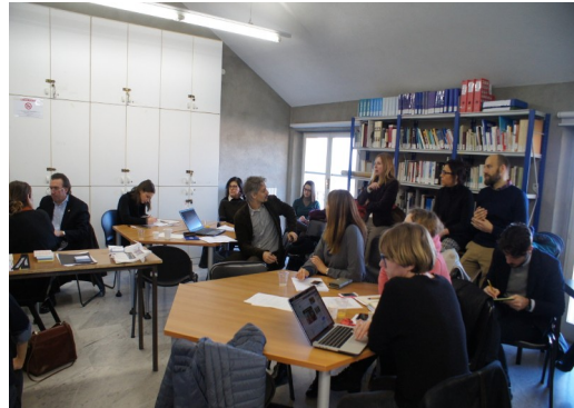
Zdjęcia z pierwszego dnia obrad, w salach Wydziału Architektury Uniwersytetu w Genui.