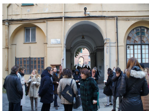
Uczestnicy konferencji przed wejściem do koszar Ex Caserma Gavoglio.