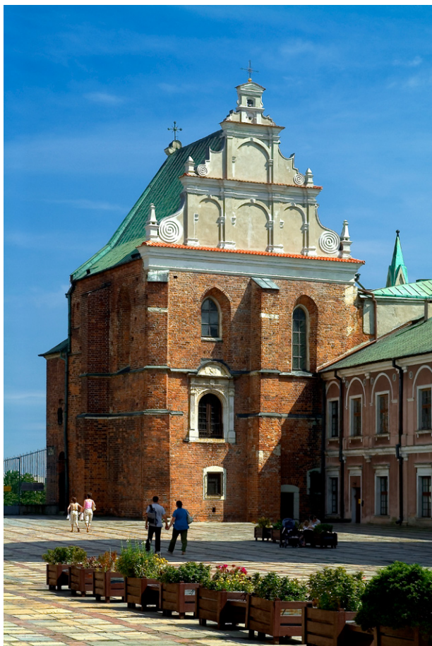
Kaplica Św. Trójcy