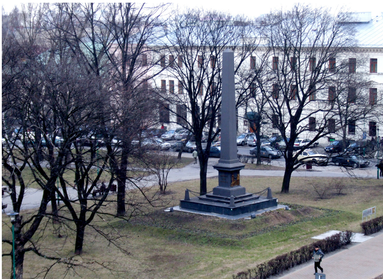
Pomnik Unii Lubelskiej