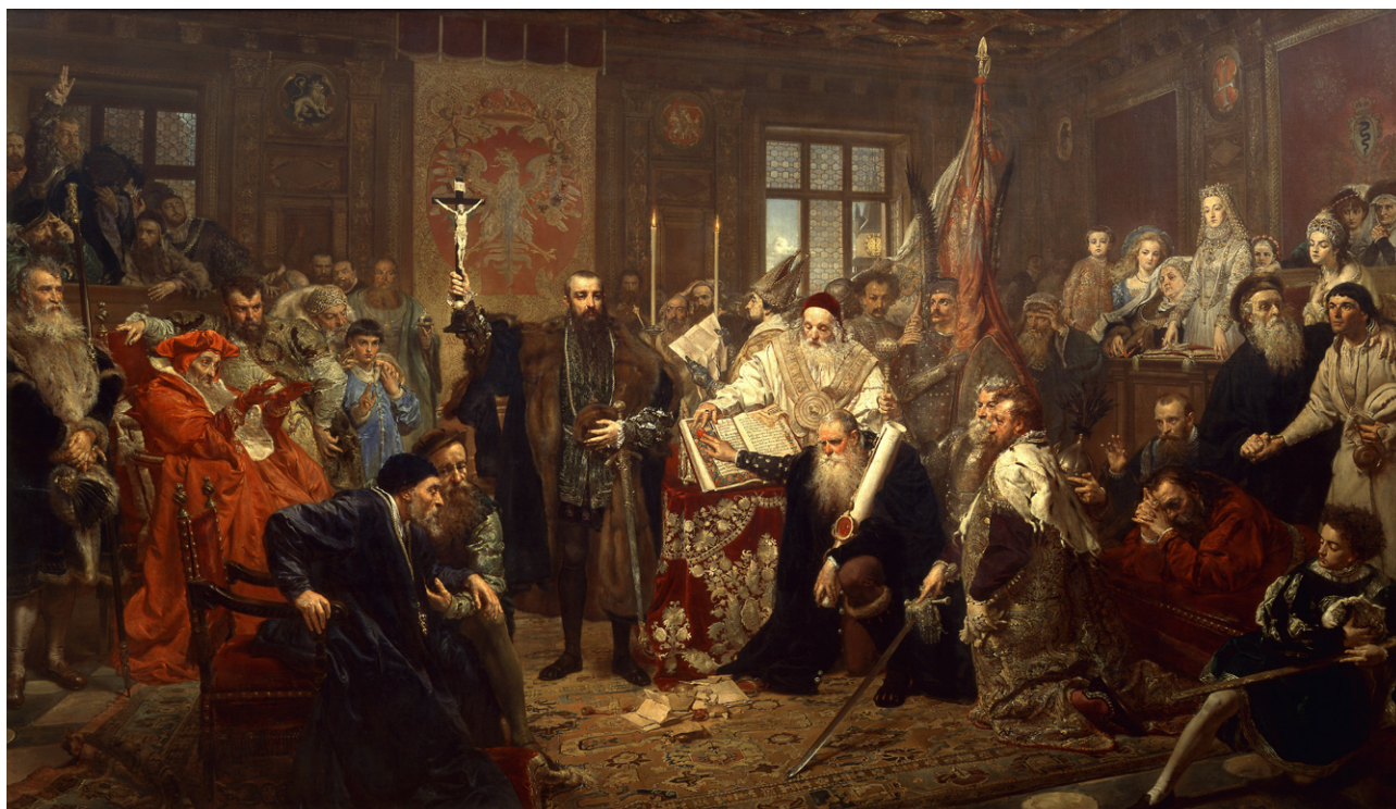
Unia Lubelska - obraz Jana Matejki przechowywany na zamku w Lublinie

Zygmunta Augusta - króla Polski i wielkiego księcia Litwy. Istniejący klasycystyczny obelisk powstał w 1824 roku na miejscu poprzedniego. Płaskorzeźba na pomniku przedstawia alegorię Unii pod postacią dwóch kobiet symbolizujących Polskę i Litwę, podających sobie dłonie. Napis na płycie informuje o połączeniu Litwy z Koroną.