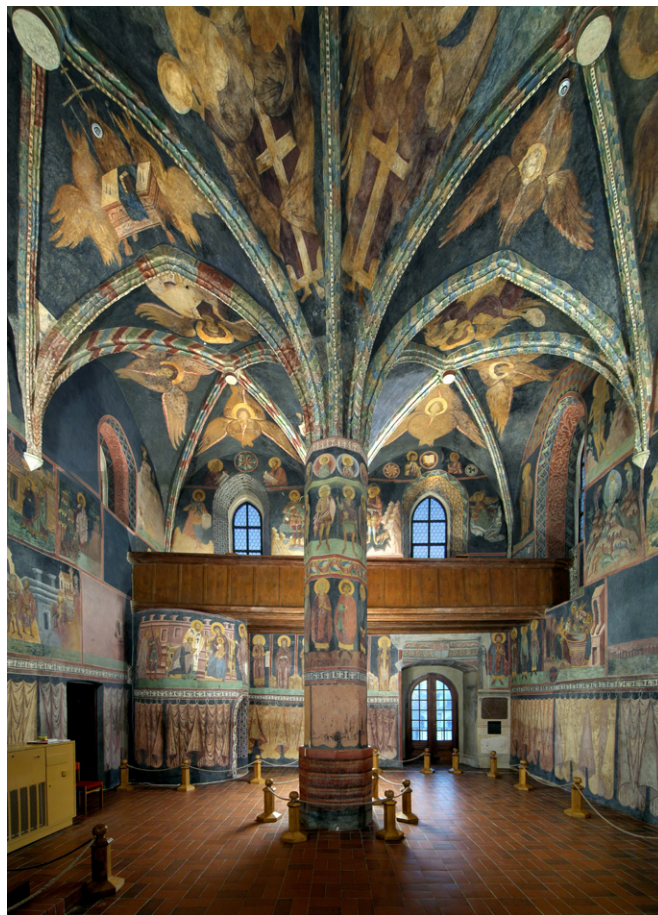
Kaplica Św. Trójcy, wnętrze