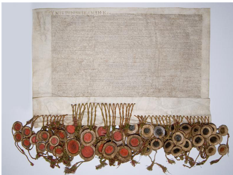
Tekst aktu Unii Lubelskiej, oryginał w Archiwum Państwowym w Lublinie.

Pomnik Unii Lubelskiej powstał w 1569 roku na Placu Litewskim (nazwanym tak ze względu na miejsce obozowania szlachty litewskiej podczas zawarcia Unii), z fundacji