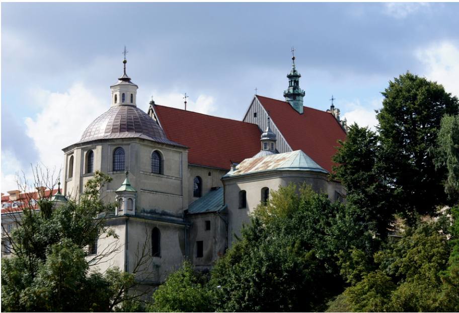
Kościół dominikanów, widok od północy