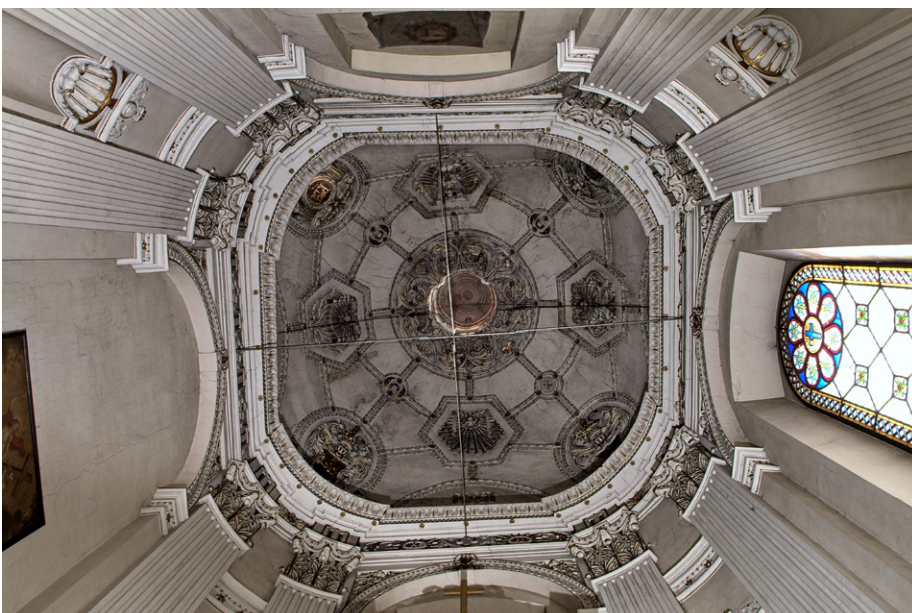
Kościół dominikanów, wnętrze kaplicy firlejowskiej