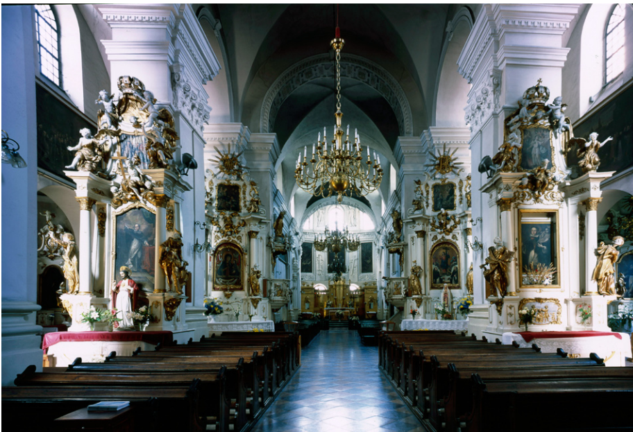
Kościół dominikanów, wnętrze