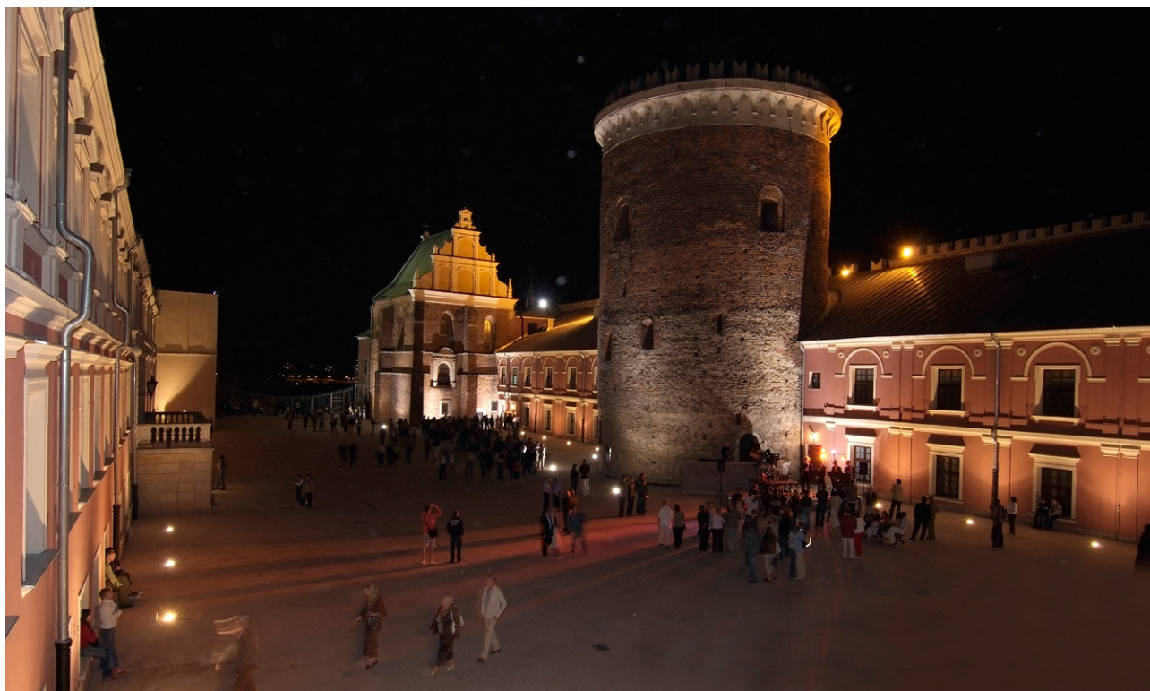
Dziedziniec zamkowy podczas Nocy Muzeów P. Maciuk