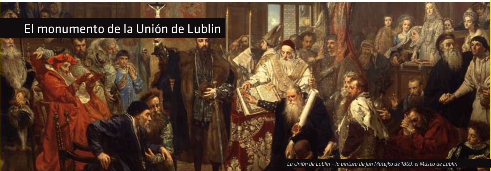
La Unión de Lublin – la pintura de Jan Matejko de 1869, el Museo de Lublin