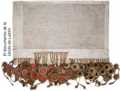
El documento de la Unión de Lublin

El objetivo del Sello de Patrimonio Europeo no es proteger los sitios, sino promover su dimensión europea, hacerlos accesibles a un grupo de recipientes lo más amplio posible, especialmente a la gente joven, así como proporcionar información de alta calidad y organizar actividades educativas y culturales que subrayen el papel y el lugar de cada sitio en la historia de Europa y en la integración europea. Además, el Sello de Patrimonio Europeo puede aportar beneficios económicos, contribuyendo al desarrollo del turismo cultural.