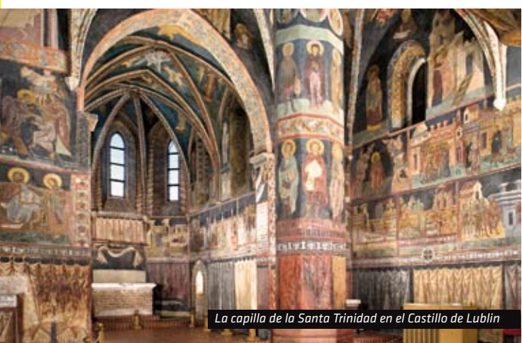
La capilla de la Santa Trinidad en el Castillo de Lublin