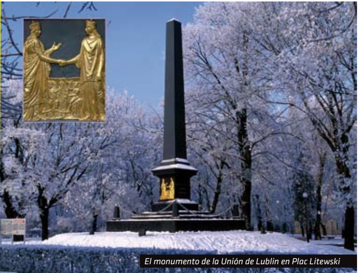
El monumento de la Unión de Lublin en Plac Litewski