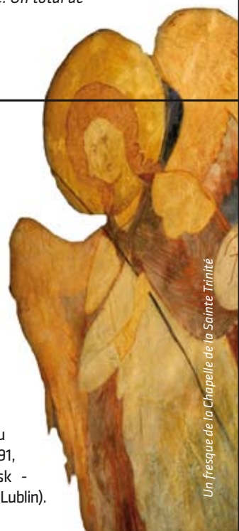
Un fresque de la Chapelle de la Sainte-Trinité

de l'Autriche, la Halle médiévale de la Grande Guilde à Tallinn en Estonie et deux sites aux Pays-Bas: le Palais de la paix à La Haye, qui abrite le siège de la Cour internationale de Justice, et le camp de transit nazi de la Seconde Guerre mondiale à Westerbork dans la région de Hooghalen dans le nord-est du pays. En 2014 les états qualifiés pour soumettre des propositions ont présenté à la Commission européenne un total de 36 candidatures. Un groupe d'experts européen a recommandé d'attribuer le Label à 16 candidatures, tandis que la Pologne est le seul pays de l'UE qui a reçu trois nominations (la Constitution du 3 mai 1791, les Chantiers navals historiques de Gdansk - associés à la création de la Solidarité et l'Union de Lublin).