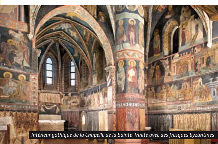
Intérieur gothique de la Chapelle de la Sainte-Trinité avec des fresques byzantines