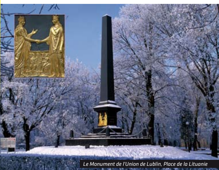
Le Monument de l'Union de Lublin, Place de la Lituanie