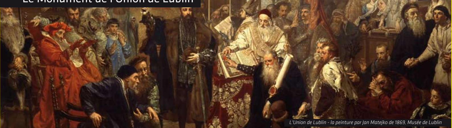
L'Union de Lublin - la peinture par Jan Matejko de 1869, Musée de Lublin